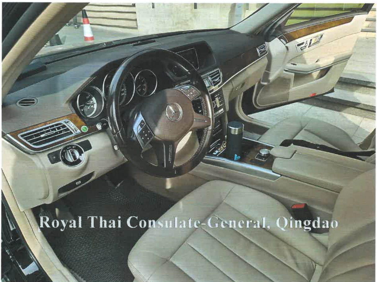
Royal Thai Consulate-General, Qingdao