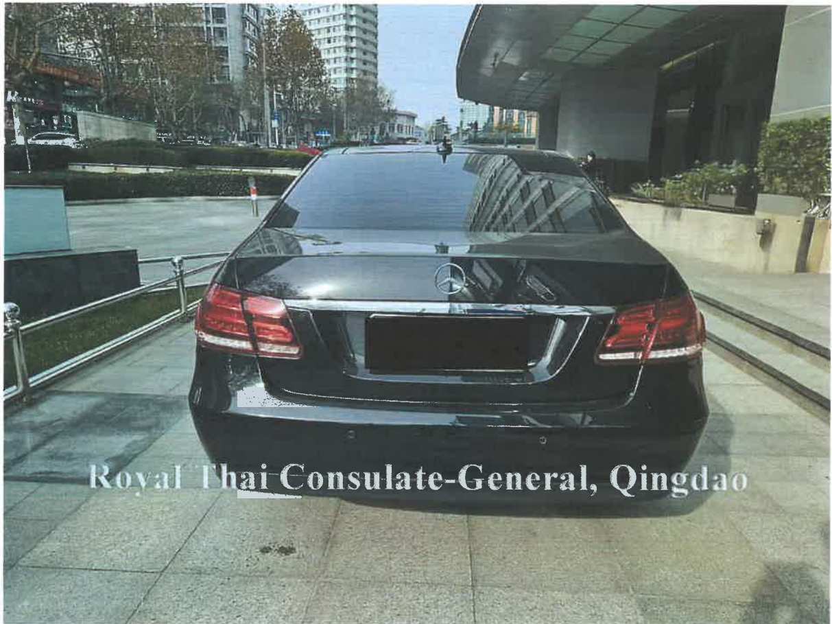
Royal Thai Consulate-General, Qingdao