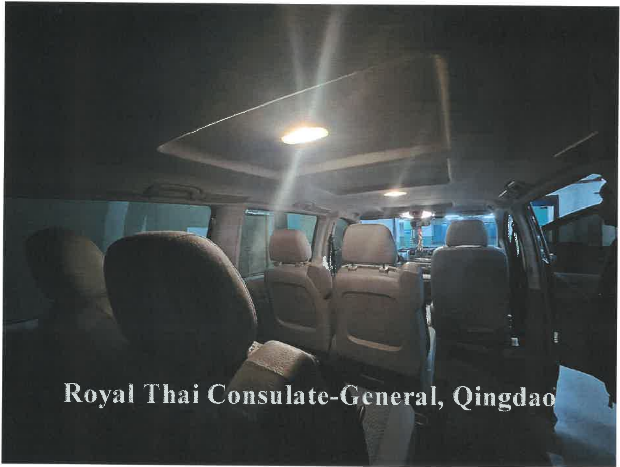
Royal Thai Consulate-General, Qingdao