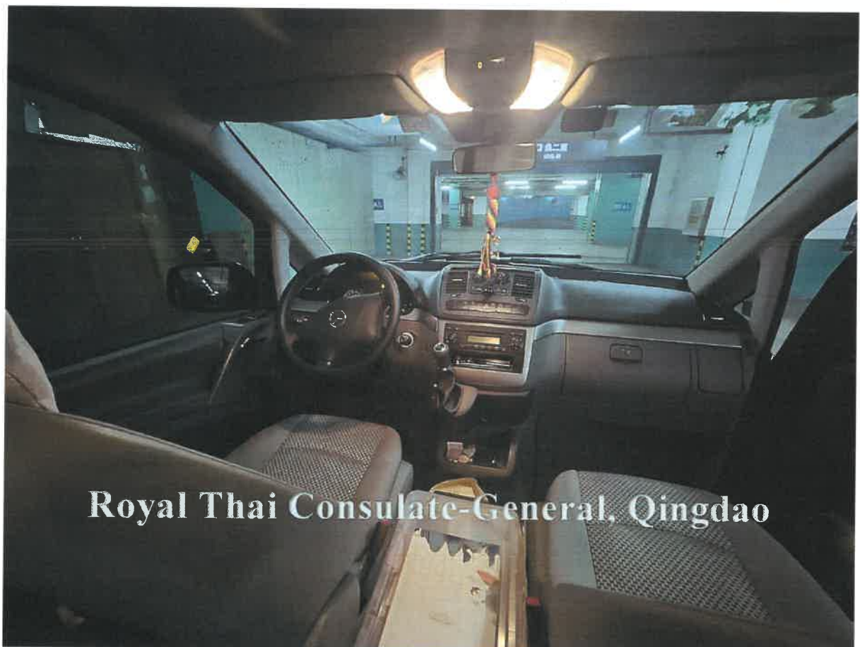
Royal Thai Consulate-General, Qingdao