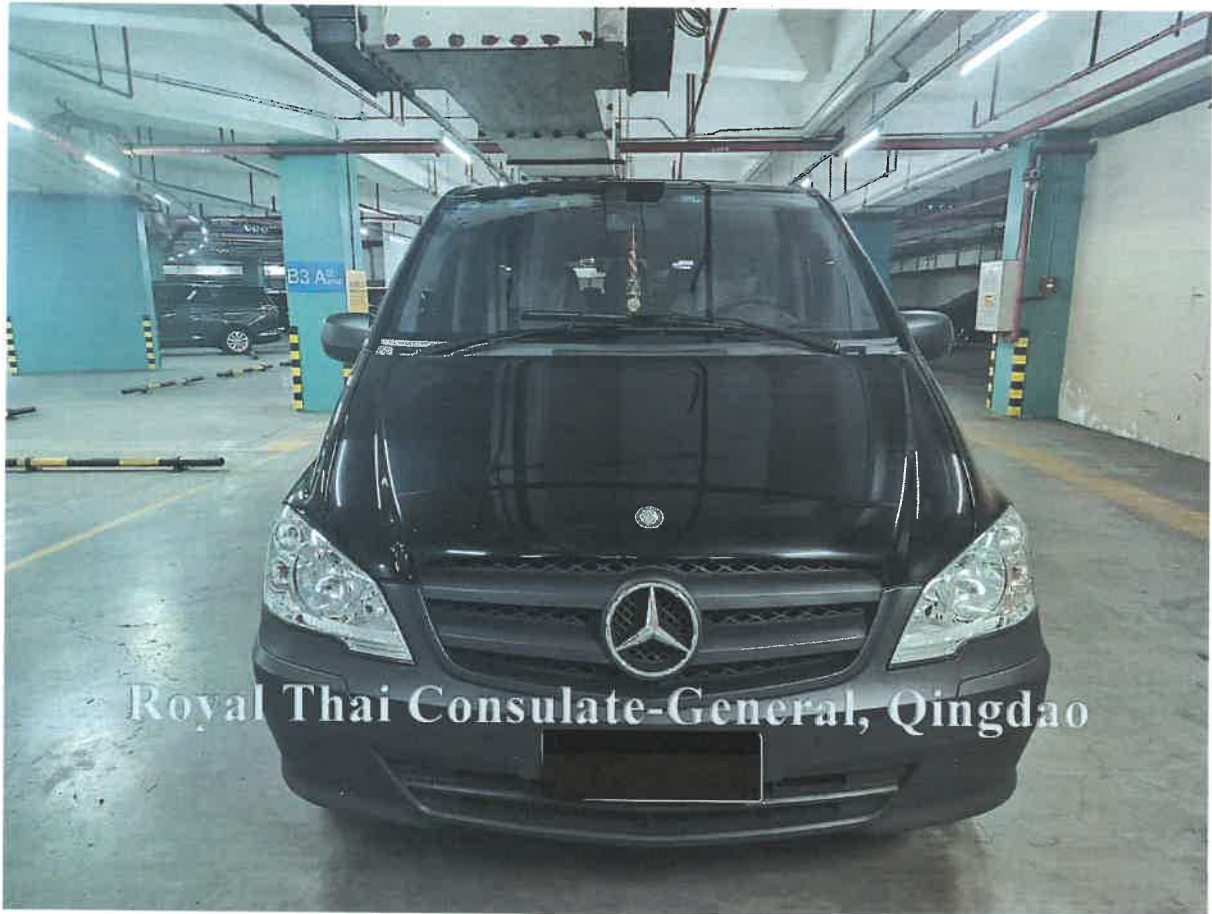
Royal Thai Consulate-General, Qingdao