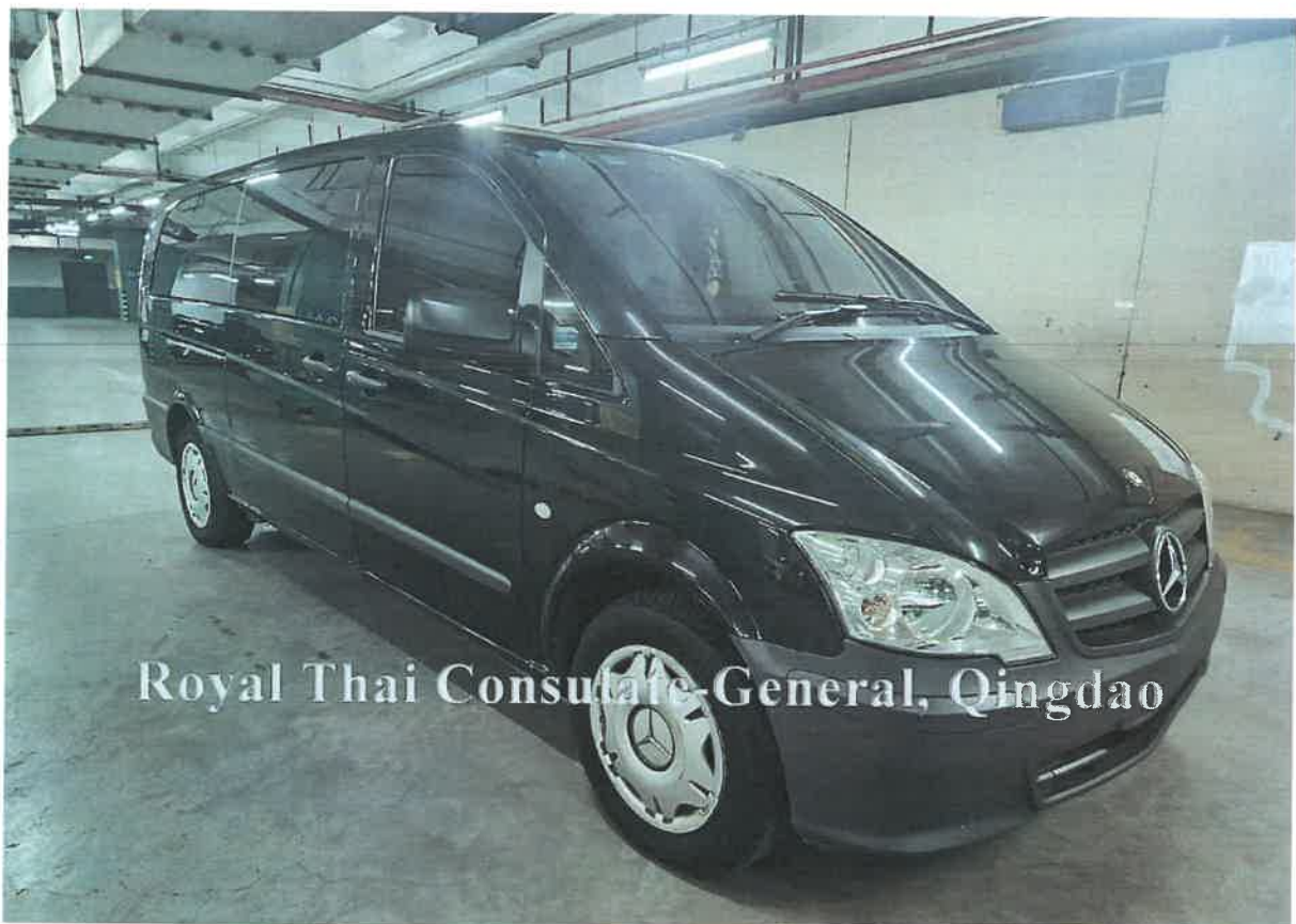
Royal Thai Consulate-General, Qingdao