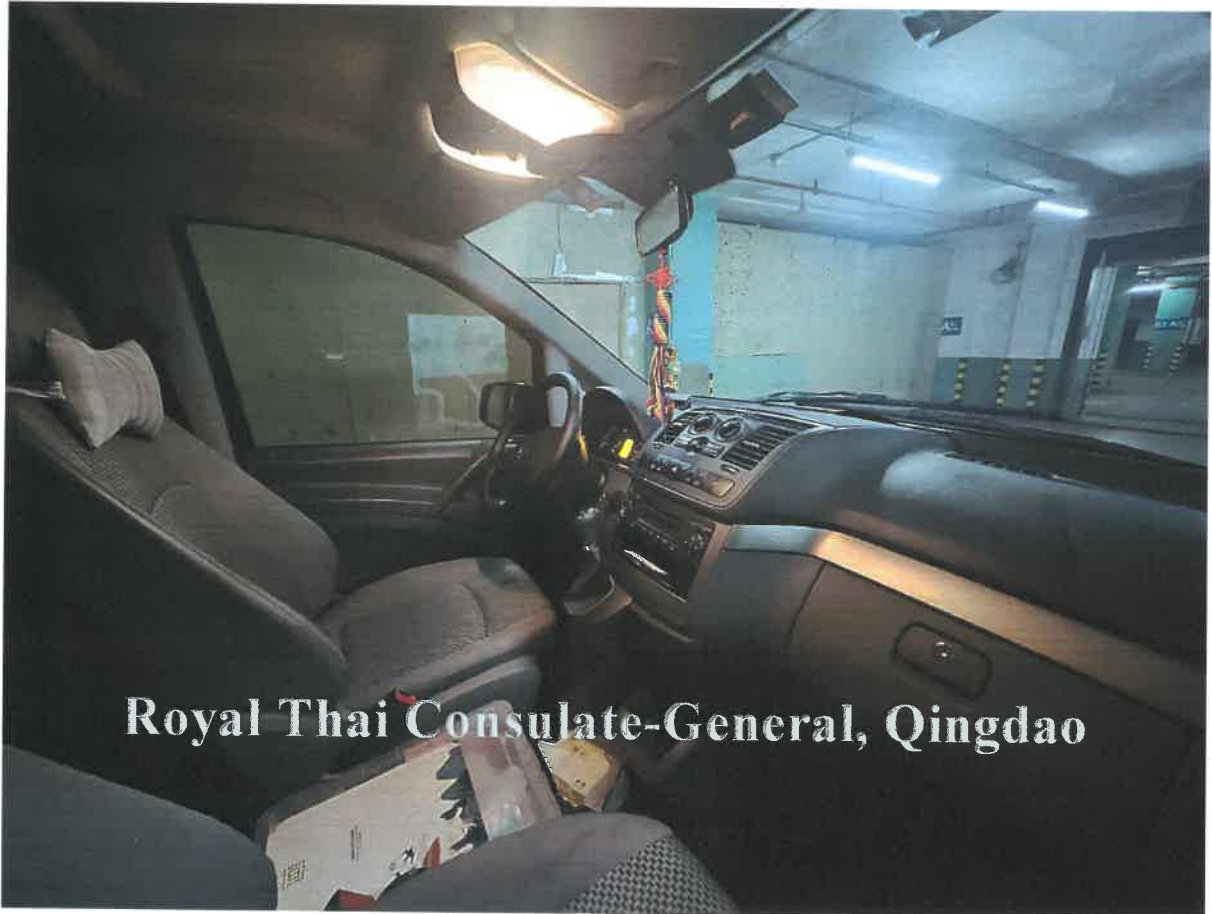
Royal Thai Consulate-General, Qingdao