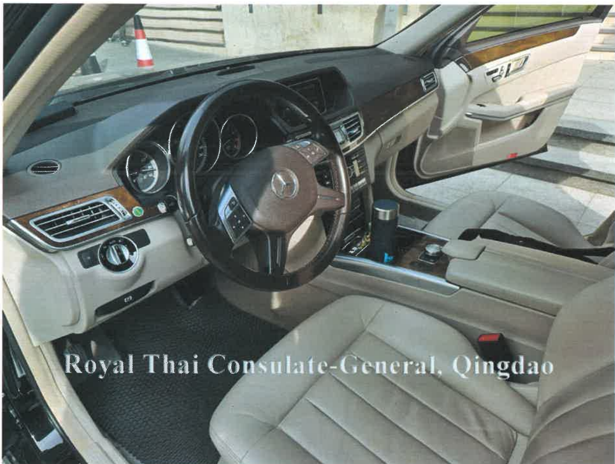
Royal Thai Consulate-General, Qingdao