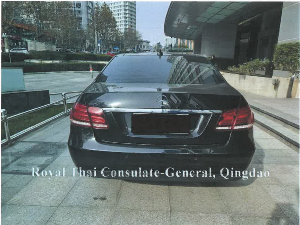
Royal Thai Consulate-General, Qingdao