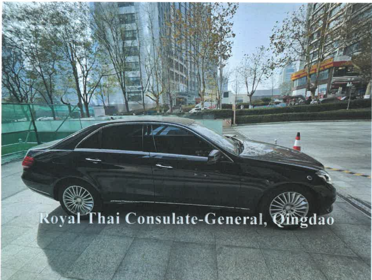
Royal Thai Consulate-General, Qingdao