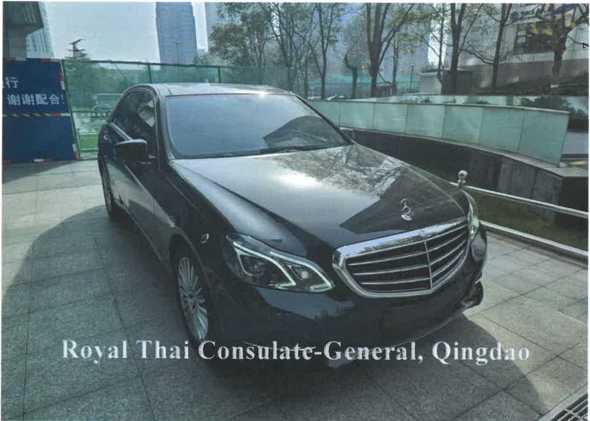
Royal Thai Consulate-General, Qingdao