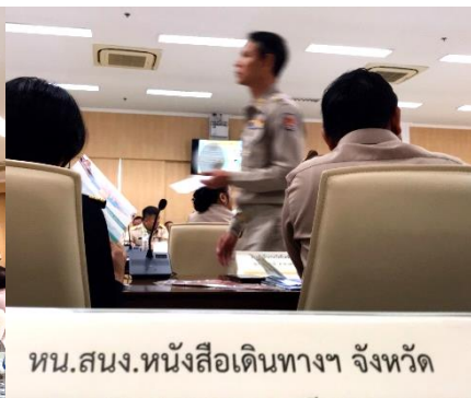
หน.สนง.หนังสือเดินทางฯ จังหวัด