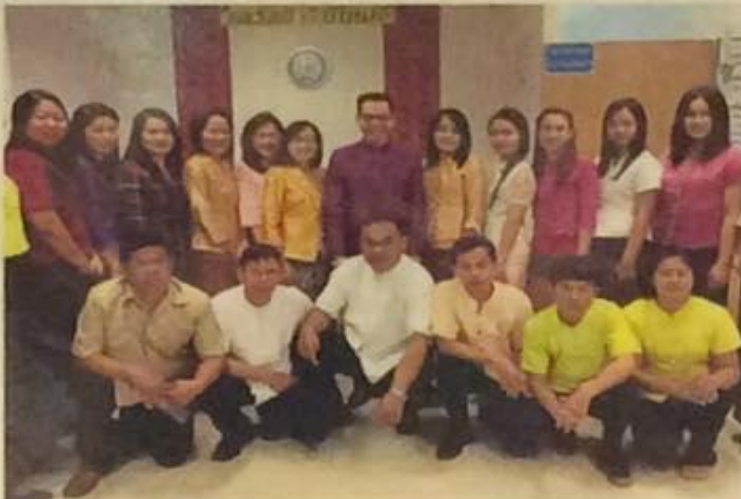
Staff of the Khao I Dang passport office in both traditional Thai clothing prior to a group photo before getting down to work.