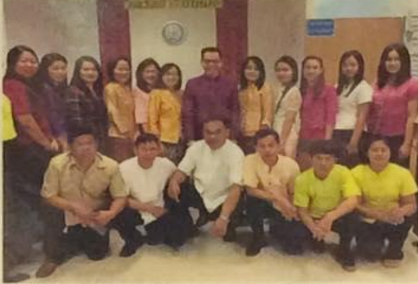
Staff of the Khao I Dang passport office in both traditional Thai clothing pose for a group photo before getting down to work.