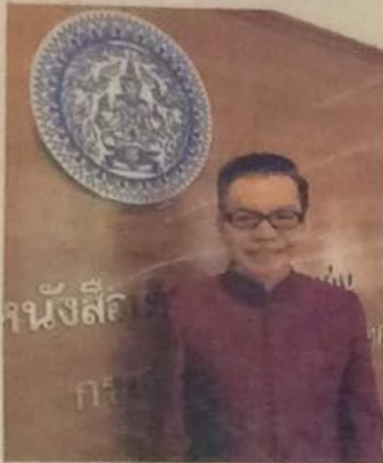
Immigration officials, staff at the temporary passport office in Khao I Dang, swap their staid uniform dress of work to wear a traditional Thai dress. It is a way of making tourists more comfortable about entering the office, according to immigration officials.