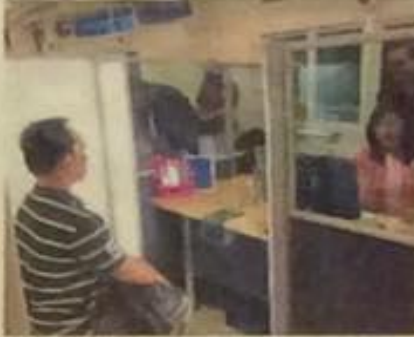
A man applying for a passport is served by staff member wearing traditional attire.

The traditional Thai dress is a symbol of Thai culture and identity, and it is the new trend. The traditional Thai dress is a symbol of Thai culture and identity, and it is the new trend. The traditional Thai dress is a symbol of Thai culture and identity, and it is the new trend. The traditional Thai dress is a symbol of Thai culture and identity, and it is the new trend.