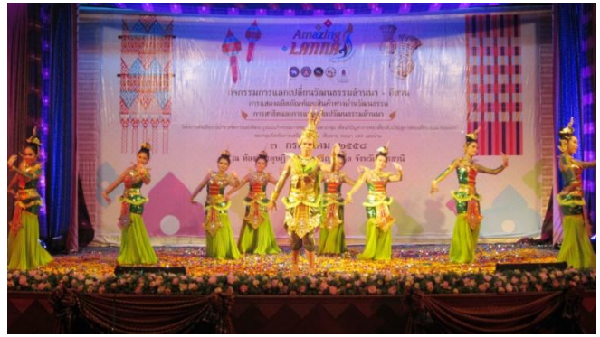
การแลกเปลี่ยนการแสดงศิลปวัฒนธรรมล้านนาและอีสาน