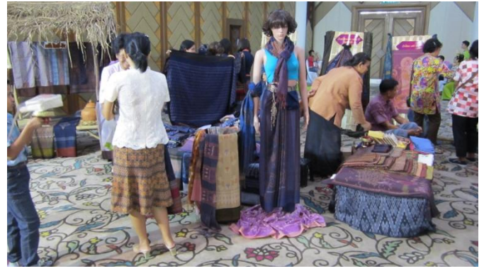
ชมการสาธิตและจัดแสดงผลภัณฑ์สินค้าทางด้านวัฒนธรรม จากกลุ่มจังหวัดล้านนา (เชียงใหม่ พะเยา แพร่ และน่าน)