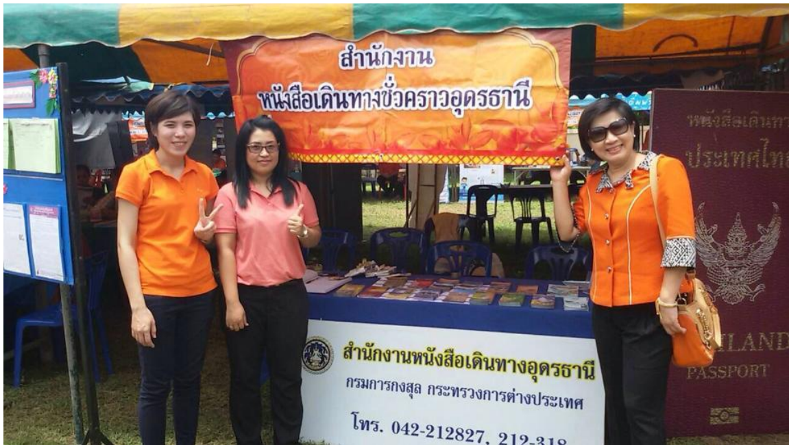
บุรณสำนักงานหนังสือเดินทางชั่วคราว อุดรธานี