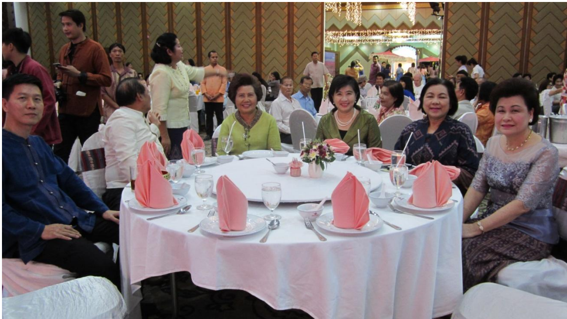
วัฒนธรรมจังหวัดอุดรธานี หัวหน้าส่วนราชการและภาคเอกชน รับประทานอาหารร่วมกัน