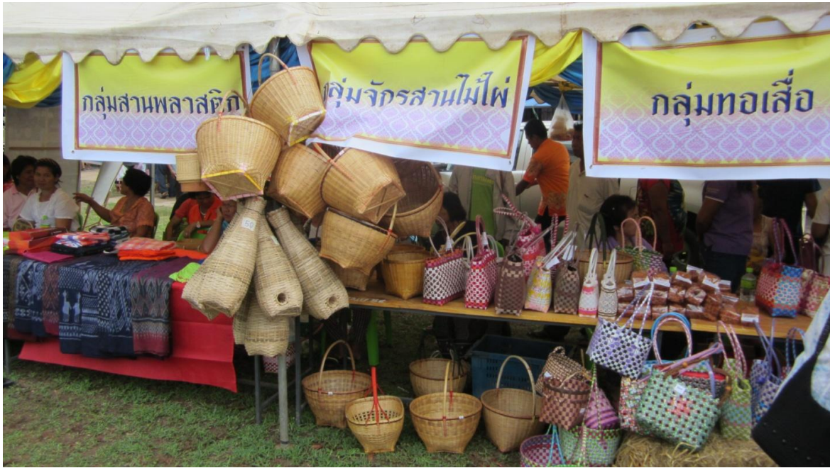
มีการจัดแสดง และจัดจำหน่ายสินค้าหัตถกรรม โดยกลุ่มแม่บ้านของแต่ละพื้นที่ เช่น เสื่อผ้า อาหาร เครื่องจักรสาน ข้าวของเครื่องใช้ วัสดุอุปกรณ์ที่ผลิตขึ้นใช้เองในครัวเรือน