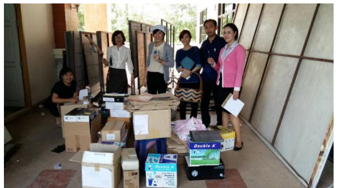
เมื่อวันที่ 1 กรกฎาคม 2558 หัวหน้าสำนักงานฯ รองหัวหน้าสำนักงานฯ เจ้าหน้าที่ และนักศึกษาฝึกงาน ร่วมด้วย ช่วยกัน จัดเก็บและทำความสะอาดห้องเก็บของ ของสำนักงานฯ