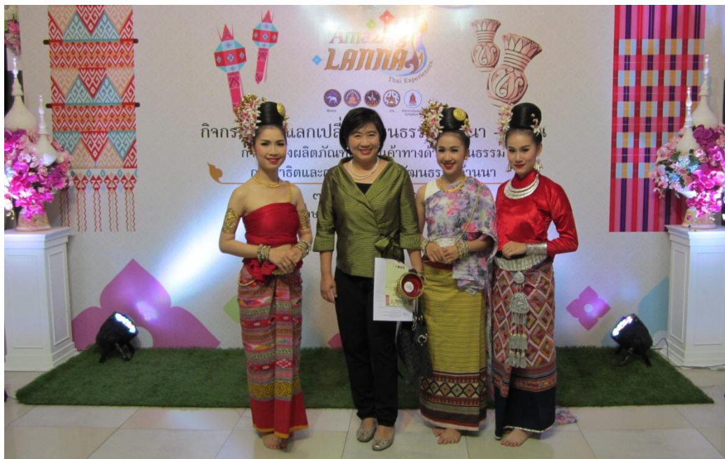
หัวหน้าสำนักงานหนังสือเดินทางฯ และนางรำ