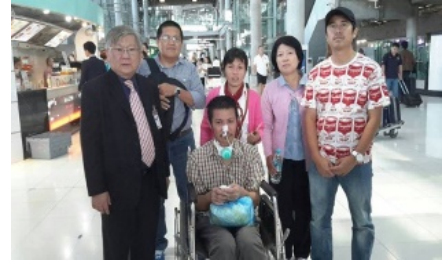
ภรรยา และทีมจากกระทรวง แรงงานมารับที่สุวรรณภูมิ