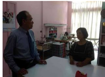
อทป.วิฑูร สุชะวันกุล ออกเยี่ยมแรงงานไทย ณ ร้านตัดเย็บเสื้อผ้า