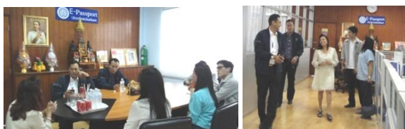
ที่ปรึกษารัฐมนตรีว่าการฯ และเลขานุการรัฐมนตรีว่าการฯ ตรวจเยี่ยมชมการดำเนินงานของสำนักงานหนังสือเดินทางชั่วคราว อุบลราชธานี