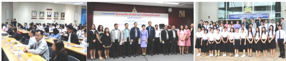
การบรรยายหัวข้อ “ ประชาคมอาเซียนและความเชื่อมโยงทางเศรษฐกิจในอนุภูมิภาค ” ณ มหาวิทยาลัยอุบลราชธานี จังหวัดอุบลราชธานี