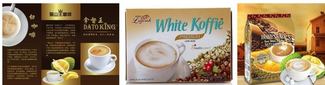
กาแฟเปรี้ยว กาแฟลดความอ้วน และกาแฟ Low Acid ที่เหมาะกับผู้ที่ดื่มกาแฟที่เป็นโรคกระเพาะ จากประเทศมาเลเซียและอินโดนีเซีย

ความก้าวหน้าทางเทคโนโลยี ส่งผลให้การรับข้อมูลข่าวสารจากต่างประเทศเป็นไปอย่างรวดเร็วและแพร่หลาย และทำให้ชาวซีอานมีความคิดที่เปิดรับและกล้าลองมากขึ้น สินค้าที่มีความแปลกใหม่ไม่จำเจจึงได้รับการตอบรับที่ดี