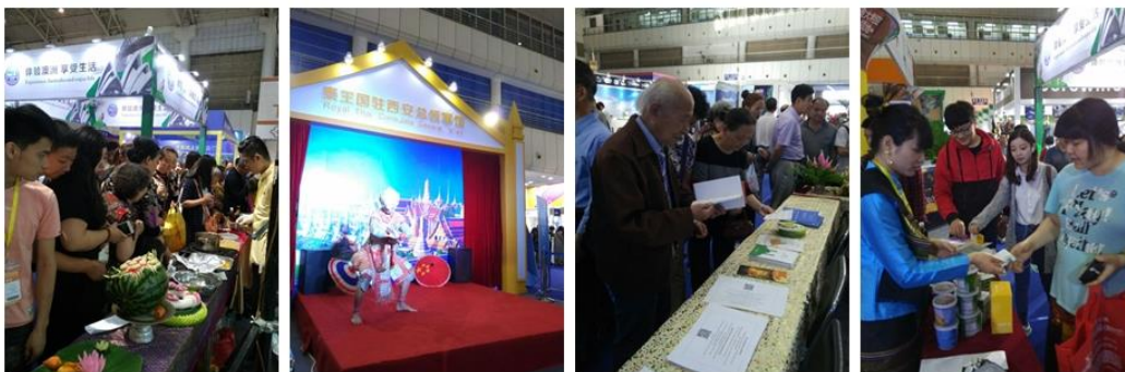
กิจกรรมประชาสัมพันธ์ประเทศไทย ของสถานกงสุลใหญ่ฯ

นอกเหนือจากกิจกรรมเผยแพร่วัฒนธรรมและประชาสัมพันธ์ประเทศไทยของสถานกงสุลใหญ่ฯ แล้ว ยังมีผู้ประกอบการไทยจำนวนหนึ่งเข้าร่วมออกร้านจำหน่ายสินค้า โดยมากเป็นสินค้ากลุ่มเพื่อสุขภาพ อาทิ ยาหม่องสมุนไพร ลูกประคบสมุนไพร หมอนสุขภาพจากยางพารา และเครื่องประดับทำจากดิน นอกจากนี้ ยังมีธุรกิจภาคบริการด้านการท่องเที่ยว อาทิ โรงแรมและบริษัทนำเที่ยวที่มาร่วมออกร้านเพื่อประชาสัมพันธ์ข้อมูลด้วย