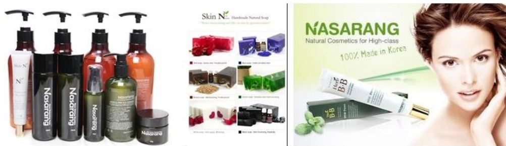
สินค้าที่มีความใกล้เคียงกับสินค้าจากประเทศไทย ที่ผู้ประกอบการนำมาออกจากร้านในงานมหกรรมซีเซี่ยตู้ยฯ