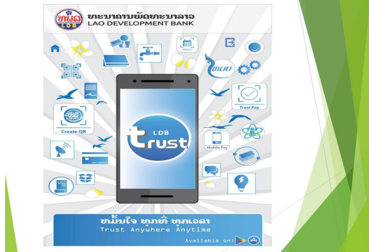
ภาพที่ 1 ระบบรับเงิน-จ่ายเงินผ่านธนาคารของลาว