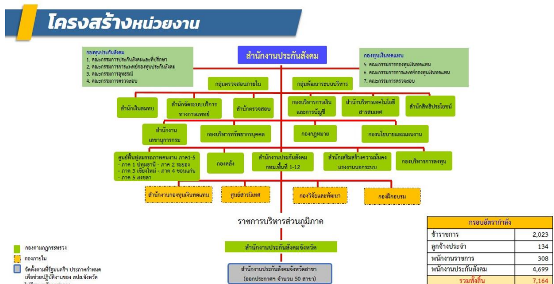
ภาพที่ 2 โครงสร้างหน่วยงานของสำนักงานประกันสังคมไทย

2) สำนักงานประกันสังคมไทย จะแบ่งเป็น 2 ส่วนหลัก คือ ส่วนกลาง และส่วนภูมิภาค โดยส่วนกลาง จะประกอบด้วย ส่วนบริหารส่วนกลางที่มีจำนวนทั้งสิ้น 19 หน่วยงาน สำนักงานประกันสังคมกรุงเทพมหานครพื้นที่ 12 แห่ง และศูนย์ฟื้นฟูสมรรถภาพคนงาน 5 แห่ง สำหรับส่วนภูมิภาค ประกอบด้วย สำนักงานประกันสังคมจังหวัด 76 จังหวัด และสำนักงานประกันสังคมสาขา จำนวน 50 สาขา ซึ่งมีบุคลากรทั่วประเทศ รวมทั้งสิ้นจำนวน 7,164 คน