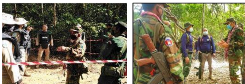
ภาพที่ 3 ทหารกัมพูชาขอให้ฝ่ายไทยยุติปฏิบัติการเก็บกู้ทุ่นระเบิดสังหารบุคคล 13

อุปสรรคหลักที่ฝ่ายไทยเผชิญในการเก็บกู้ทุ่นระเบิดสังหารบุคคลในพื้นที่ชายแดน ไทย-กัมพูชา ได้แก่ (1) การเข้าถึงพื้นที่ปนเปื้อนทุ่นระเบิดสังหารบุคคล ซึ่งที่ผ่านมา (เดือนพฤศจิกายน 2563 ถึงเดือนมีนาคม 2565) กองกำลังทหารในท้องถิ่นของกัมพูชาได้เข้ามาขอให้หน่วยปฏิบัติการของไทย ยุติการปฏิบัติการ 34 ครั้ง ทำให้ศูนย์ปฏิบัติการทุ่นระเบิดแห่งชาติตัดสินใจยกเลิกการปฏิบัติการในพื้นที่ตามแนวชายแดนและพื้นที่ที่มีการอ้างสิทธิ์ในดินแดนที่ทับซ้อนกันอยู่ และรอกการปักปันเขตแดน 14,313,869 ตารางเมตร และ (2) การขาดกลไกประสานงานอย่างเป็นทางการระหว่างฝ่ายไทยและฝ่ายกัมพูชาในการแปลผลการประชุมคณะกรรมการชายแดนทั่วไป (General Border Committee: GBC) ไทย-กัมพูชา ครั้งที่ 13 (21 มีนาคม 2561) ครั้งที่ 14 (13-14 กุมภาพันธ์ 2562) ครั้งที่ 15 (24-25 พฤศจิกายน 2565) ซึ่งสองฝ่ายสนับสนุนให้เดินหน้าเก็บกู้ทุ่นระเบิดสังหารบุคคล โดยระบุว่าปฏิบัติการเก็บกู้ทุ่นระเบิดสังหารบุคคลทั้งหมดจะไม่ส่งผลกระทบต่อสิทธิของทั้งสองฝ่ายในส่วนที่เกี่ยวข้องกับประเด็นชายแดนทางบกระหว่างไทยกับกัมพูชารายใต้กฎหมายระหว่างประเทศ 12