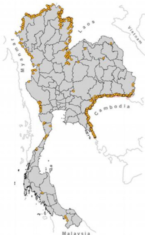
ภาพที่ 1 แผนที่พื้นที่ปนเปื้อนทุ่นระเบิดสังหารบุคคลเมื่อไทยเข้าเป็นรัฐภาคีอนุสัญญา 6

ไทยมีพื้นที่ 2,556.7 ตารางกิโลเมตร ที่ได้รับผลกระทบจากระเบิดสังหารบุคคล ครอบคลุม 531 ชุมชน 185 ตำบล 84 อำเภอ 27 จังหวัด 4 และมีประชาชนที่ได้รับผลกระทบ 504,303 คน โดยมีผู้เสียชีวิต 1,497 คน และผู้ได้รับบาดเจ็บ 1,971 คน 5