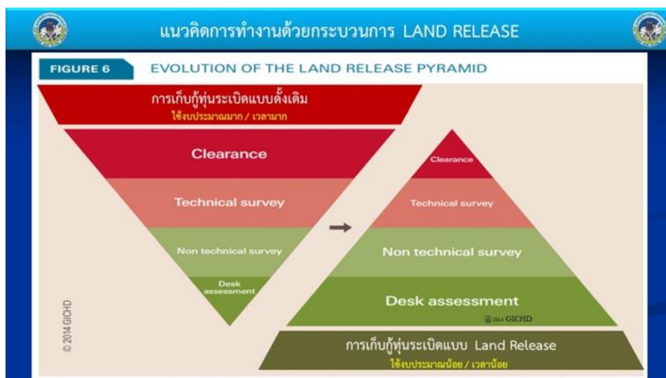
ภาพที่ 4 ภาพเปรียบเทียบระหว่างการเก็บทุ่นระเบิดแบบดั้งเดิมกับการเก็บทุ่นระเบิดแบบ Land Release) 19

(ง) สถานการณ์การเมืองภายในประเทศที่อ่อนไหว รวมถึงการเปลี่ยนแปลงรัฐบาลและผู้นำประเทศค่อนข้างบ่อยทำให้เกิดความไม่มั่นคงและส่งผลกระทบต่อความต่อเนื่องของการดำเนินนโยบายการเก็บทุ่นระเบิดสังหารบุคคลของไทย