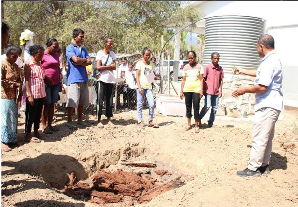
ภาพที่ 6 การจัด workshop เรื่องการประยุกต์ใช้หลักปรัชญาของเศรษฐกิจพอเพียงของไทย