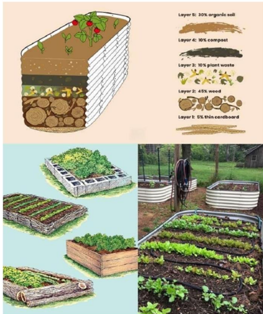
ภาพที่ 9 การออกแบบบล็อกดินสำหรับปลูกผักที่จะดำเนินการในเดือนกันยายน 2567