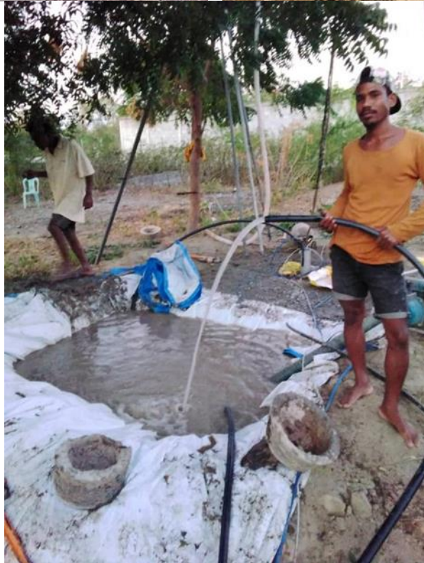
ภาพที่ 4 ความช่วยเหลือบูรณะซ่อมแซมระบบน้ำบาดาลให้แก่โครงการต่อยอดติศึกษา