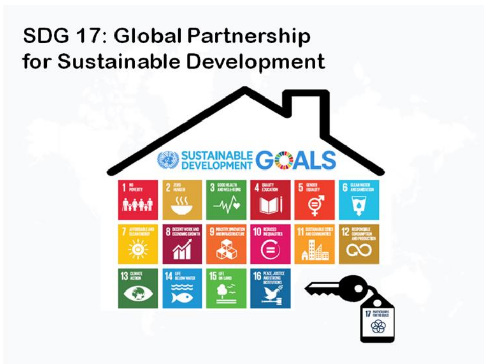
ภาพที่ 2 SDG 17: Global Partnership for Sustainable Development