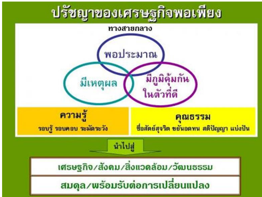
ภาพที่ 1 ปรัชญาของเศรษฐกิจพอเพียงภายใต้หลักการ 3 ห่วง 2 เงื่อนไข