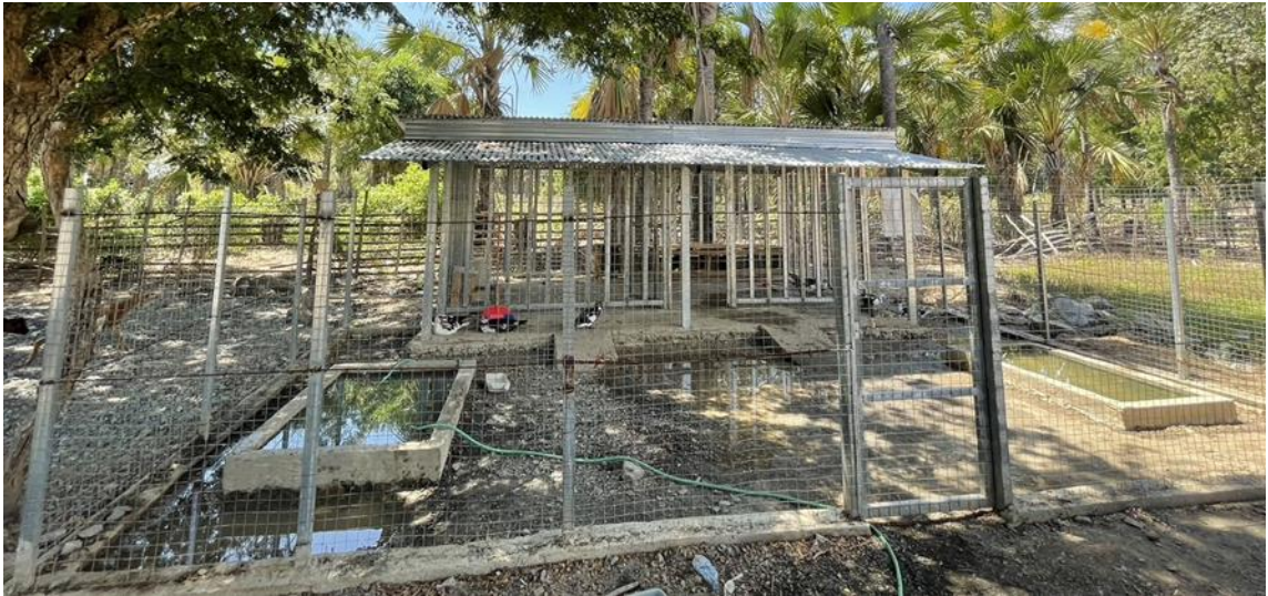
ภาพที่ 7 สนับสนุนการสร้างเล้าเปิดและการเลี้ยงเปิดพันธุ์พื้นเมือง