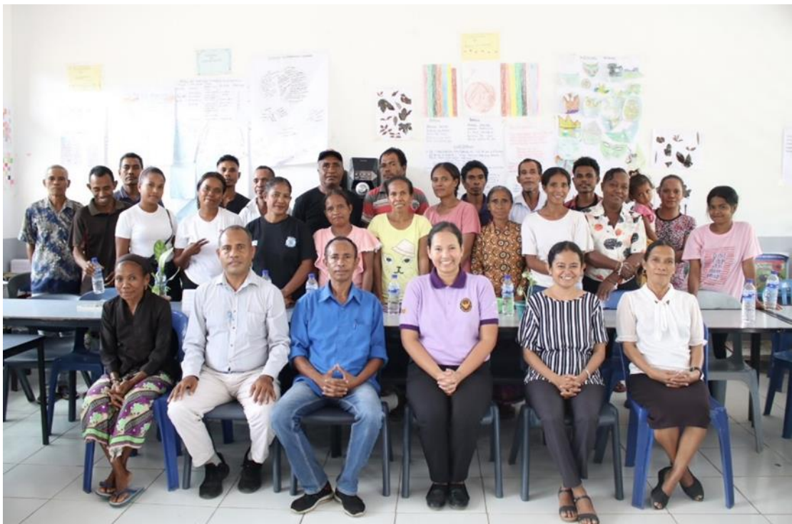
ภาพที่ 8 ทีมงานผู้สนับสนุนการสร้างเล้าเปิดและอบรมการเลี้ยงเปิด