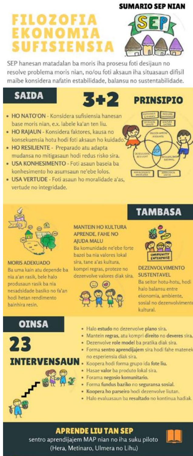
ภาพที่ 3 หลักปรัชญาของเศรษฐกิจพอเพียงที่แปลเป็นภาษาเตตุม (ต่อ)