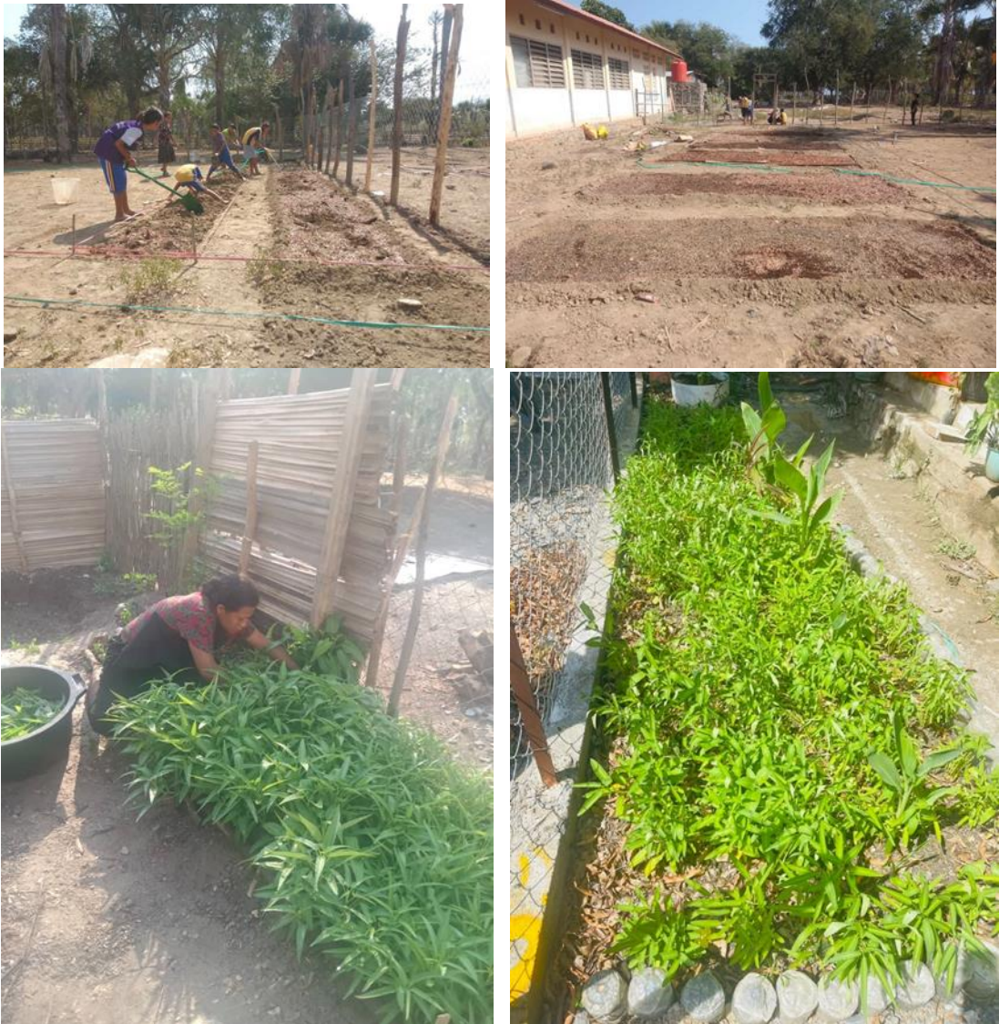
ภาพที่ 5 กิจกรรมการปลูกผักของโรงเรียนหลังจากระบบน้ำบาดาลกลับมาเป็นปกติ