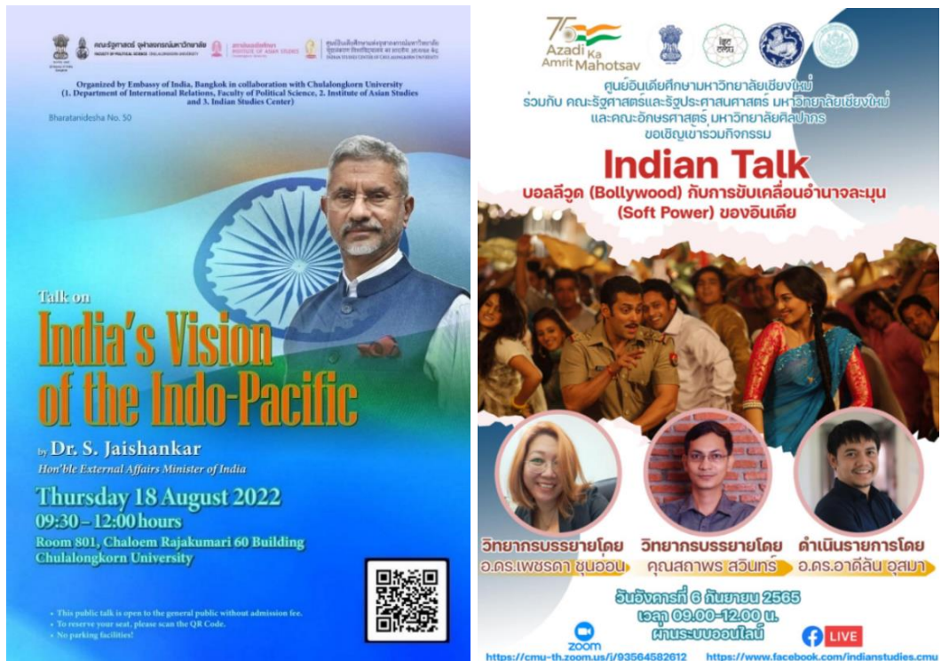
ภาพที่ 2 ตัวอย่างกิจกรรมที่จัดโดยศูนย์อินเดียศึกษาในมหาวิทยาลัยต่าง ๆ ของไทย

4) การจัดประชุมและสัมมนาเพื่อแลกเปลี่ยนความคิดเห็นในหลากหลายหัวข้อที่เกี่ยวข้องและมีความสำคัญต่อวัฒนธรรมอินเดีย รวมถึงการให้การสนับสนุนแก่มหาวิทยาลัยและสถาบันการศึกษาต่าง ๆ ในการจัดกิจกรรมในหัวข้อที่อยู่ภายใต้ความรับผิดชอบของ ICCR โดยใน ค.ศ. 2018 ICCR ได้จัดการประชุม/สัมมนาระหว่างประเทศ 4 งาน ในหัวข้อเกี่ยวกับ Indology โยคะ ความเชื่อมโยงด้านภาษาระหว่างเปอร์เซียกับสันสกฤต และความเป็นประชาธิปไตย นอกจากนี้ ยังได้สนับสนุนงบประมาณในการจัดงานสัมมนา 7 งาน ทั้งในอินเดียและต่างประเทศ ได้แก่ สหราชอาณาจักร จีน รัสเซีย และมอริเชียส