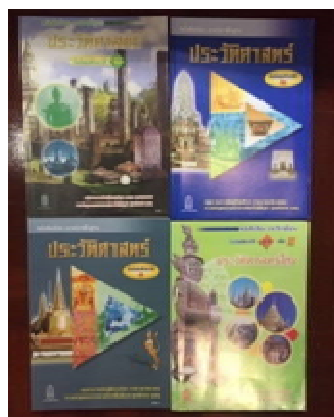
ภาพที่ 2 แบบเรียนประวัติศาสตร์ ชั้นมัธยมศึกษาปีที่ 1-6 หลักสูตรการศึกษาขั้นพื้นฐาน พ.ศ. 2551 ของไทยในปัจจุบัน