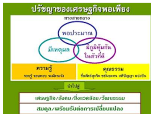
ภาพที่ 1 แสดงปรัชญาเศรษฐกิจพอเพียง

เศรษฐกิจพอเพียง หรือความพอเพียง หมายถึง ความพอประมาณ มีเหตุผล มีภูมิคุ้มกัน เพื่อให้สามารถป้องกันผลกระทบใด ๆ อันเกิดจากการเปลี่ยนแปลงทั้งภายนอกและภายใน โดยบุคคลหรือองค์กรจะรักษาให้เกิดความพอเพียงได้ต้องอาศัยความรู้ (รอบรู้ รอบคอบ ระมัดระวัง) และคุณธรรม (ซื่อสัตย์สุจริต ขยันหมั่นเพียร มีสติ และแบ่งปัน) เป็นรากฐาน ซึ่งเมื่อปฏิบัติตามหลักความพอเพียง หรือเศรษฐกิจพอเพียงแล้วจะนำไปสู่ความสามารถรองรับการเปลี่ยนแปลงอย่างรวดเร็วและกว้างขวาง ทั้งด้านวัตถุ (เศรษฐกิจ) สังคม สิ่งแวดล้อม และวัฒนธรรมจากโลกภายนอกได้เป็นอย่างดี 3