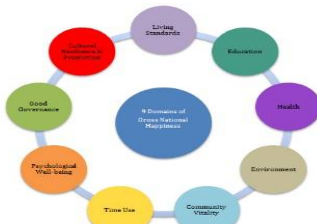
ภาพที่ 3 แสดงแนวคิด Gross National Happiness ใน 9 domain