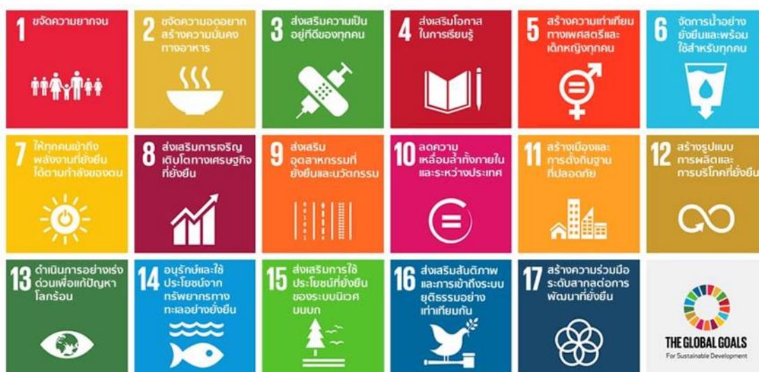
ภาพที่ 1 ตาราง SDGs 17 ข้อ ตามภาคผนวก ก

เมื่อวันที่ 25 กันยายน พ.ศ. 2558 ที่ประชุมสมัชชาใหญ่แห่งสหประชาชาติ โดยผู้นำประเทศต่าง ๆ ได้รับรองเอกสาร “Transforming Our World: The 2030 Agenda for Sustainable Development” เพื่อสานต่อภารกิจที่ยังไม่บรรลุผลสำเร็จภายใต้ MDGs และกำหนดเป้าหมายการพัฒนาอย่างยั่งยืน (Sustainable Development Goals–SDGs) เพื่อใช้เป็นวาระแห่งการพัฒนาของโลกในอีก 15 ปีข้างหน้า (พ.ศ. 2559–2573) โดยประกอบด้วยเป้าหมายหลัก (goals) 17 ข้อ และเป้าประสงค์ (targets) 169 ข้อ