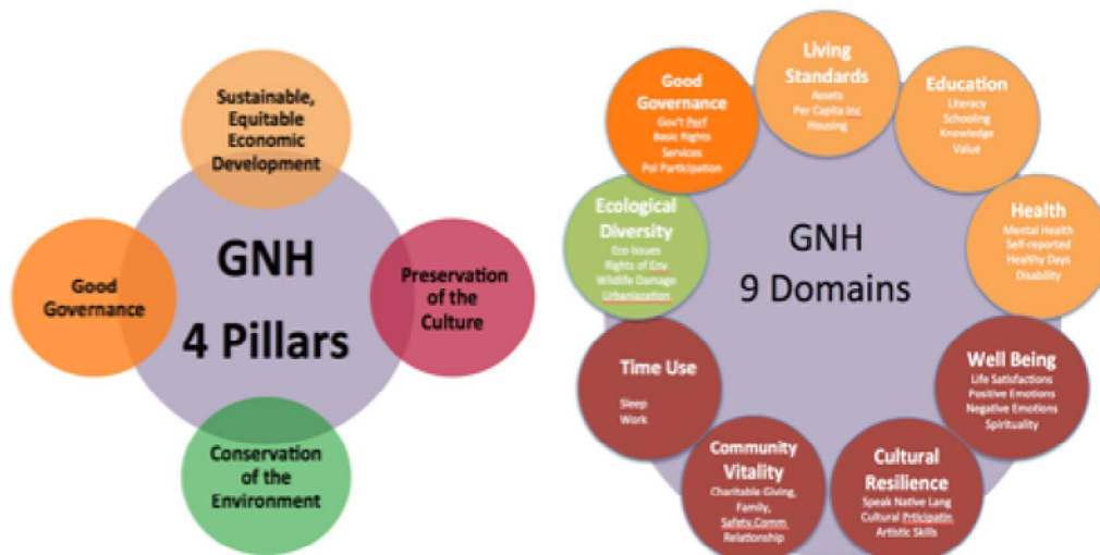
ภาพที่ 5 แนวคิดความสุขมวลรวมประชาชาติ

โครงสร้างพื้นฐาน การจัดการความยากจน การอนุรักษ์สิ่งแวดล้อม และการรักษาวัฒนธรรมประเพณีประจำชาติ