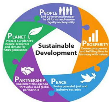
ภาพที่ 2 การพัฒนาอย่างยั่งยืน