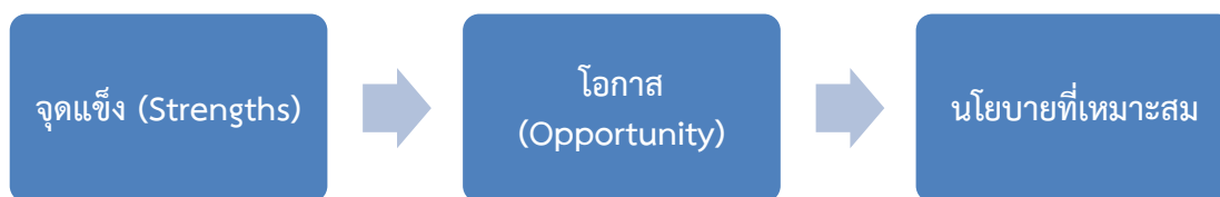
ภาพที่ 2 รูปแบบคู่ความสัมพันธ์ที่ 1

1) สวิตเซอร์แลนด์มีจุดแข็งด้านนโยบายทางการเมืองและการต่างประเทศที่เป็นกลางและมีนโยบายทางการเมืองในการให้ความช่วยเหลือที่มีเป้าหมาย เป็นรูปธรรมชัดเจน ส่งผลให้เกิดโอกาสในแง่ความไว้วางใจ เชื่อถือและเกิดความร่วมมือที่ดีจากประเทศผู้รับ ขณะที่ไทยมีปัญหาเรื่องเสถียรภาพทางการเมืองทำให้นโยบายในด้านนี้ที่เพิ่งเป็นรูปเป็นร่างขาดพัฒนาการและความต่อเนื่อง