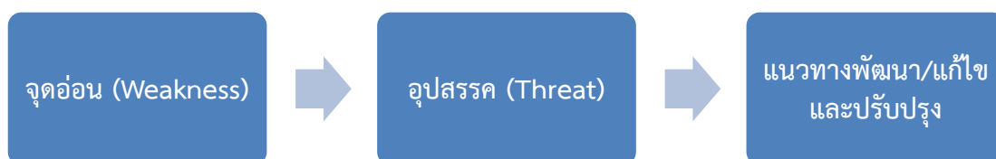
ภาพที่ 3 รูปแบบคู่ความสัมพันธ์ที่ 2

3.4.2.2 รูปแบบความสัมพันธ์ของทฤษฎี SWOT Analysis กับนโยบายและรูปแบบการให้ความช่วยเหลือด้านการพัฒนา รูปแบบคู่ความสัมพันธ์ที่ 2