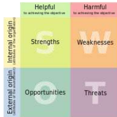
ภาพที่ ๒ SWOT Analysis

๑) Strengths หมายถึง จุดเด่นหรือจุดแข็ง ซึ่งเป็นผลมาจากปัจจัยภายใน เป็นข้อดีที่เกิดจากสภาพแวดล้อมภายในองค์กร