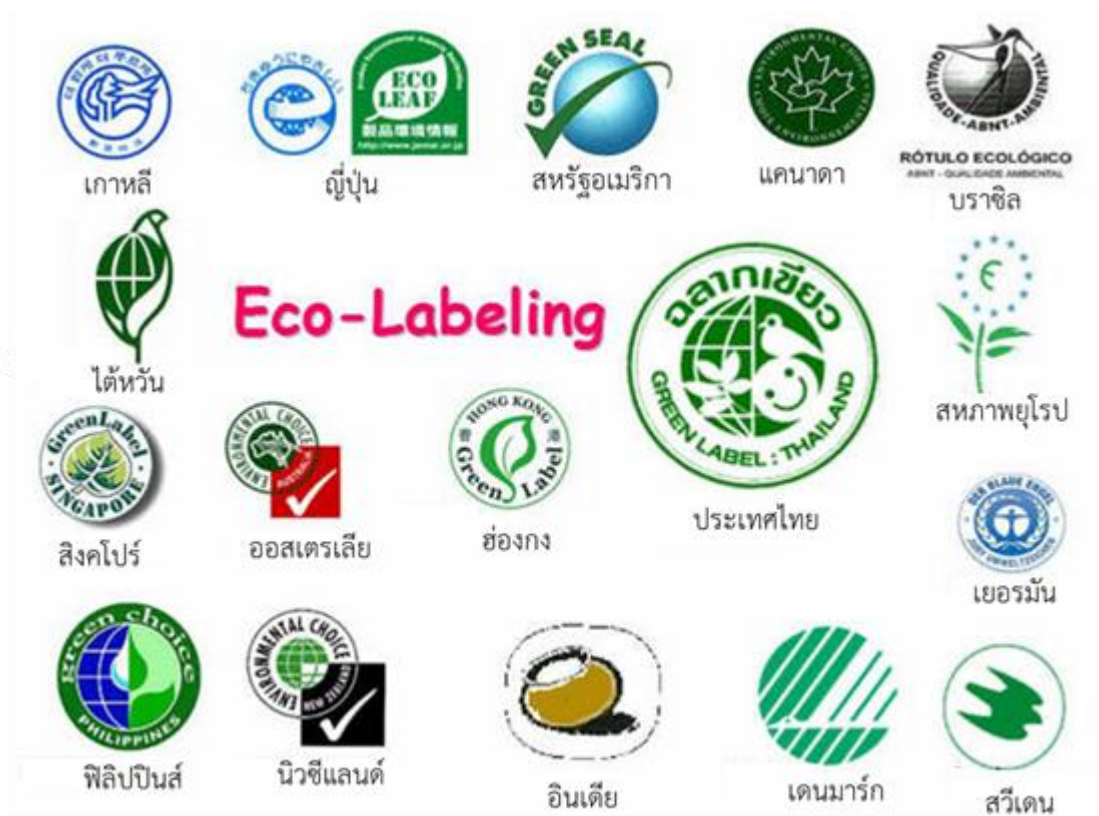
ภาพที่ ๑ ตัวอย่างฉลากเขียวของประเทศต่างๆ

๑.๕.๓ โรงแรมที่ได้รับการรับรองใบไม้เขียว เป็นโครงการที่ดำเนินการเพื่อพัฒนาประสิทธิภาพการใช้พลังงานและพัฒนาคุณภาพสิ่งแวดล้อมของธุรกิจการท่องเที่ยวและการโรงแรม มุ่งเน้นการใช้พลังงานรวมถึงการใช้ทรัพยากรธรรมชาติอย่างรู้คุณค่า ซึ่งดำเนินการโดยมูลนิธิใบไม้เขียว