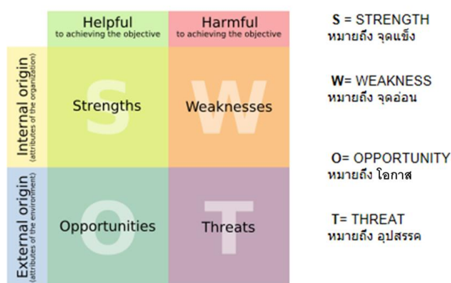
ภาพที่ ๒ SWOT Analysis

การวิเคราะห์จุดอ่อนจุดแข็ง หรือ SWOT Analysis เป็นการวิเคราะห์หรือประเมินสถานการณ์ของหน่วยงานหรือโครงการ เพื่อค้นหาจุดแข็ง โอกาส จุดด้อย อุปสรรค หรือสิ่งทีอาจเป็นปัญหาสำคัญต่อการดำเนินงาน การวิเคราะห์ SWOT เป็นการวิเคราะห์สภาพการณ์ (Situation Analysis) ซึ่งหลักการสำคัญคือการวิเคราะห์โดยการสำรวจจากสภาพการณ์ ๒ ด้าน ได้แก่ (๑) การสำรวจจากสภาพการณ์ภายใน ซึ่งเป็นการวิเคราะห์จุดแข็งหรือข้อได้เปรียบ (Strength) จุดอ่อนหรือข้อเสียเปรียบ (Weakness) เพื่อให้รู้ตนเอง (รู้เรา) และ (๒) การสำรวจจากสภาพการณ์ภายนอก เพื่อให้รู้จักสภาพแวดล้อม (รู้เขา) ชัดเจน โดยการวิเคราะห์โอกาสที่จะดำเนินการได้ (Opportunity) อุปสรรค หรือข้อจำกัด หรือปัจจัยที่คุกคามการดำเนินงาน (Threat) ทำให้ทราบว่าหน่วยงานหรือโครงการมีศักยภาพมากน้อยเพียงใด ซึ่งการวิเคราะห์ปัจจัยทั้งภายในและภายนอกองค์กร จะช่วยให้ผู้บริหารขององค์กรทราบถึงการเปลี่ยนแปลงต่างๆ ที่เกิดขึ้น ทั้งสิ่งที่ได้เกิดขึ้นแล้วและแนวโน้มของการเปลี่ยนแปลงในอนาคต มีจุดแข็งอะไรบ้างที่ควรคงไว้ ซึ่งหน่วยงานหรือโครงการสามารถนำมาใช้ประโยชน์ในการทำงานเพื่อให้บรรลุวัตถุประสงค์ได้ และมีจุดอ่อนอะไรบ้างที่ควรได้รับการปรับปรุงให้ดีขึ้น โดยที่โอกาสคือปัจจัยและสถานการณ์ภายนอกที่เป็นประโยชน์และเอื้ออำนวยให้การทำงานบรรลุวัตถุประสงค์ ในขณะที่อุปสรรคคือปัจจัยหรือสถานการณ์ภายนอกที่เป็นตัวที่ขัดขวางการดำเนินการขององค์กรไม่ให้บรรลุวัตถุประสงค์ ซึ่งข้อมูลเหล่านี้เป็นเครื่องมือที่เป็นประโยชน์ต่อการพัฒนาหน่วยงานหรือโครงการเพื่อให้สามารถทำการปรับปรุงหน่วยงานหรือโครงการได้อย่างมีประสิทธิภาพ และเป็นประโยชน์อย่างมากต่อการกำหนดวิสัยทัศน์ การกำหนดกลยุทธ์ และการดำเนินการตามกลยุทธ์ต่อไป