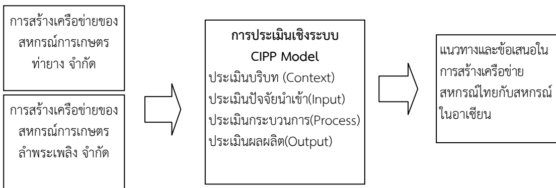
แผนภูมิที่ ๓ กรอบแนวคิดในการศึกษา

พัฒนาเครือข่ายให้เข้มแข็งยิ่งขึ้น รวมทั้งเป็นแบบอย่างในการสร้างเครือข่ายอื่นต่อไป มีกรอบแนวคิดในการดำเนินการ ดังนี้