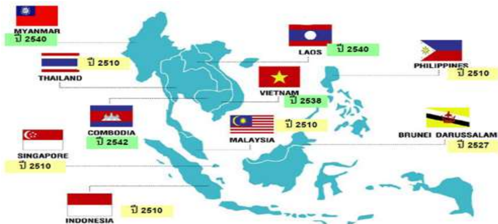
แผนภาพที่ ๑ แสดงประเทศสมาชิกอาเซียน ๑๐ ประเทศ และปี พ.ศ.ที่เข้าร่วม ๑

เป็นองค์การทางภูมิรัฐศาสตร์และองค์การความร่วมมือทางเศรษฐกิจในภูมิภาคเอเชียตะวันออกเฉียงใต้ มีประเทศสมาชิกทั้งหมด ๑๐ ประเทศ ได้แก่ ไทย มาเลเซีย ฟิลิปปินส์ อินโดนีเซีย สิงคโปร์ บรูไน ลาว กัมพูชา เวียดนาม และพม่า