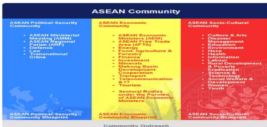
แผนภาพที่ ๒ แสดงองค์ประกอบของประชาคมอาเซียน ๒

๓) ประชาคมสังคม - วัฒนธรรมอาเซียน (ASEAN Socio - Cultural Community: ASCC) มีจุดมุ่งหมายที่จะทำให้ภูมิภาคเอเชียตะวันออกเฉียงใต้ อยู่ร่วมกันในสังคมที่เอื้ออาทร ประชากรมีสภาพความเป็นอยู่ที่ดี ได้รับการพัฒนาในทุกด้าน และมีความมั่นคงทางสังคม (Social security)