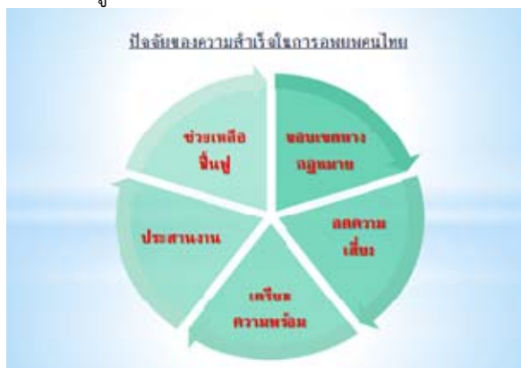
ภาพที่ ๒ ปัจจัยของความสำเร็จในการอพยพคนไทย