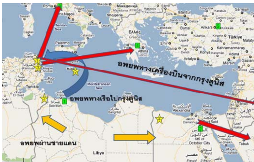
ภาพที่ ๔ การอพยพคนไทยที่ลิเบีย

กรณีอพยพลิเบียมีความยุ่งยากกว่าเนื่องจากคนไทยในลิเบียมีจำนวนมากกว่าอียิปต์และสถานการณ์มีความรุนแรงกว่าโดยทางการลิเบียประกาศปิดน่านฟ้าด้วยในช่วงแรกของวิกฤติการณ์ (และต่อมาแม้จะมีการเปิดน่านฟ้าแต่ก็มีความไม่ปลอดภัยสูง) จึงต้องใช้การอพยพผ่านประเทศที่สาม โดยใช้การอพยพทั้งทางบก ทางเรือ และทางอากาศ ตามหลักการคือให้ออกจากลิเบียซึ่งเป็นพื้นที่เสี่ยงภัยก่อนแล้วค่อยทยอยส่งกลับประเทศไทย