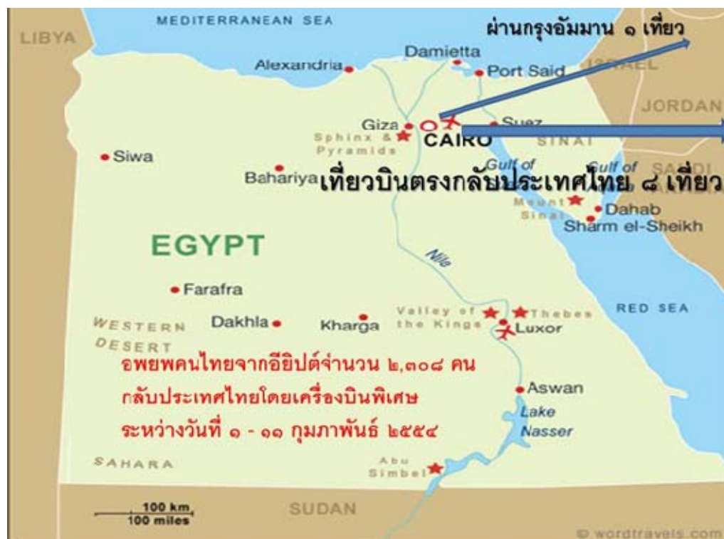
ภาพที่ ๓ การอพยพคนไทยที่อียิปต์