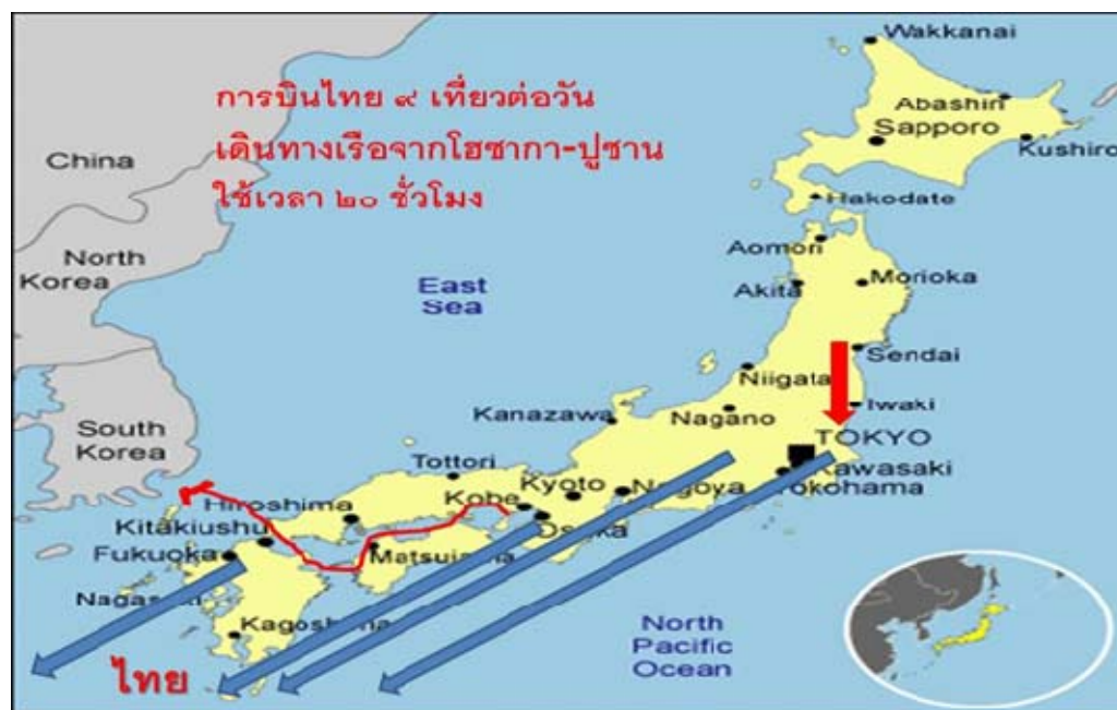
ภาพที่ ๖ การอพยพคนไทยที่ญี่ปุ่น