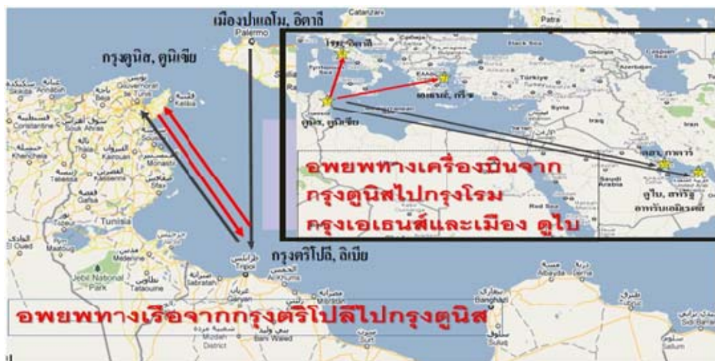
ภาพที่ ๕ การอพยพทางเรือจากกรุงตรีโปลีไปกรุงตูนิส