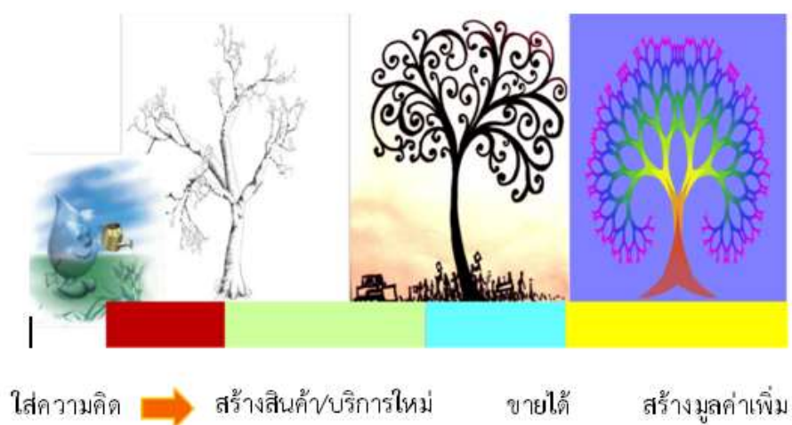
ภาพที่ ๑ แนวความคิดเศรษฐกิจสร้างสรรค์