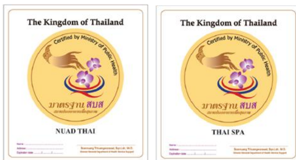
ภาพที่ 1 เครื่องหมายรับรองมาตรฐานสถานประกอบการเพื่อสุขภาพในต่างประเทศ

ต้องมีคะแนนรวม ในแต่ละหมวดไม่น้อยกว่าร้อยละ 60 และต้องผ่านทุกตัวชี้วัดตามประเภทของมาตรฐานนั้นๆ โดยสถานประกอบการเพื่อสุขภาพที่ผ่านการรับรองจะได้รับใบประกาศรับรองและเครื่องหมายรับรองมาตรฐานสถานประกอบการเพื่อสุขภาพในต่างประเทศตามภาพที่ 1 โดยใบรับรองมีอายุ 3 ปี และสถานประกอบการต้องรักษามาตรฐานตลอดอายุใบรับรองนั้น