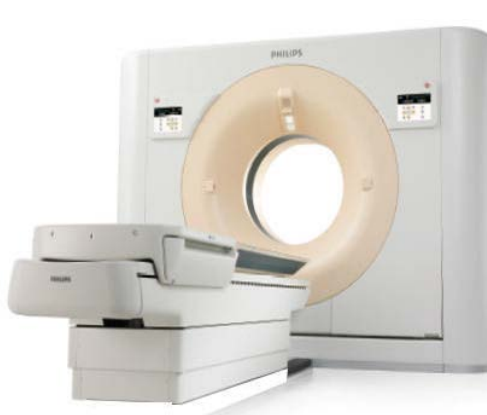
CT Scan 256 Slices