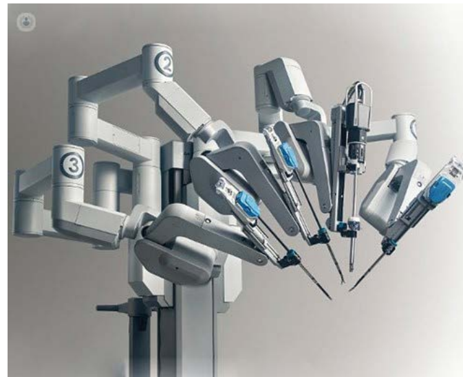
Robotic Assisted Surgery