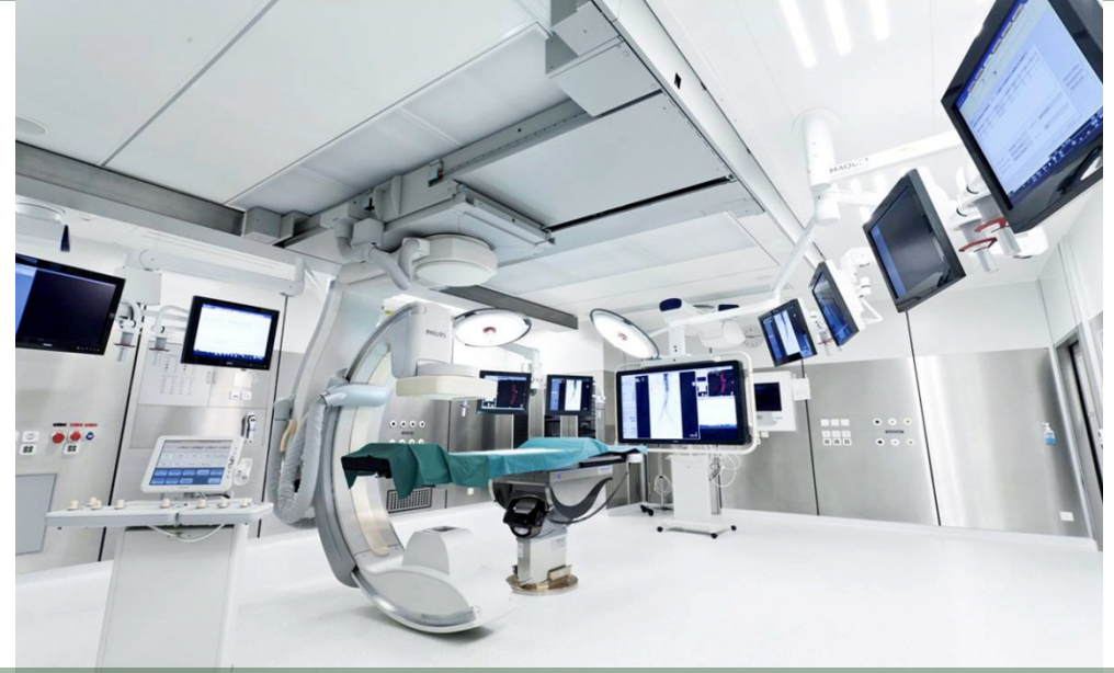
Hybrid Operating Theatre with Flex-move Technology