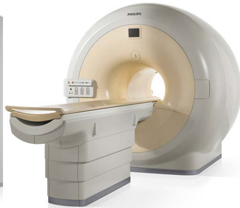
MRI 3.0 T Tesla