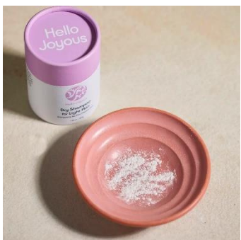
ภาพ: แชมพูสระผมแบบแห้ง