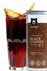
ภาพ: กาแฟไนโตรเจนพร้อมดื่ม