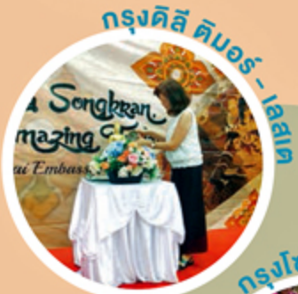
กรุงคิลี ดิมอร์ - ลาว