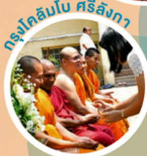
กรุงโคลัมโบ ศรีลังกา