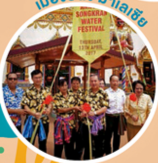
เมืองปีนัง มาเลเซีย