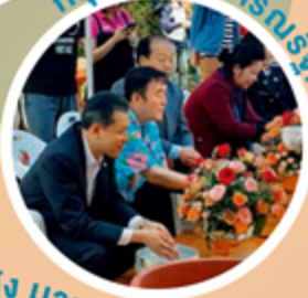
กรุงโซล สาธารณรัฐเกาหลี