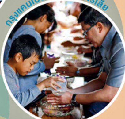
กรุงเคมเบอร์รา ออสเตรเลีย