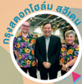
กรุงตอกโฮลัม สวีเดน