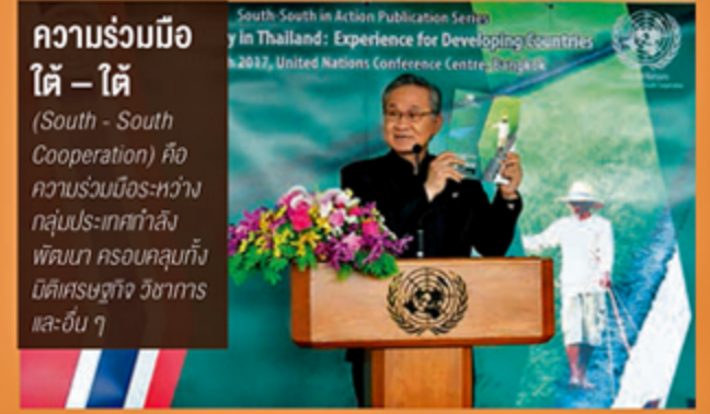
ความร่วมมือใต้ - ใต้ (South - South Cooperation) คือความร่วมมือระหว่างกลุ่มประเทศกำลังพัฒนา ครอบคลุมถึง บิโตเศรษฐกิจ วิชาการ และอื่น ๆ