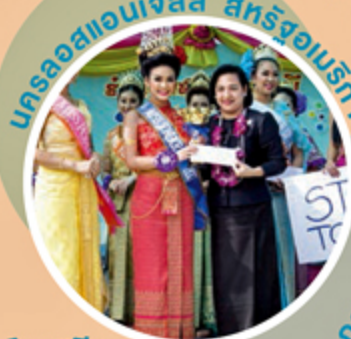
นครลอสแอนเจลิส สหรัฐอเมริกา