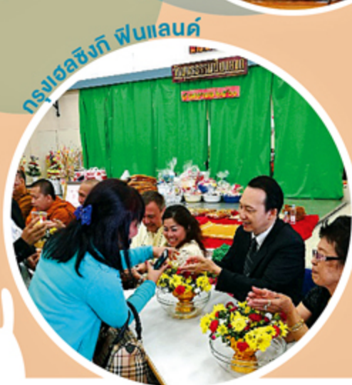
กรุงเอเธนส์ กรีซ