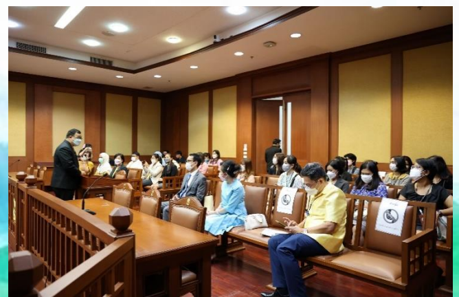
โครงการศึกษาดูงานด้านศูนย์ข้อมูลข่าวสาร หอจดหมายเหตุ ห้องสมุด และพิพิธภัณฑ์ ณ สำนักงานศาลปกครอง ถนนแจ้งวัฒนะ เมื่อวันที่ ๒๓ พฤษภาคม ๒๕๖๕