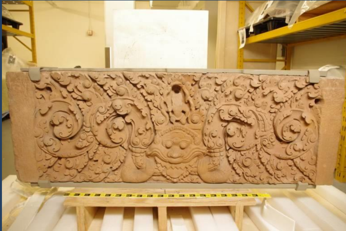
ทับหลังปราสาทเขาโล้น จ.สระแก้ว