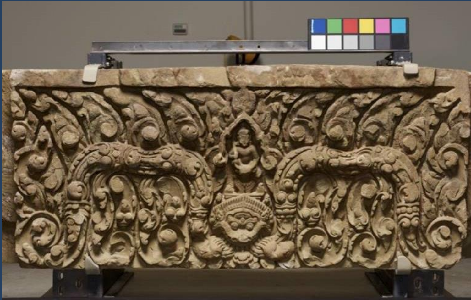
ทับหลังปราสาทหนองหงส์ จ.บุรีรัมย์