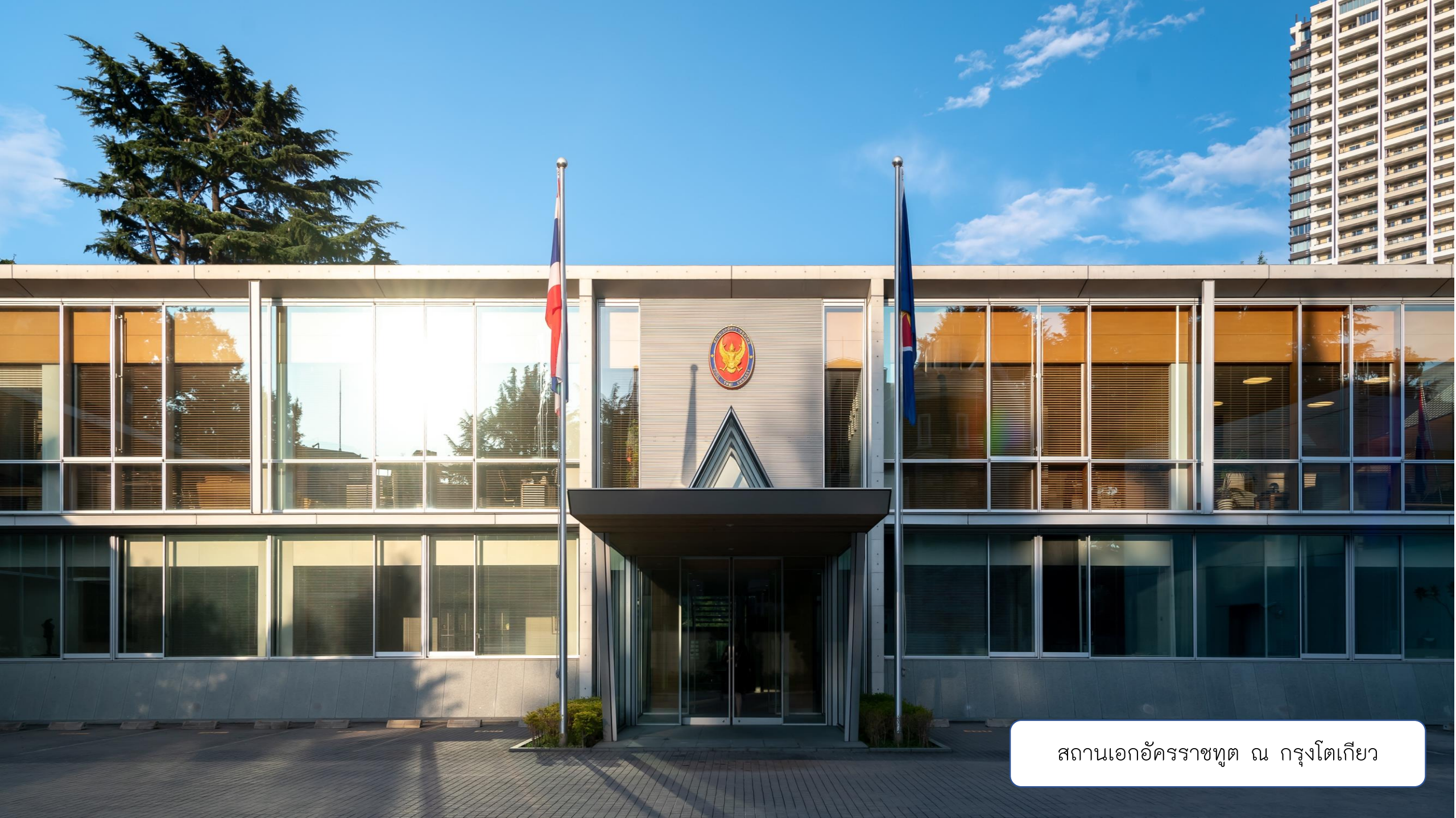
สถานเอกอัครราชทูต ณ กรุงโตเกียว