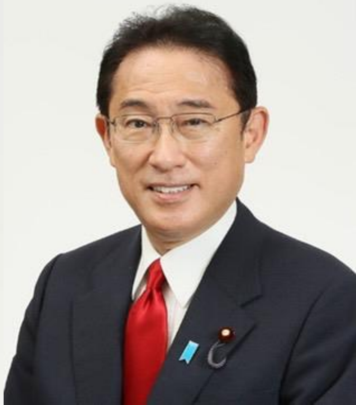
นายคิซึตะ ฟุมิโอะ นายกรัฐมนตรีญี่ปุ่น