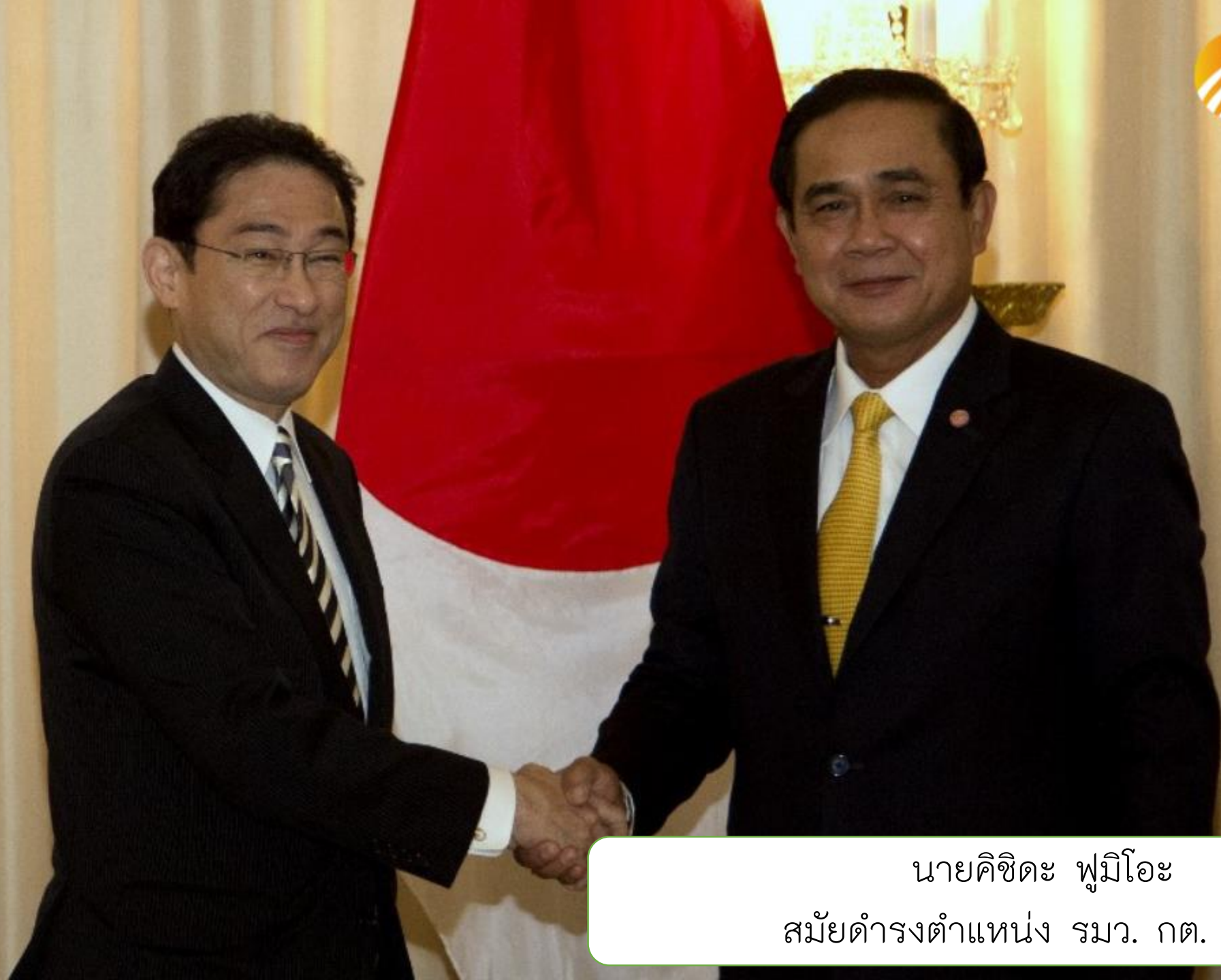
นายคิซิตะ ฟุมิโอะ สมัยดำรงตำแหน่ง รมว. กต. ญี่ปุ่น