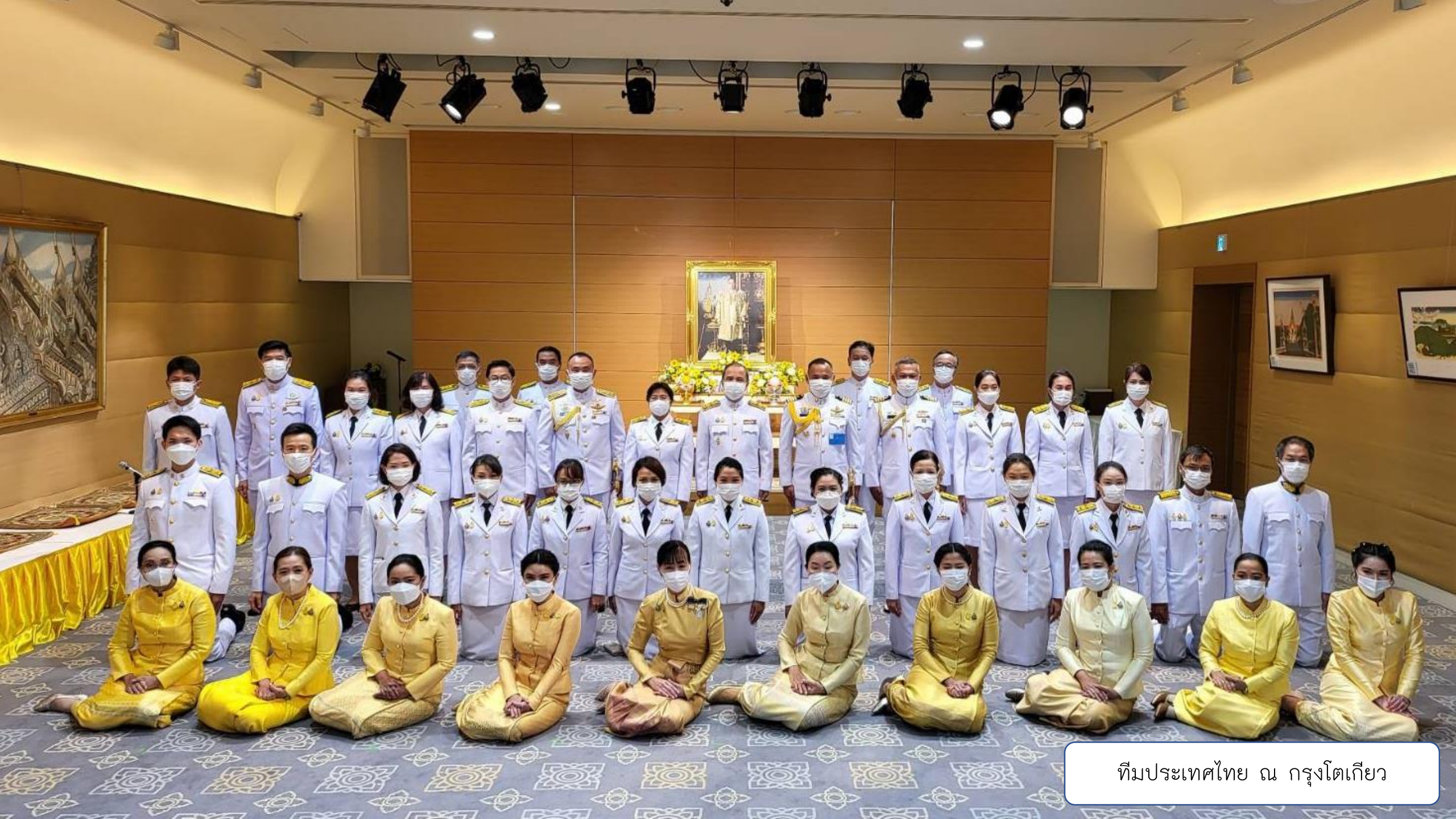
ทีมประเทศไทย ณ กรุงโตเกียว