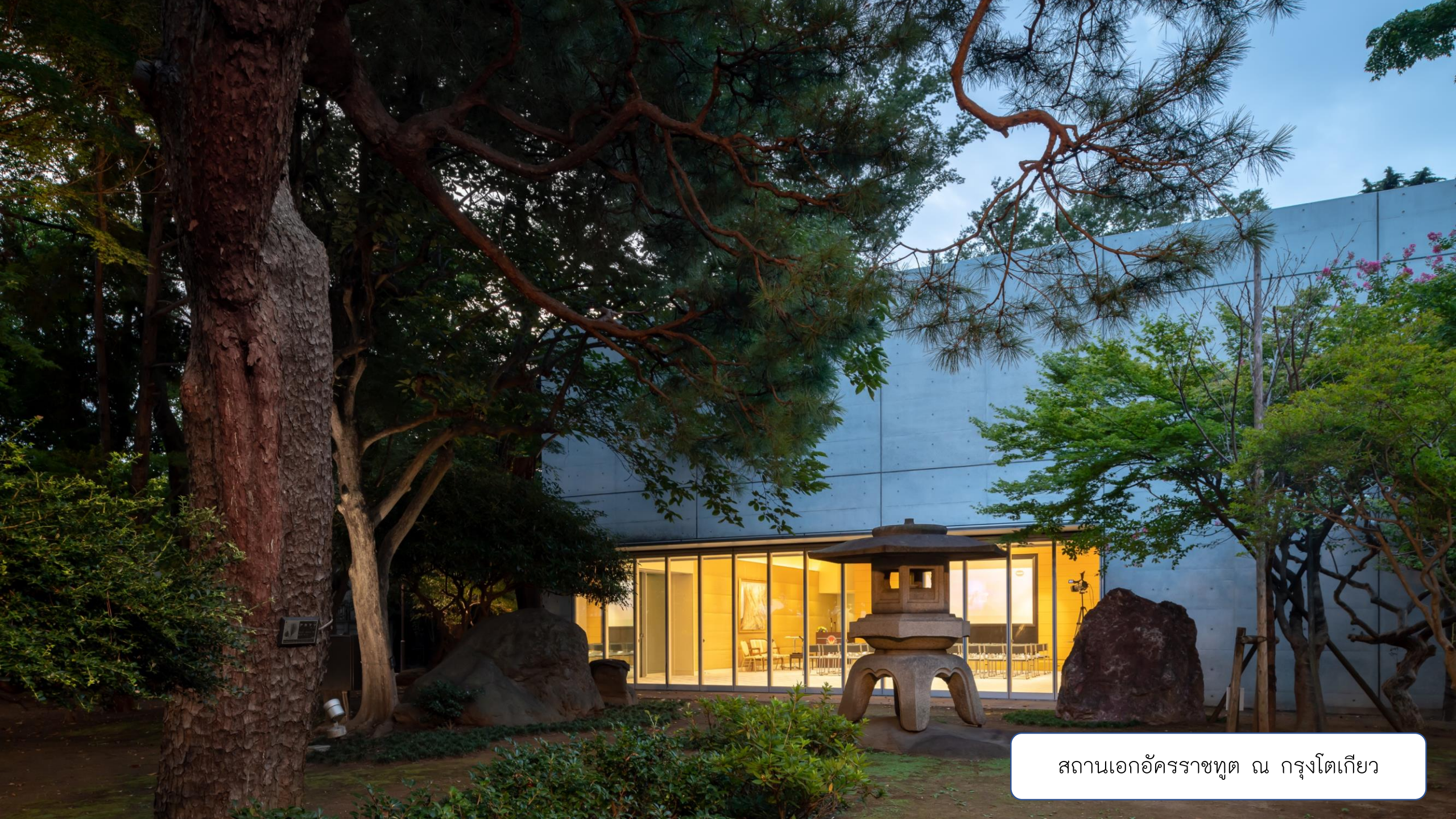
สถานเอกอัครราชทูต ณ กรุงโตเกียว