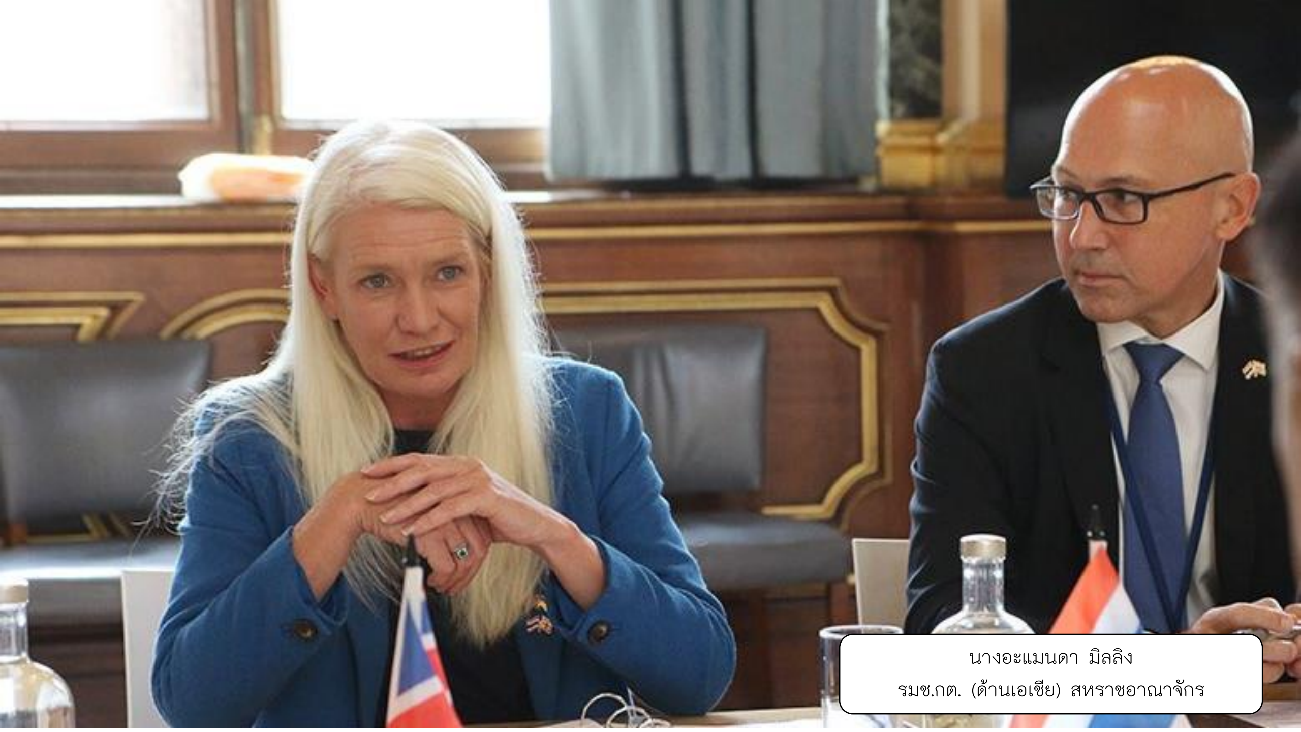
นางอะแมนดา มิลลิง รมช.กต. (ด้านเอเชีย) สหราชอาณาจักร