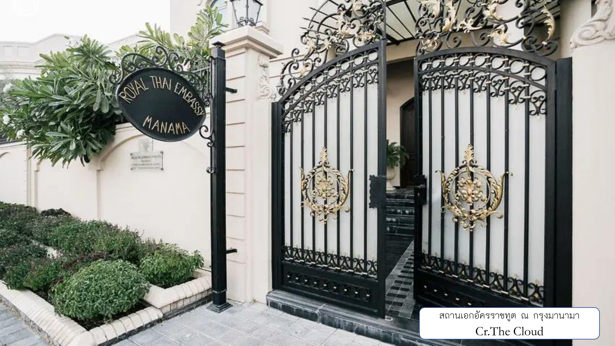
สถานเอกอัครราชทูต ณ กรุงมานามา