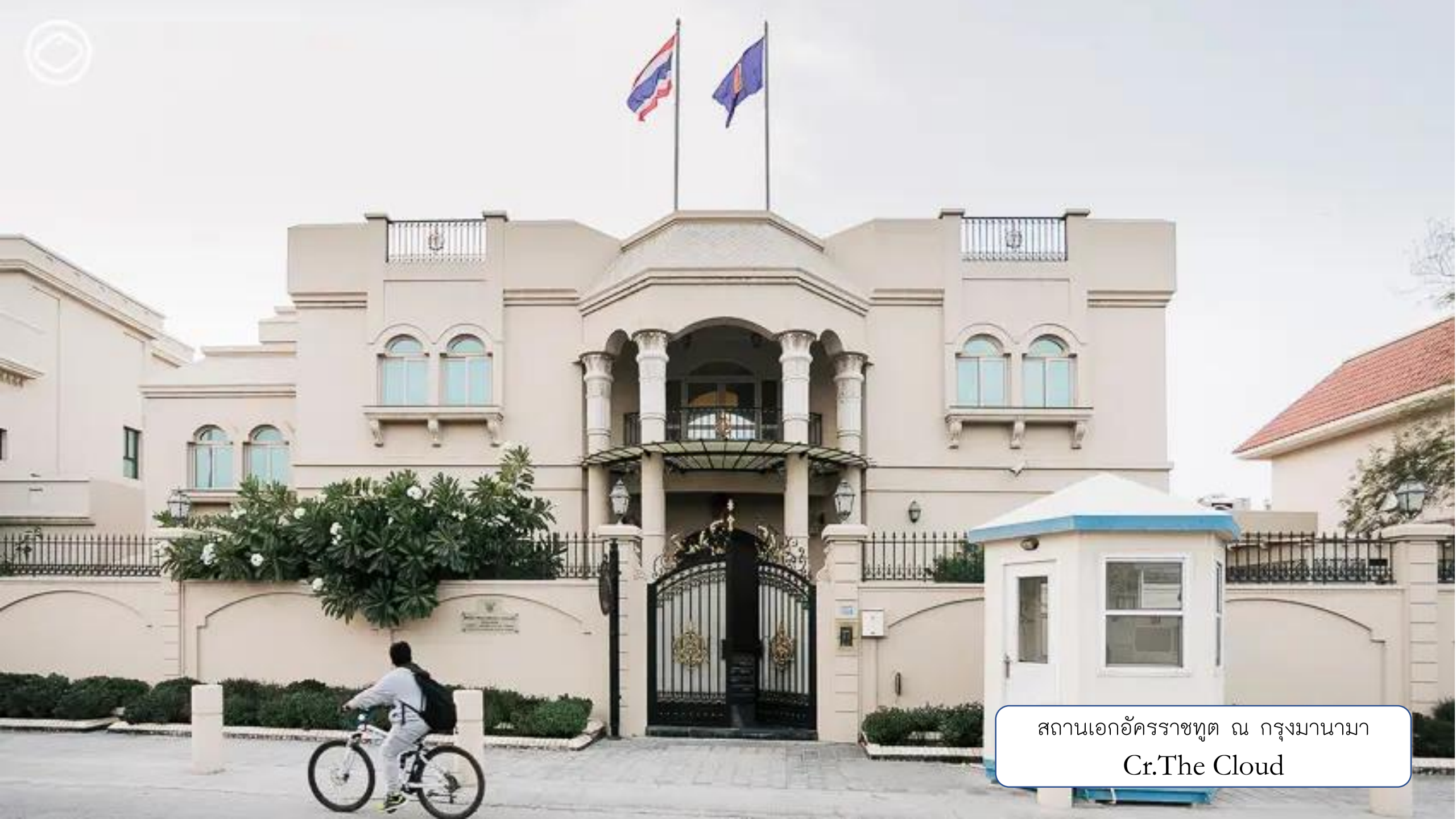
สถานเอกอัครราชทูต ณ กรุงมานามา