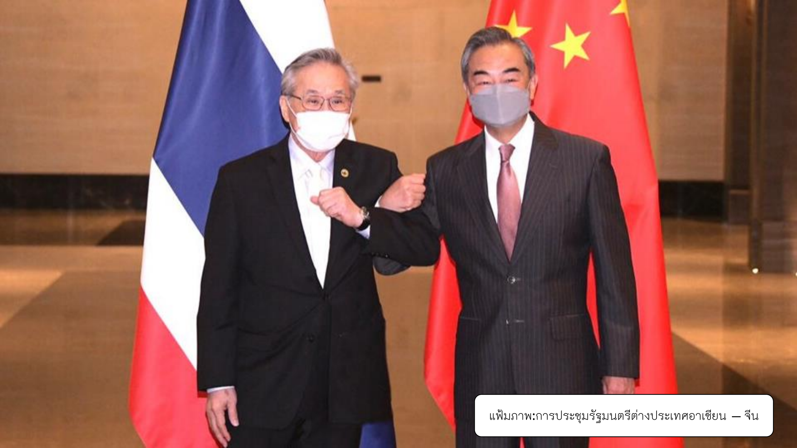
แฟ้มภาพ:การประชุมรัฐมนตรีต่างประเทศอาเซียน — จีน