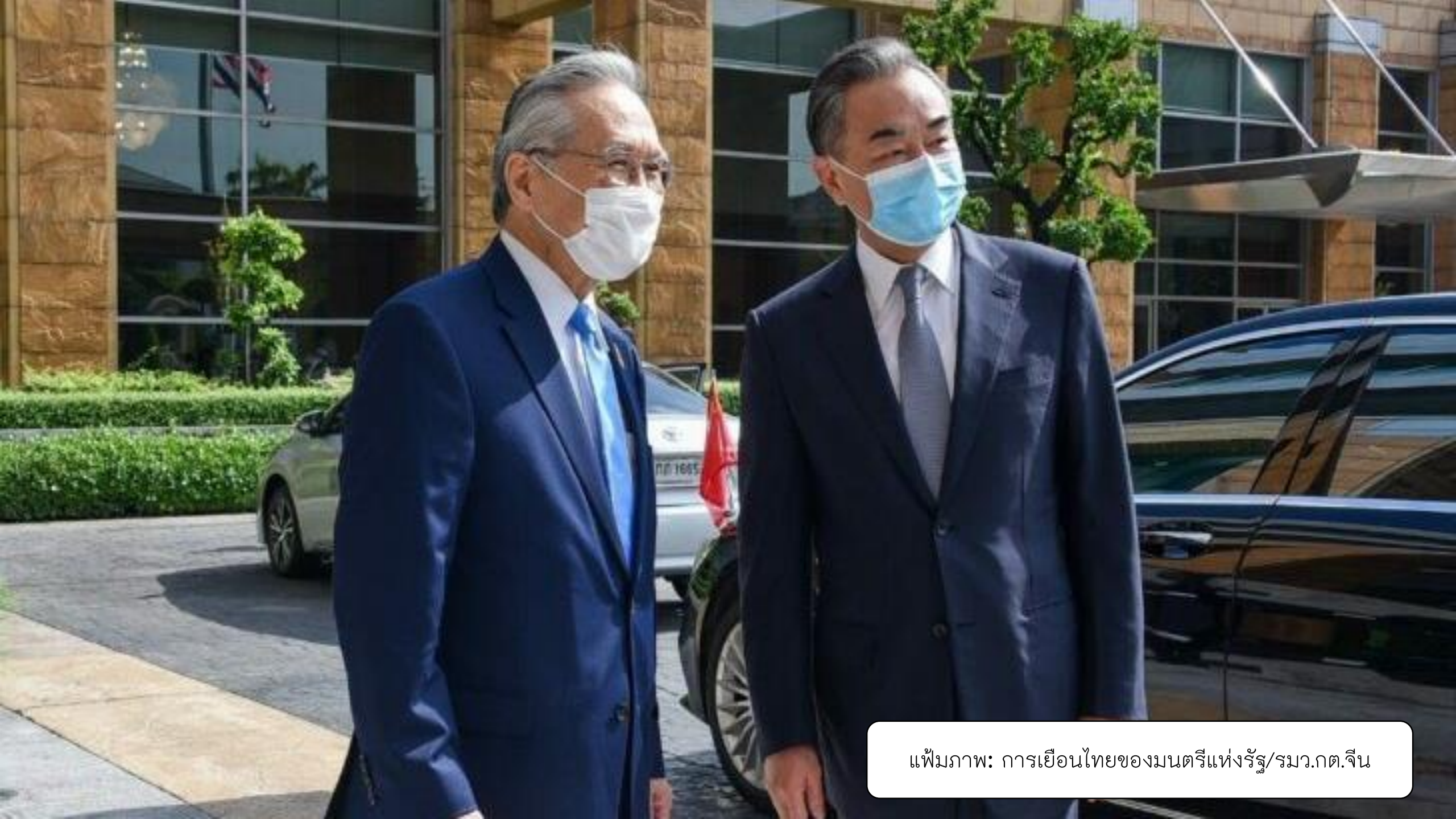
แฟ้มภาพ: การเยือนไทยของมนตรีแห่งรัฐ/รมว.กต.จีน