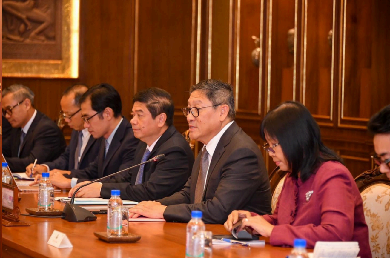
รมว.กต. เยี่ยมคารวะประธานวุฒิสภาและรองนายกฯ และ รมว.กต. กัมพูชา