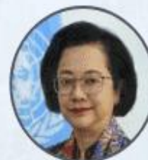
MS. ARMIDA SALSIAH ALISJAHBANA Under-Secretary- General of the United Nations and Executive Secretary of ESCAP (Co- Chair)