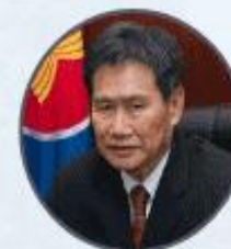
H.E. DATO LIM JOCK HOI Secretary-General of ASEAN