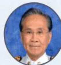
H.E. MR. DON PRAMUDWINA Deputy Prime Minister and Minister of Foreign Affairs of the Kingdom of Thailand (Co-Chair)