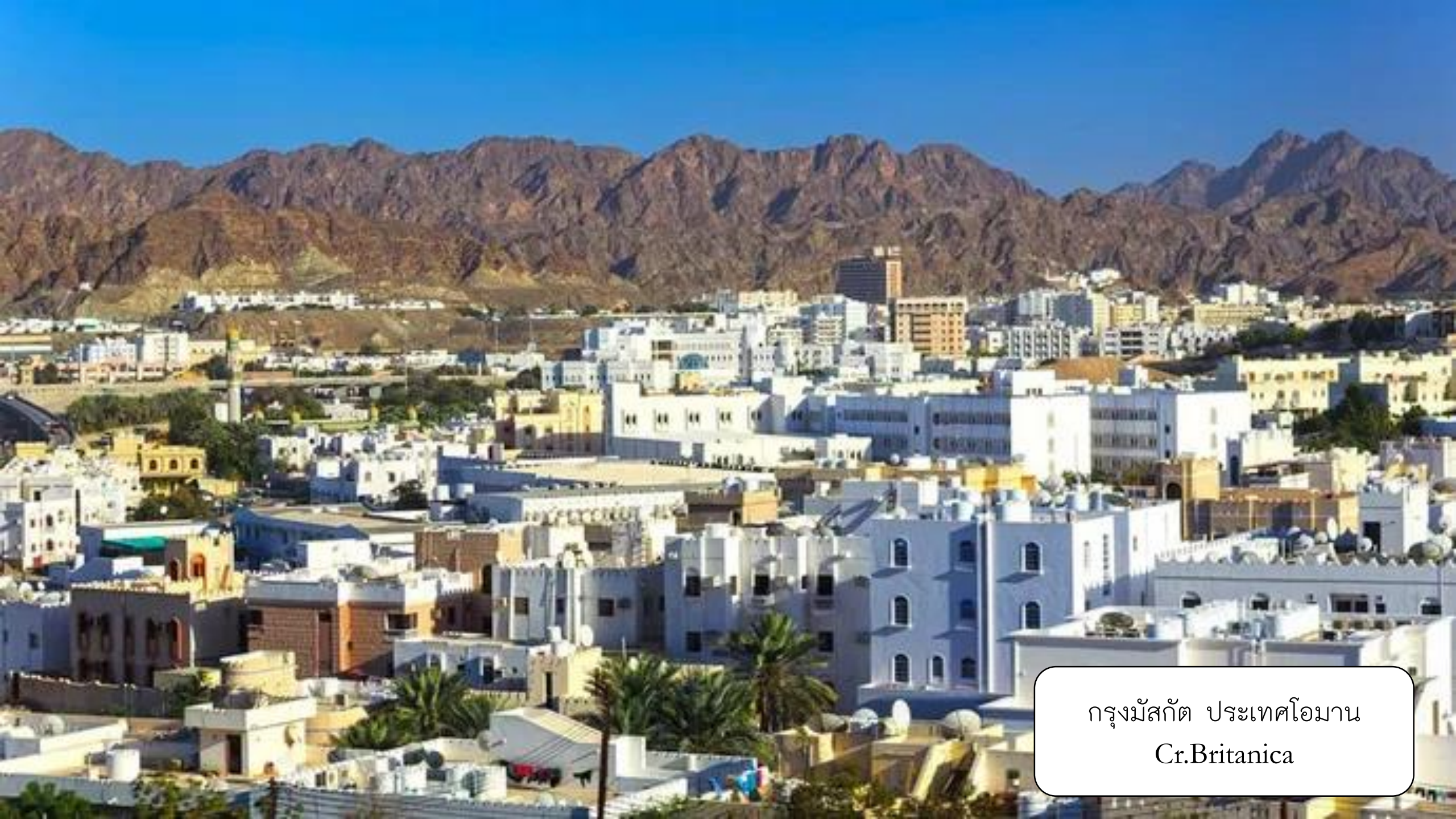
กรุงมัสกัต ประเทศโอมาน