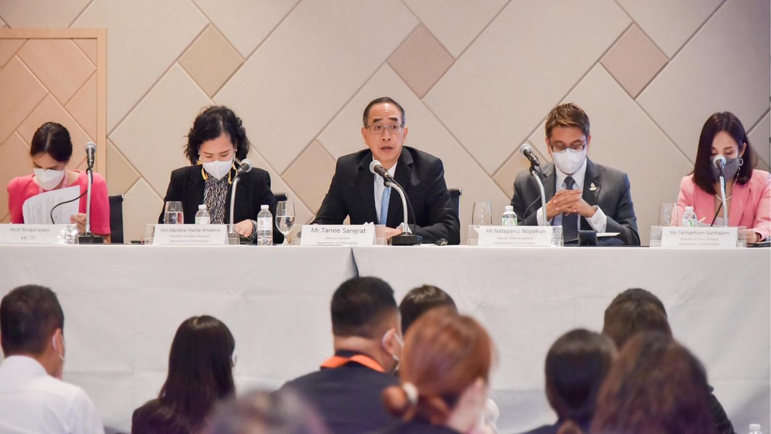
Host Broadcaster MCOT