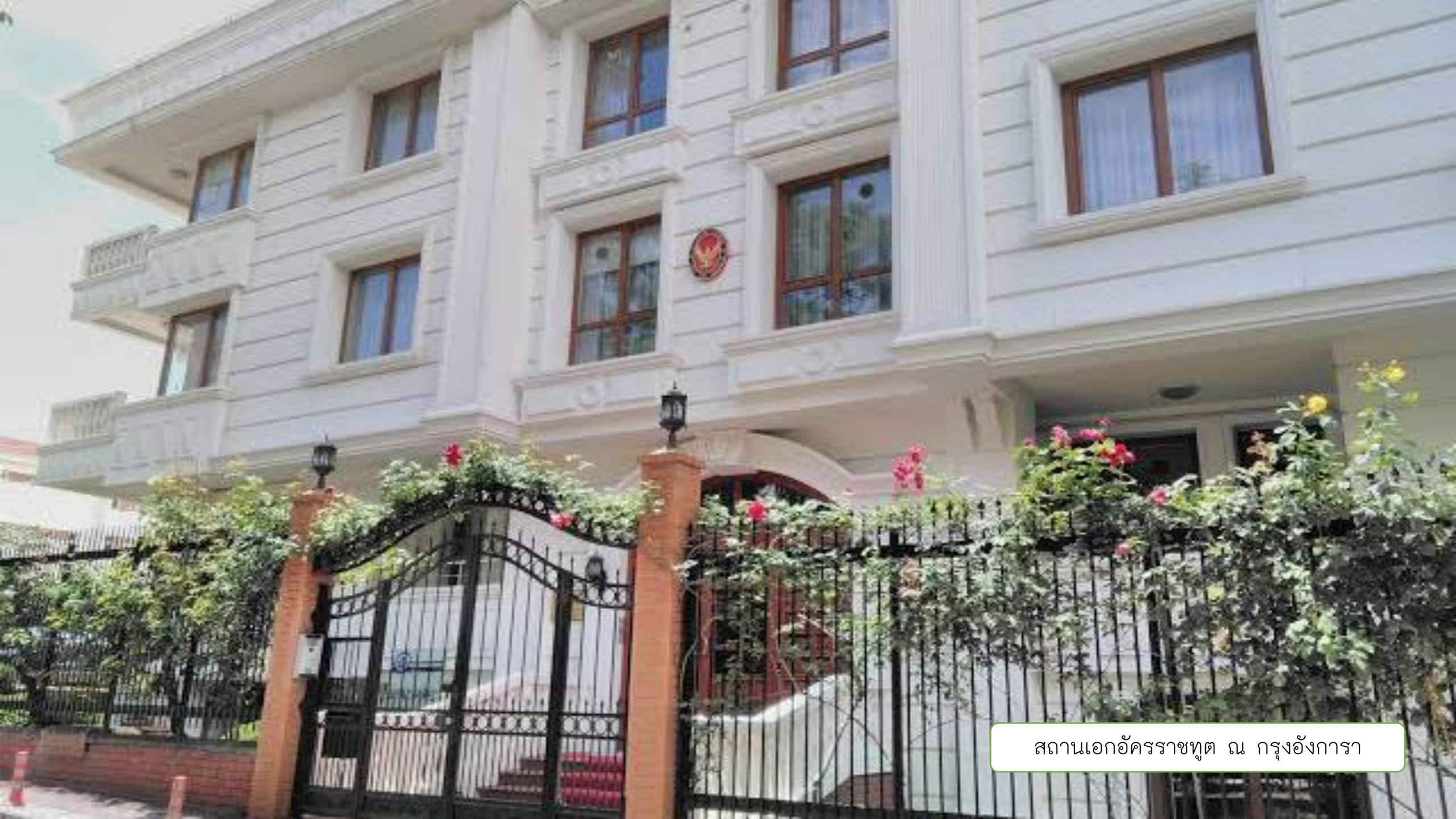
สถานเอกอัครราชทูต ณ กรุงอังการา