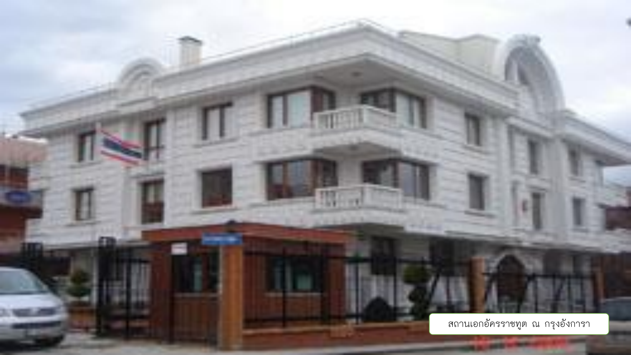
สถานเอกอัครราชทูต ณ กรุงอังการา