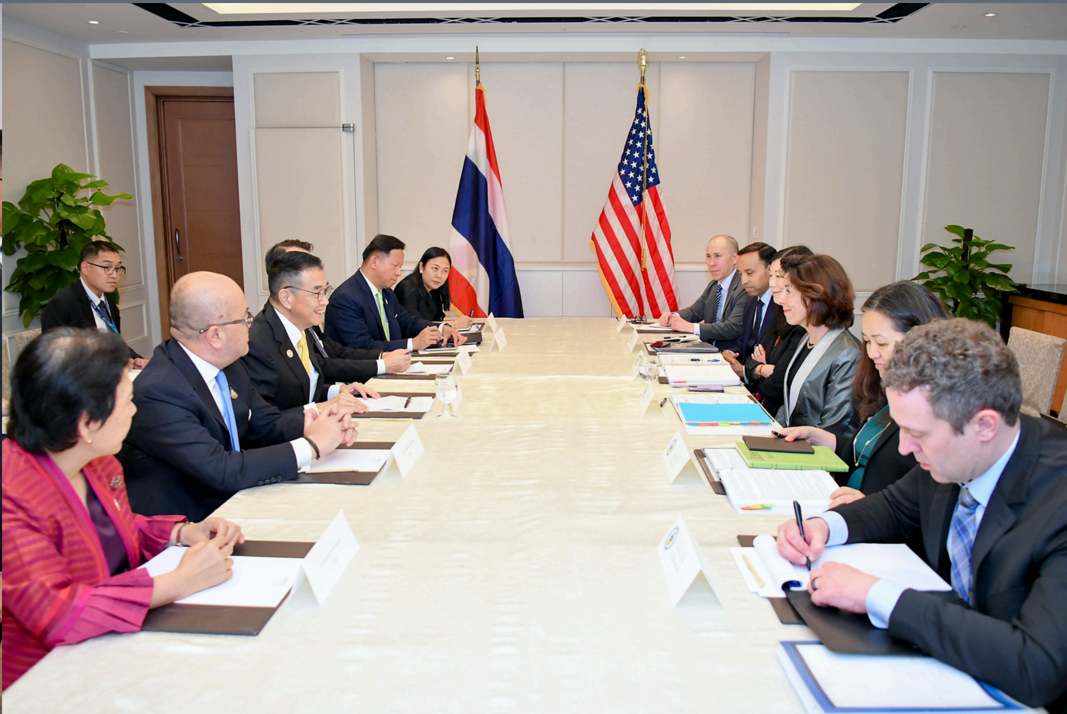
รัฐมนตรีว่าการกระทรวงต่างประเทศหารือกับรัฐมนตรีพาณิชย์สหรัฐฯ