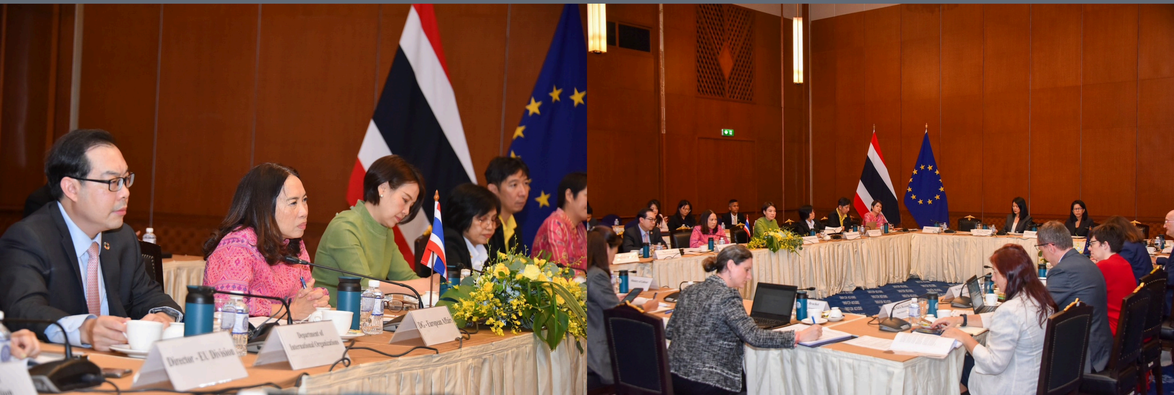
อธิบดีกรมยุโรปและรองอธิบดีกรมเอเชียและแปซิฟิก กระทรวงการต่างประเทศสหภาพยุโรป (อียู) ร่วมหารือในการประชุมระดับเจ้าหน้าที่อาวุโส (SOM) ระหว่างไทย-สหภาพยุโรป ครั้งที่ 17