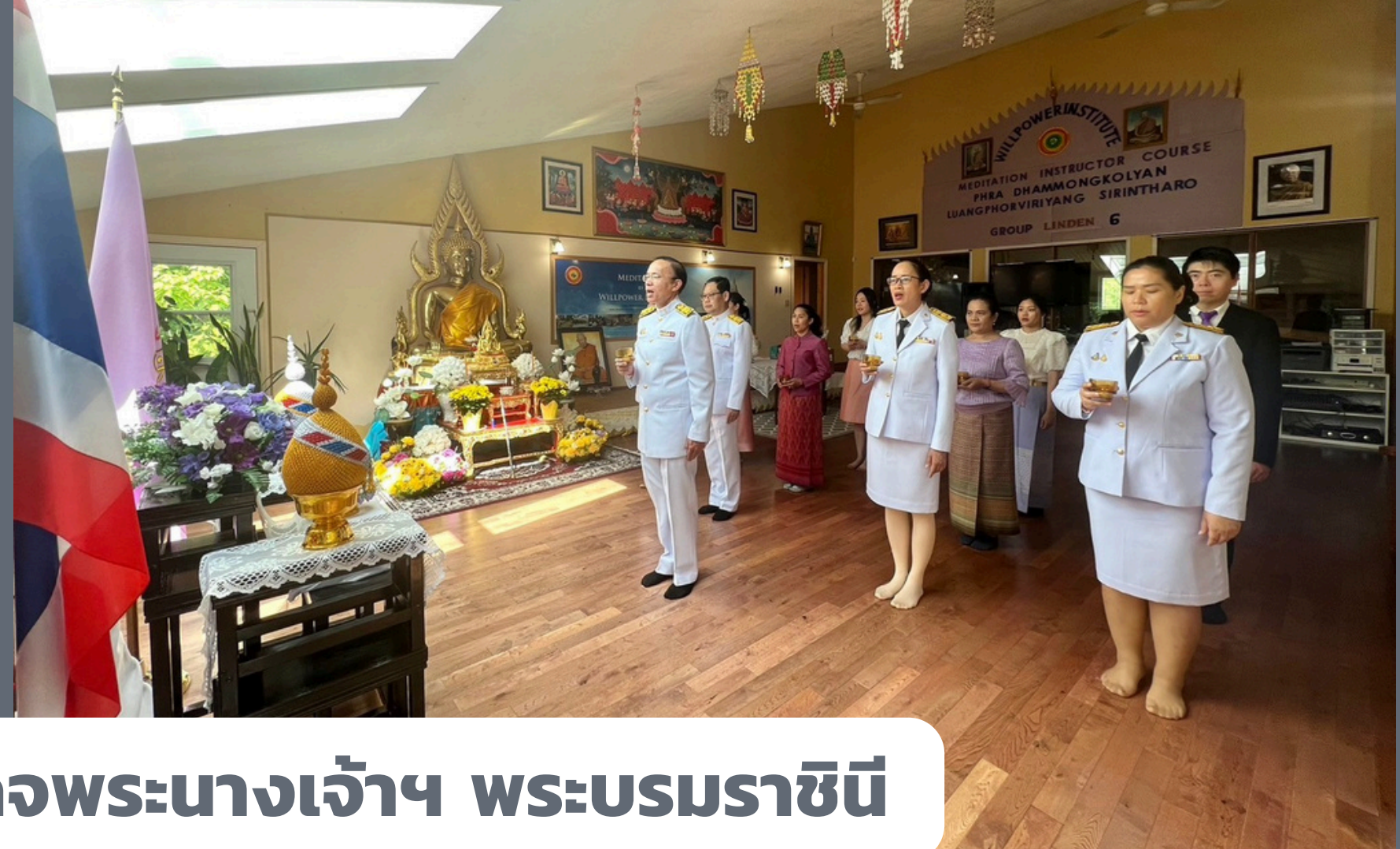
จัดกิจกรรมเฉลิมพระเกียรติสมเด็จพระนางเจ้าฯ พระบรมราชินี เนื่องในวันเฉลิมพระชนมพรรษา 3 มิถุนายน 2567