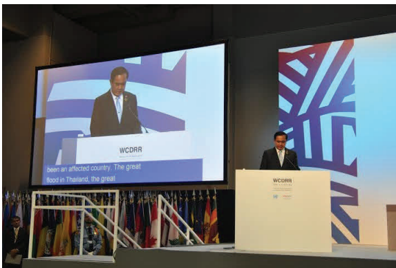
นายกรัฐมนตรีเข้าร่วมการประชุม UN World Conference on Disaster Risk Reduction ครั้งที่ ๓ ณ เมืองเซนได ญี่ปุ่น ระหว่างวันที่ ๑๓ - ๑๕ มีนาคม