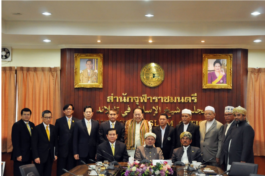
รองนายกรัฐมนตรีและรัฐมนตรีว่าการกระทรวงการต่างประเทศมอบเงินสนับสนุน การปฏิบัติหน้าที่ของจุฬาราชมนตรีในฐานะหัวหน้าคณะผู้แทนฮัจญ์ทางการของไทย เมื่อวันที่ ๒๔ ธันวาคม ๒๕๕๗