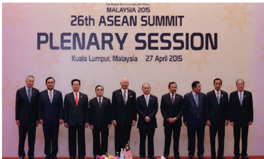
นายกรัฐมนตรีเข้าร่วมการประชุมสุดยอดอาเซียน ครั้งที่ ๒๖ ณ กรุงกัวลาลัมเปอร์ มาเลเซีย ระหว่างวันที่ ๒๖ - ๒๗ เมษายน ๒๕๕๘