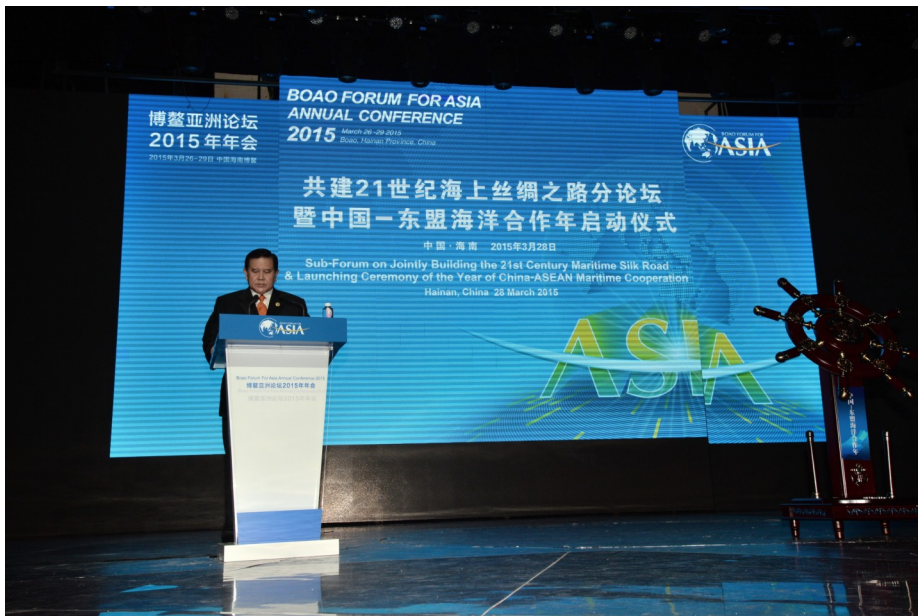
รองนายกรัฐมนตรีและรัฐมนตรีว่าการกระทรวงการต่างประเทศ เข้าร่วมการประชุม Boao Forum for Asia ณ เมืองโบ้อ่าว สาธารณรัฐประชาชนจีน เมื่อวันที่ ๒๘ มีนาคม ๒๕๕๘