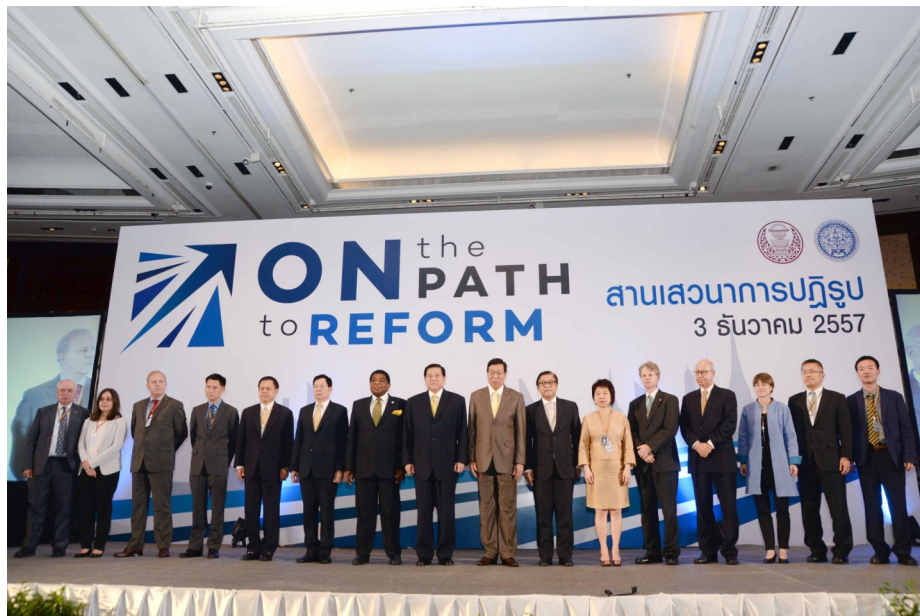
รองนายกรัฐมนตรีและรัฐมนตรีว่าการกระทรวงการต่างประเทศเป็นประธาน งานสานเสวนาปฏิรูป “On the Path to Reform” เมื่อวันที่ ๓ ธันวาคม ๒๕๕๗