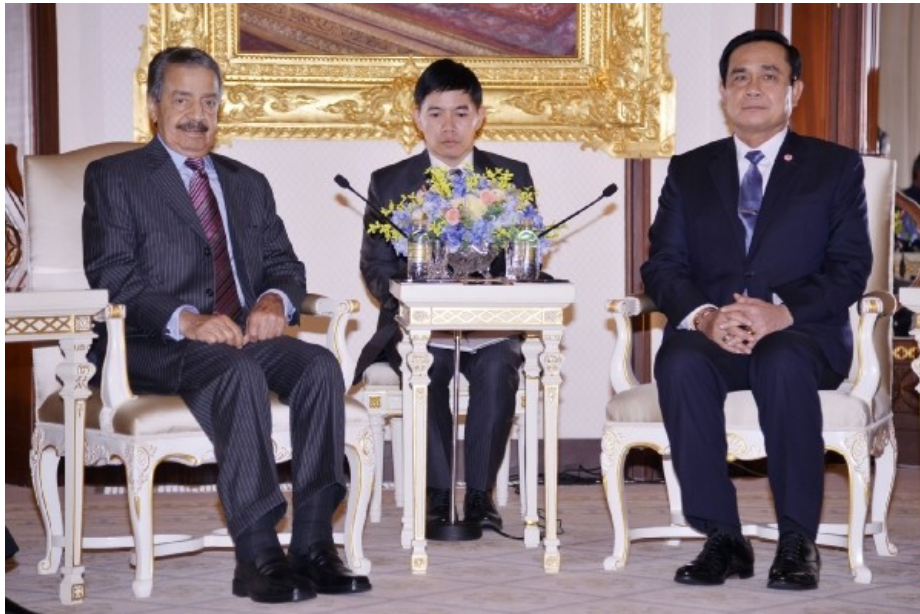
นายกรัฐมนตรีบาห์เรนเข้าพบหารือข้อราชการกับนายกรัฐมนตรี เมื่อวันที่ ๒๐ ตุลาคม ๒๕๕๗