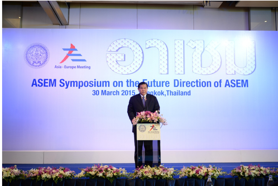
รองนายกรัฐมนตรีและรัฐมนตรีว่าการกระทรวงการต่างประเทศ เป็นประธานในพิธีเปิดการประชุมเจ้าหน้าที่อาวุโส เอเชีย—ยุโรป เมื่อวันที่ ๓๐ มีนาคม ๒๕๕๘