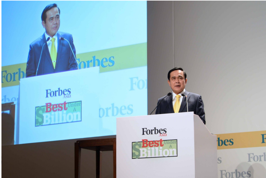
นายกรัฐมนตรีกล่าวสุนทรพจน์เปิดงาน Forbes Asia's Best under a Billion Award Ceremony and Dinner 2014 เมื่อวันที่ ๙ ธันวาคม ๒๕๕๘