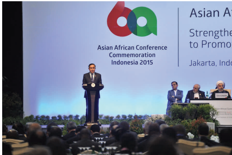
นายกรัฐมนตรีเข้าร่วมการประชุม Asian—Africa Conference Summit ณ เมืองบันดุง อินโดนีเซีย ระหว่างวันที่ ๒๒ - ๒๓ เมษายน ๒๕๕๘