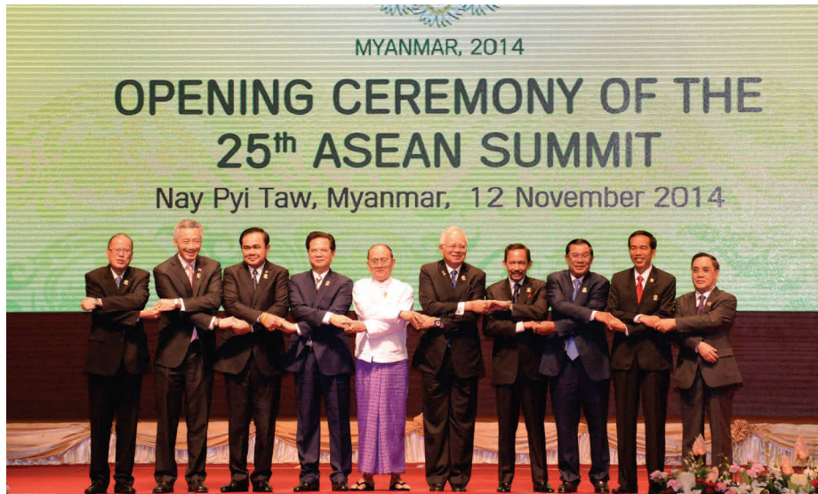
นายกรัฐมนตรีเข้าร่วมการประชุมสุดยอดอาเซียน ครั้งที่ ๒๕ ณ กรุงเนปีดอว์ เมียนมาร์ ระหว่างวันที่ ๑๒ - ๑๓ พฤศจิกายน ๒๕๕๗