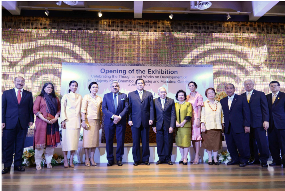
กระทรวงการต่างประเทศเป็นเจ้าภาพจัดนิทรรศการ พ้อ - Bapu: Love for the Nation เมื่อวันที่ ๒ ธันวาคม ๒๕๕๗