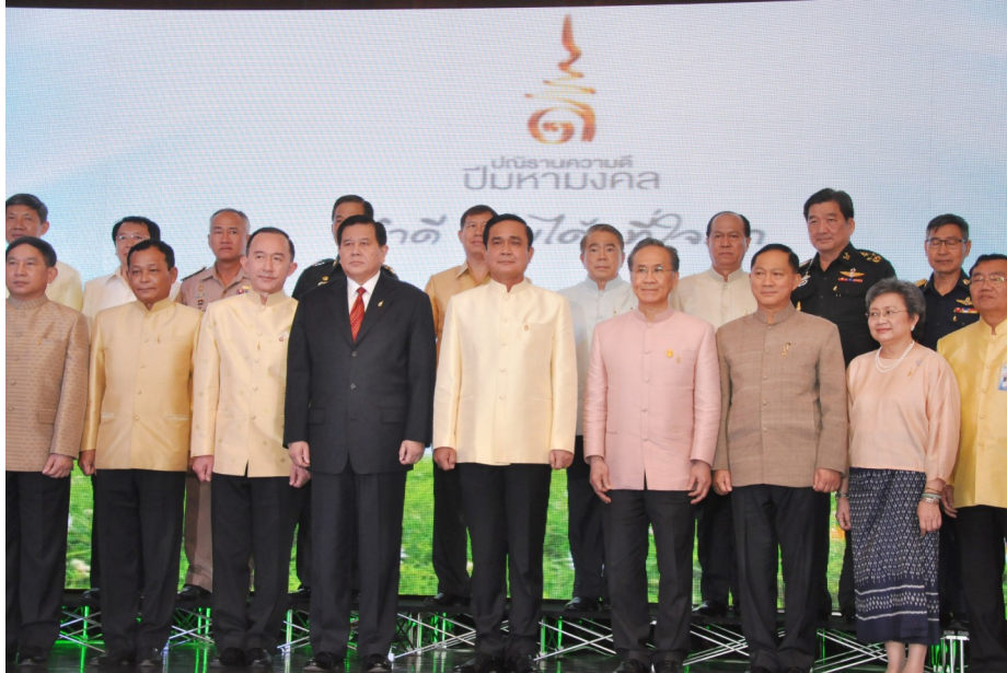
นายกรัฐมนตรี เป็นประธานในพิธีเปิด “โครงการปณิธานความดี ปีมหามงคล” เมื่อวันที่ ๒๖ กุมภาพันธ์ ๒๕๕๘