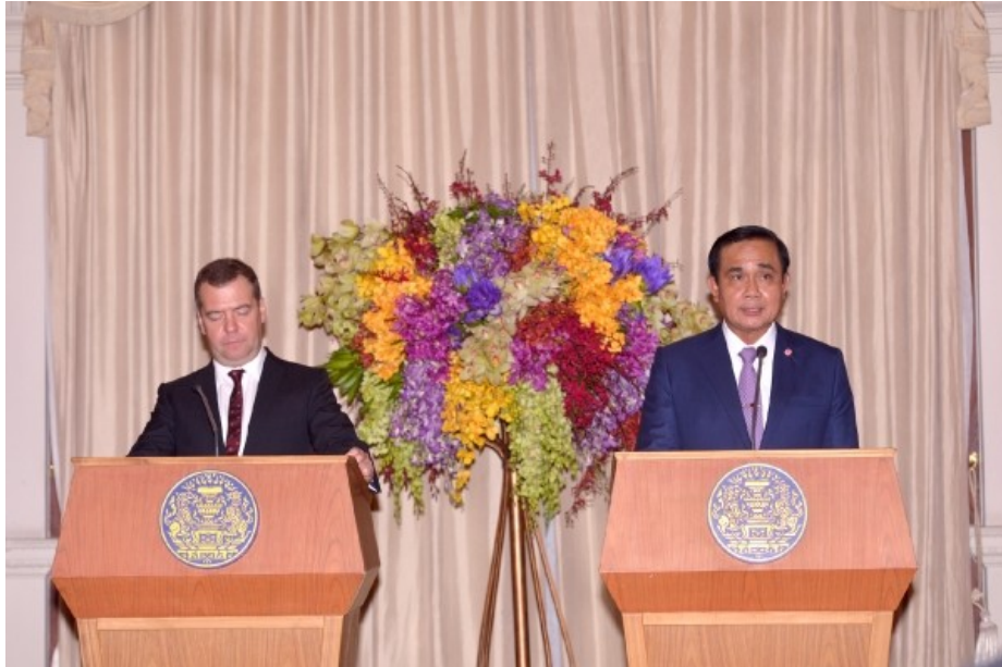
นายกรัฐมนตรีรัสเซียเยือนไทยอย่างเป็นทางการ ระหว่างวันที่ ๗ - ๘ เมษายน ๒๕๕๘