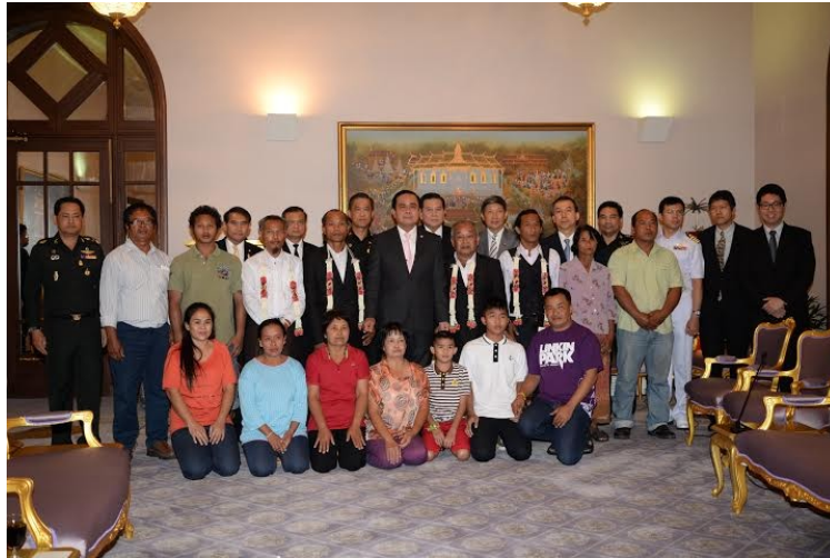
ลูกเรือไทยที่ได้รับการช่วยเหลือจากโซมาเลียเข้าเยี่ยมคารวะนายกรัฐมนตรี เมื่อวันที่ ๒๘ กุมภาพันธ์ ๒๕๕๘