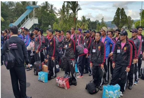
การช่วยเหลือลูกเรือจากอินโดนีเซีย เมื่อวันที่ ๙ เมษายน ๒๕๕๘