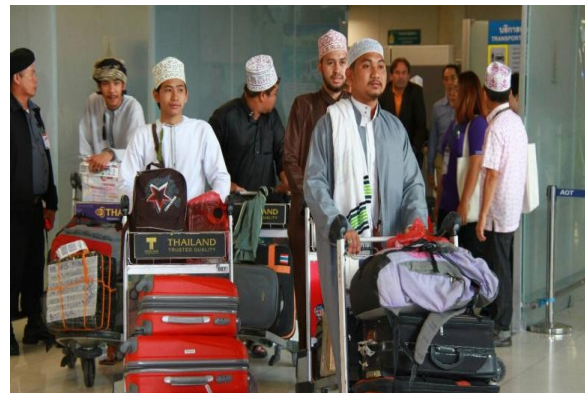
การอพยพนักศึกษาไทยกลับจากเยเมน มีนาคม—เมษายน ๒๕๕๘