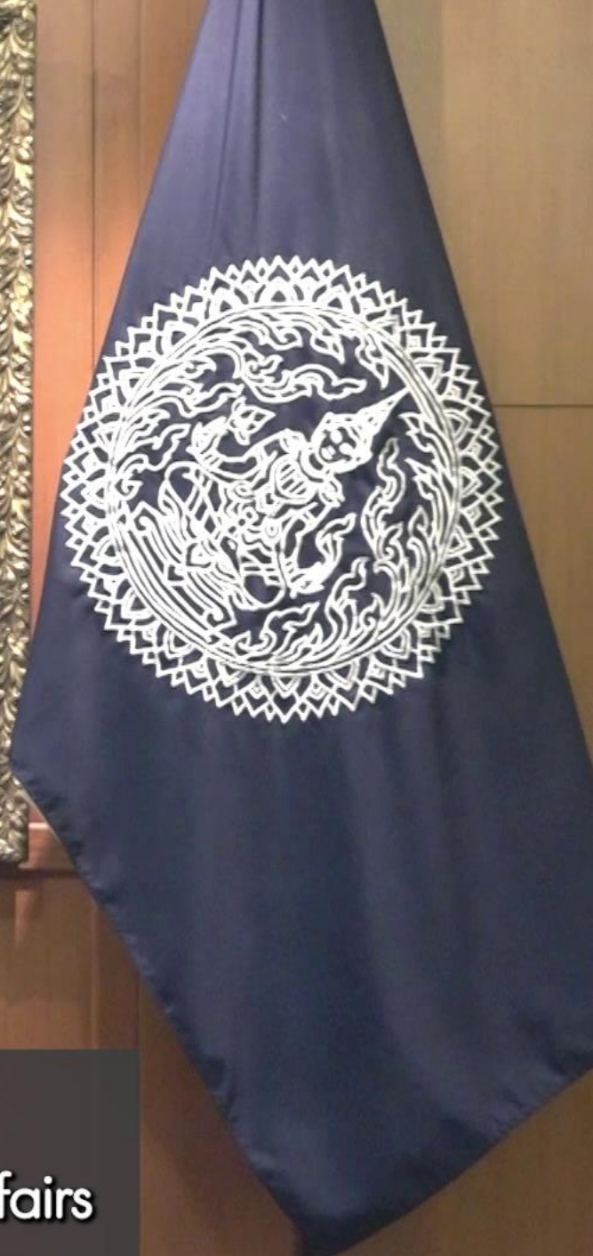
H.E. Mr. Don Pramudwinai Deputy Prime Minister and Minister of Foreign Affairs