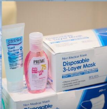
หน้ากากอนามัยและแอลกอฮอล์