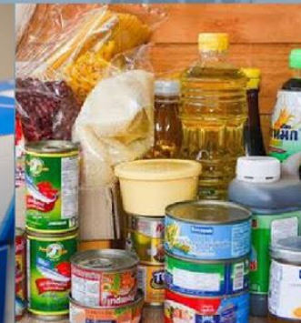
สิ่งของช่วยเหลือต่างๆ

เพื่อช่วยเหลือชุมชนชอยสวนเงิน ซึ่งได้รับผลกระทบจากโควิด-19 ในวันพฤหัสบดีที่ 29 กรกฎาคม 2564 เวลา 16.30 น.