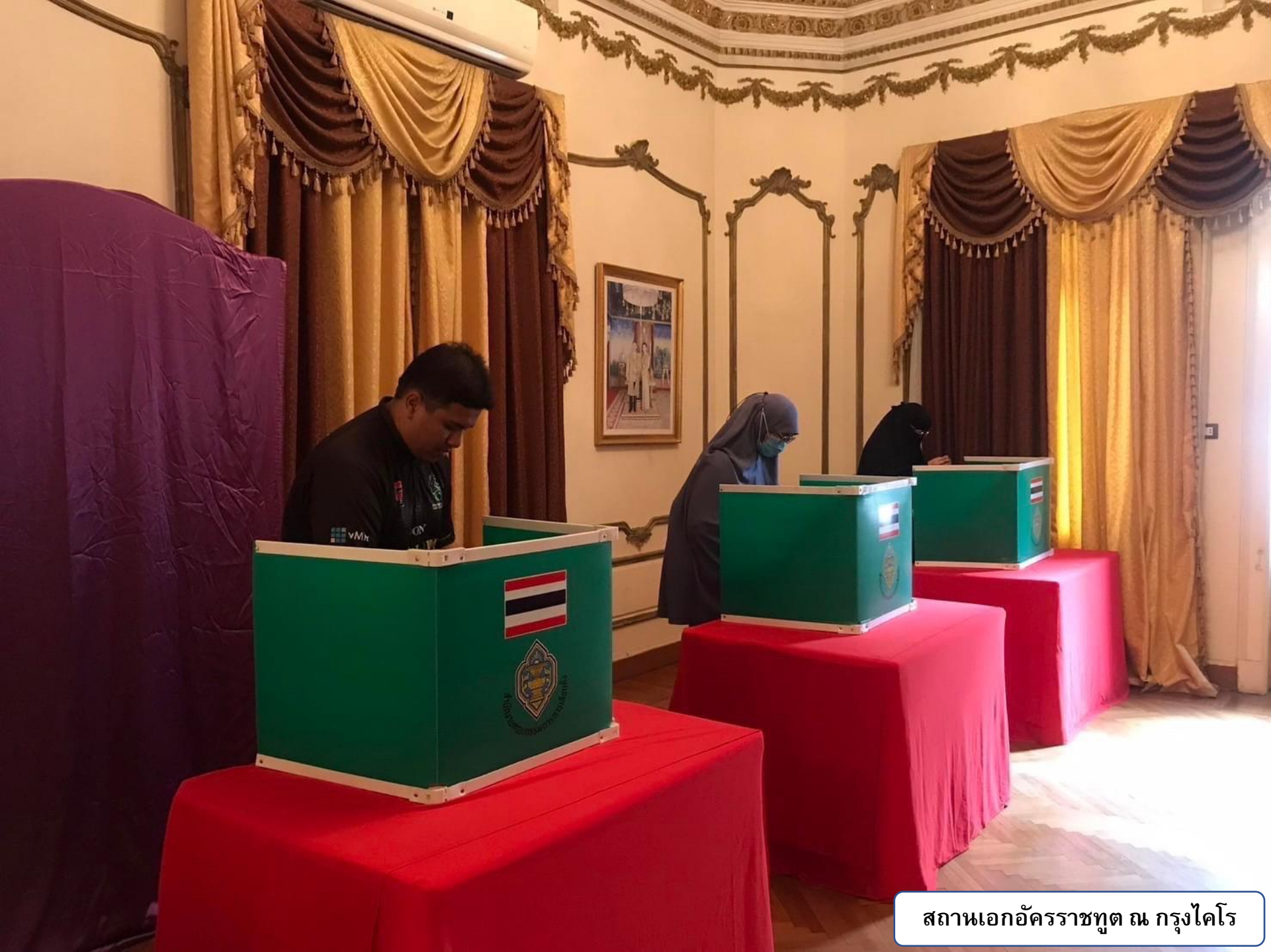
สถานเอกอัครราชทูต ณ กรุงไคโร