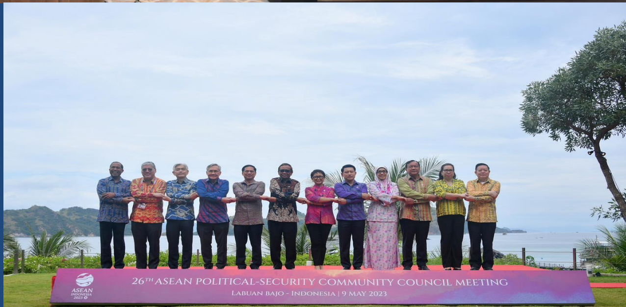
การประชุมคณะมนตรีประชาคมการเมืองและความมั่นคงอาเซียน ครั้งที่ ๒๖