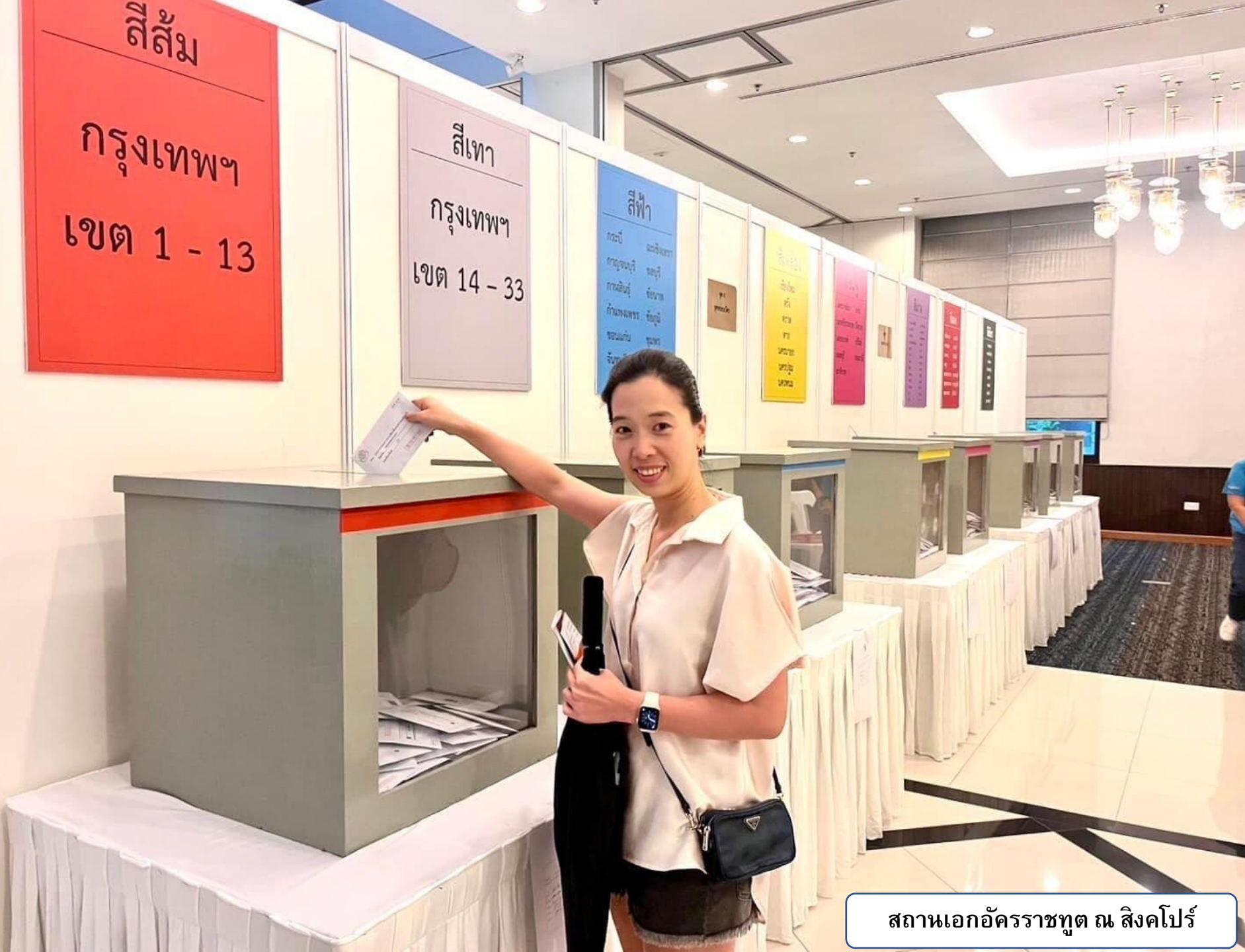
สถานเอกอัครราชทูต ณ สิงคโปร์