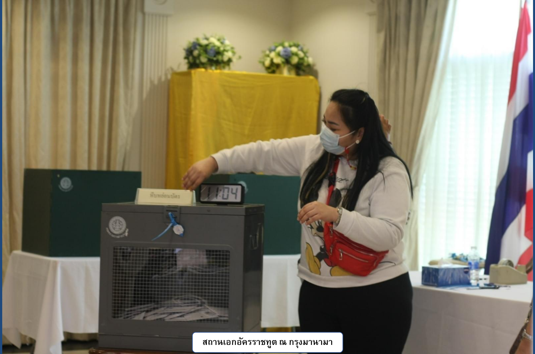
สถานเอกอัครราชทูต ณ กรุงเทพมหานคร