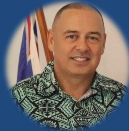
Honourable Mark Brown Prime Minister of the Cook Islands