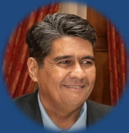
H.E. Mr. Surangel S. Whipps, Jr. President of Palau