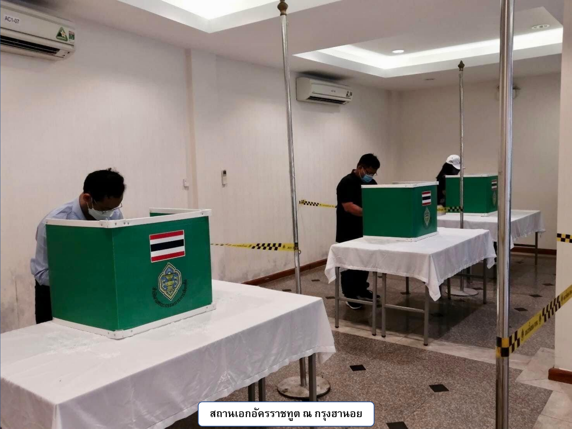
สถานเอกอัครราชทูต ณ กรุงเทพมหานคร