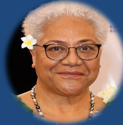
H.E. Ms. Fiamē Naomi Mata'afa Prime Minister of Samoa