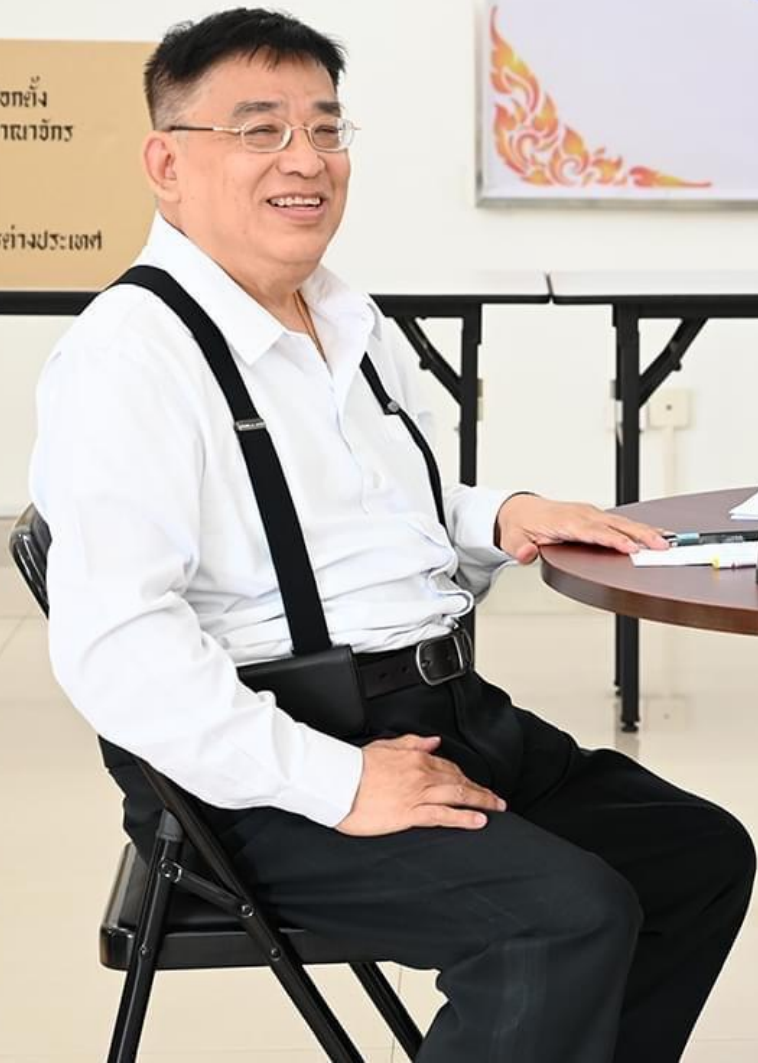
สถานกงสุลใหญ่ ณ นครพนม