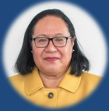
Honorable Fekitamoeloa Katoa 'Utoikamanu Minister for Foreign Affairs and Minister for Tourism, Tonga