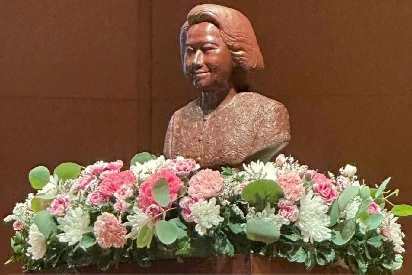
เฉลิมฉลองวาระครบรอบ ๑๐๐ ปี วันประสูติ สมเด็จพระเจ้าพี่นางเธอ เจ้าฟ้ากัลยาณิวัฒนา กรมหลวงนราธิวาสราชนครินทร์ ๖ พฤษภาคม ๒๕๖๖