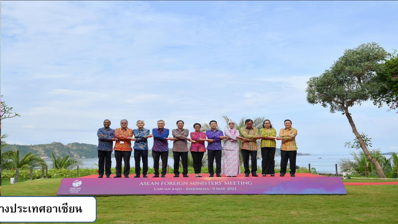
การประชุมรัฐมนตรีต่างประเทศอาเซียน