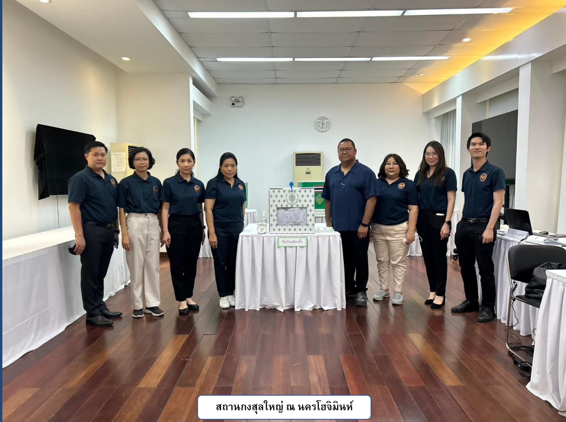
สถานกงสุลใหญ่ ณ นครโฮจิมินห์