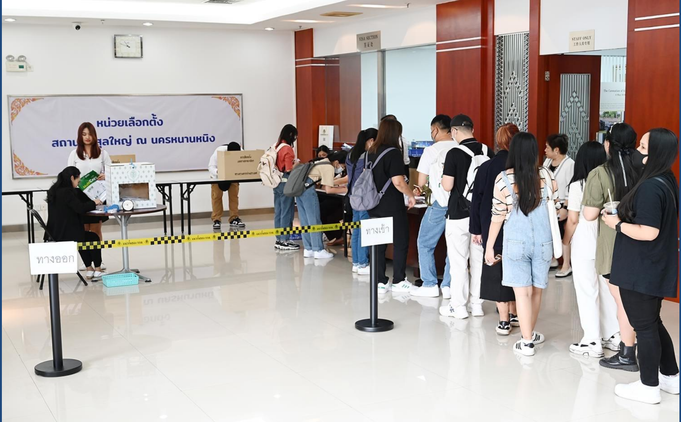
สถานกงสุลใหญ่ ณ นครหนานหนิง