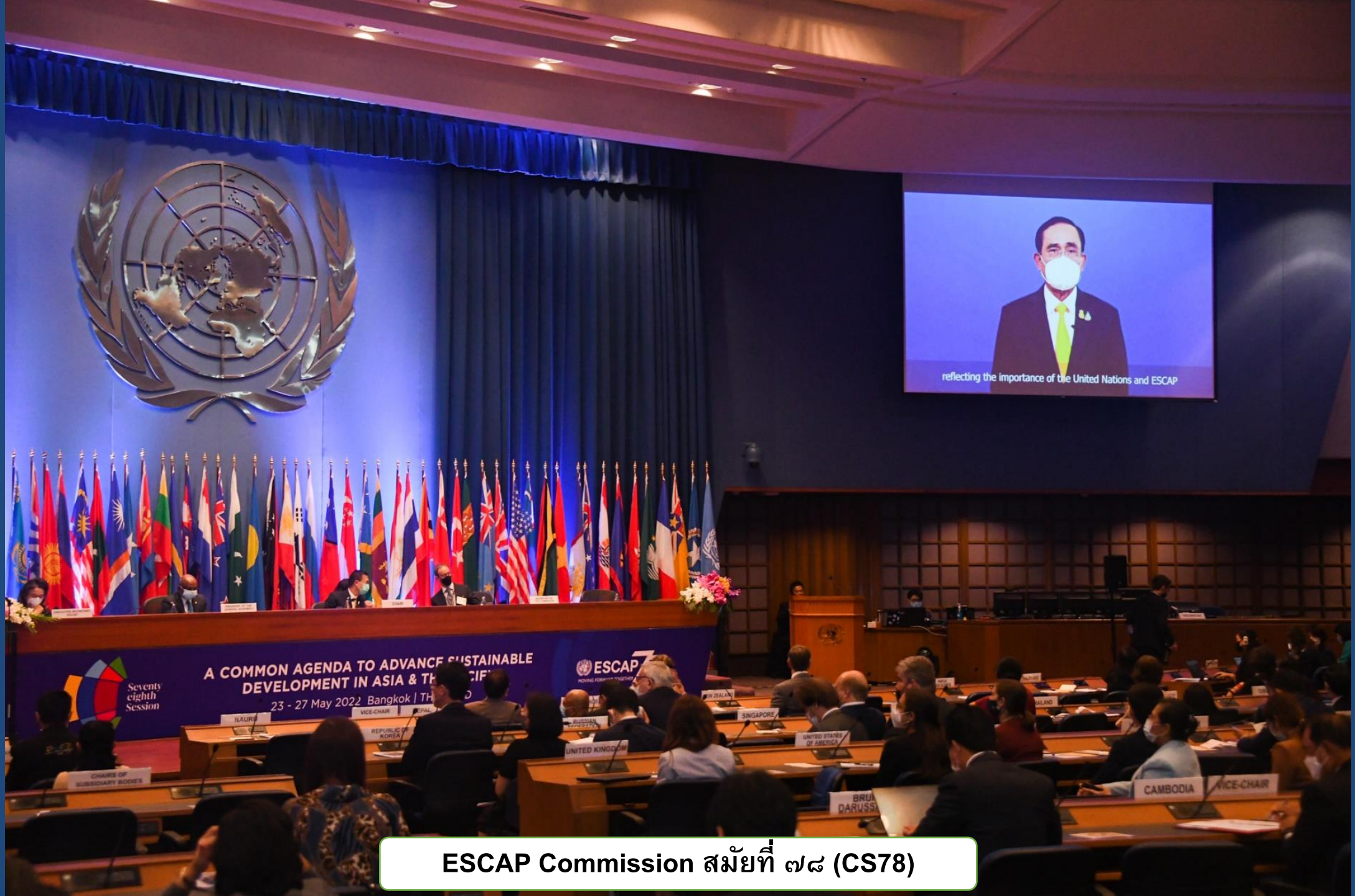
ESCAP Commission สมัยที่ ๗๘ (CS78)