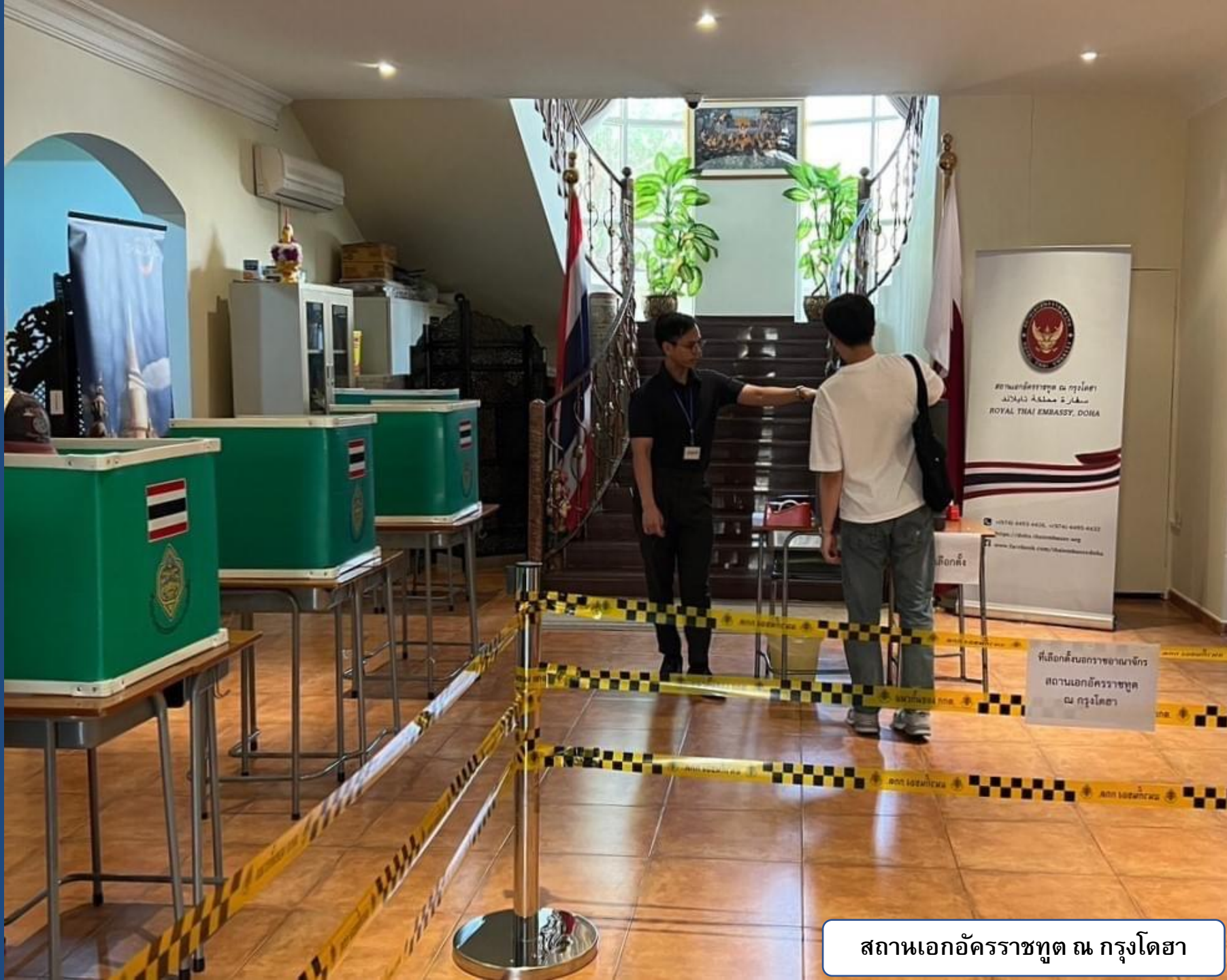
สถานเอกอัครราชทูต ณ กรุงโดฮา