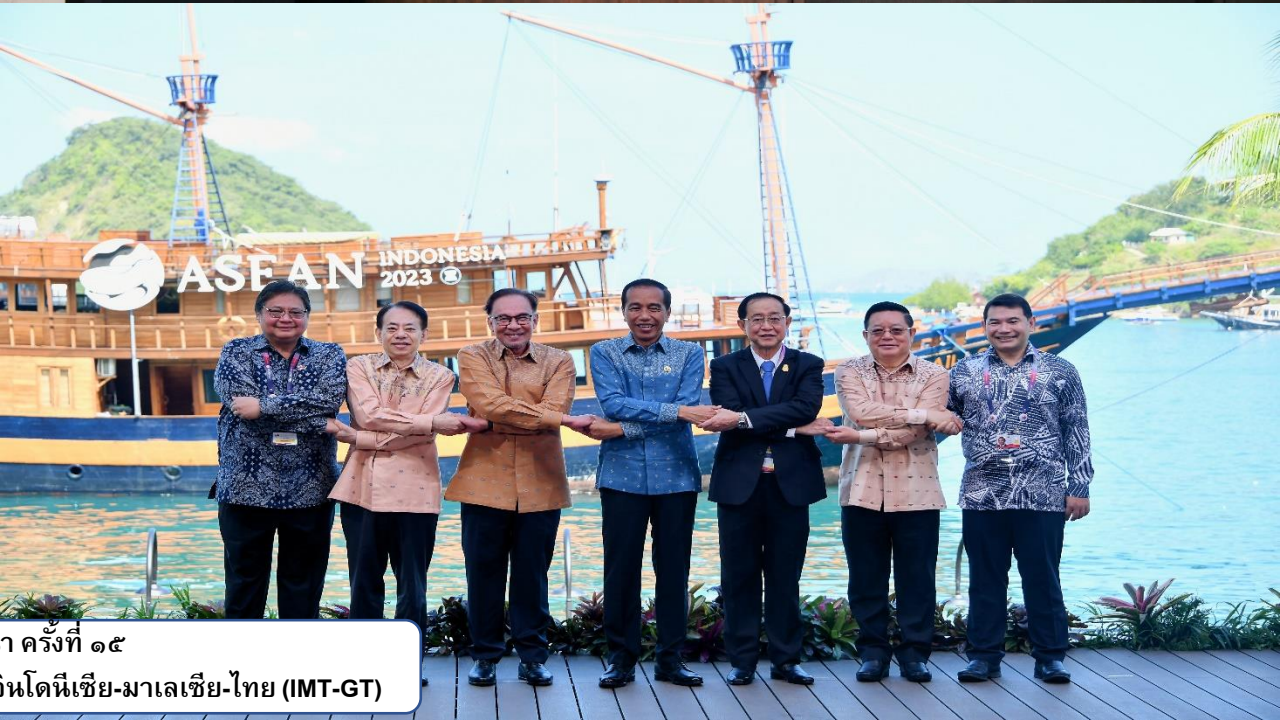
การประชุมระดับผู้นำ ครั้งที่ ๑๕ แผนงานการพัฒนาเขตเศรษฐกิจสามฝ่าย อินโดนีเซีย-มาเลเซีย-ไทย (IMT-GT)