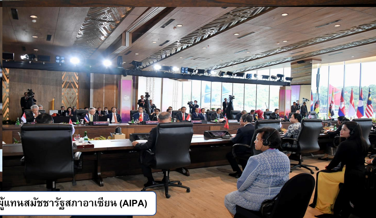
การหารือระหว่างผู้นำอาเซียนกับผู้แทนสมัชชารัฐสภาอาเซียน (AIPA)