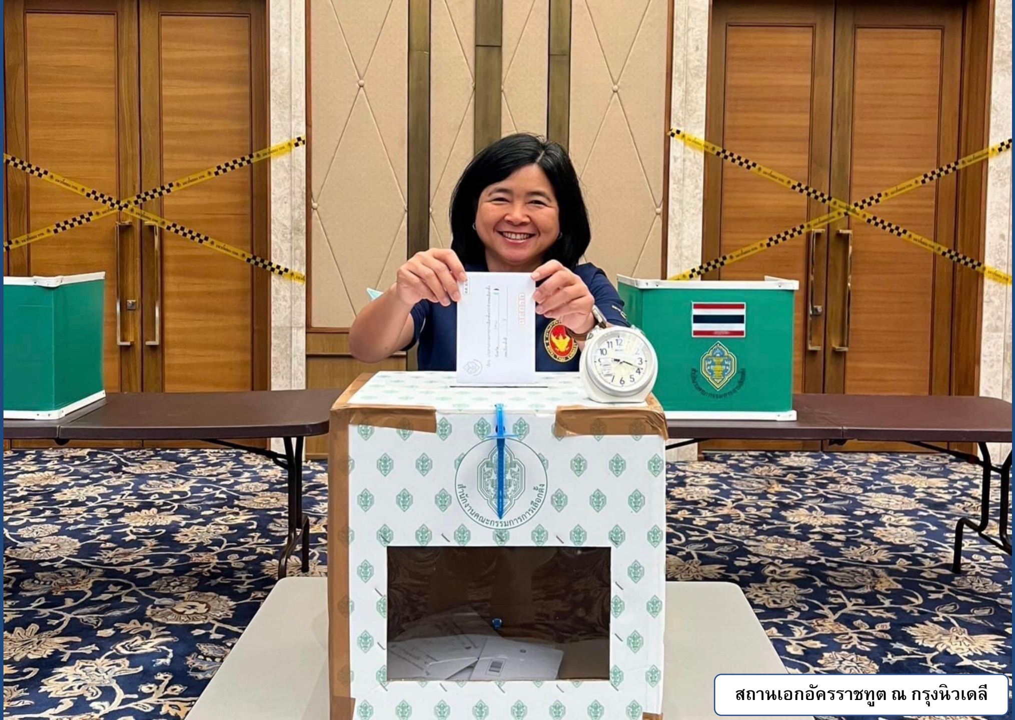
สถานเอกอัครราชทูต ณ กรุงนิวเดลี