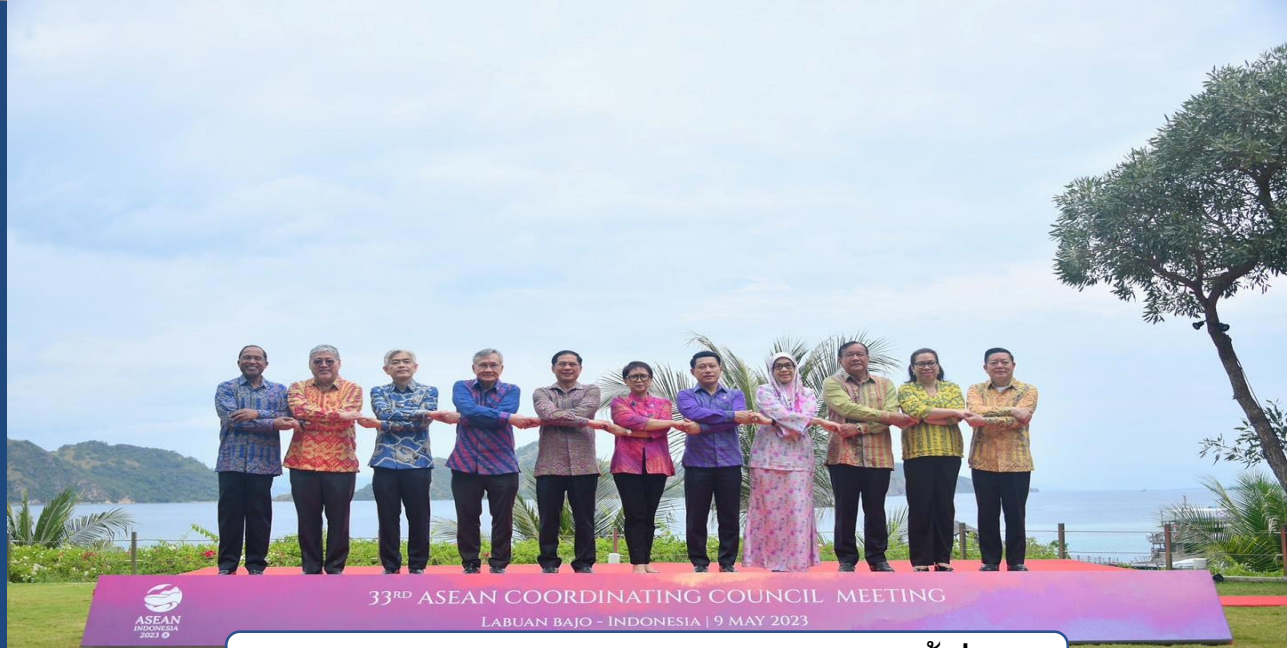
การประชุมคณะมนตรีประสาชงานอาเซียน ครั้งที่ ๓๓