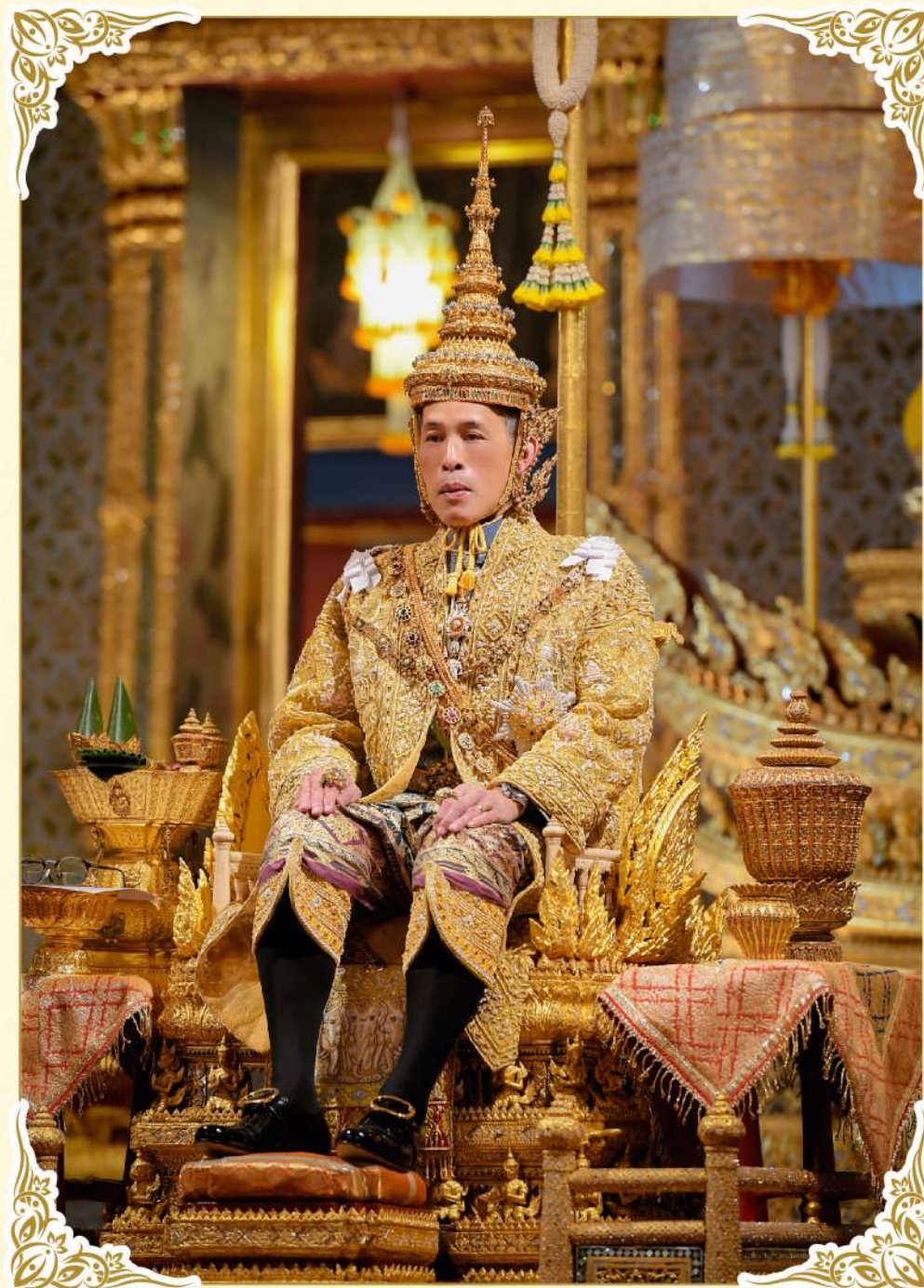
พระบาทสมเด็จพระเจ้าอยู่หัว His Majesty the King of Thailand