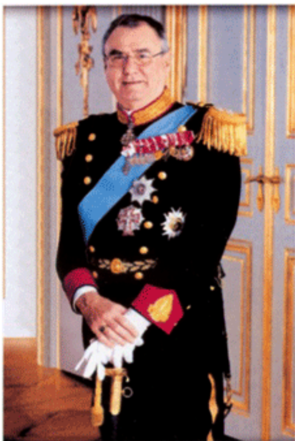
พระราชสวามีใน สมเด็จพระราชินีนาถ มาร์เกรเธอที่ ๒ แห่งเดนมาร์ก