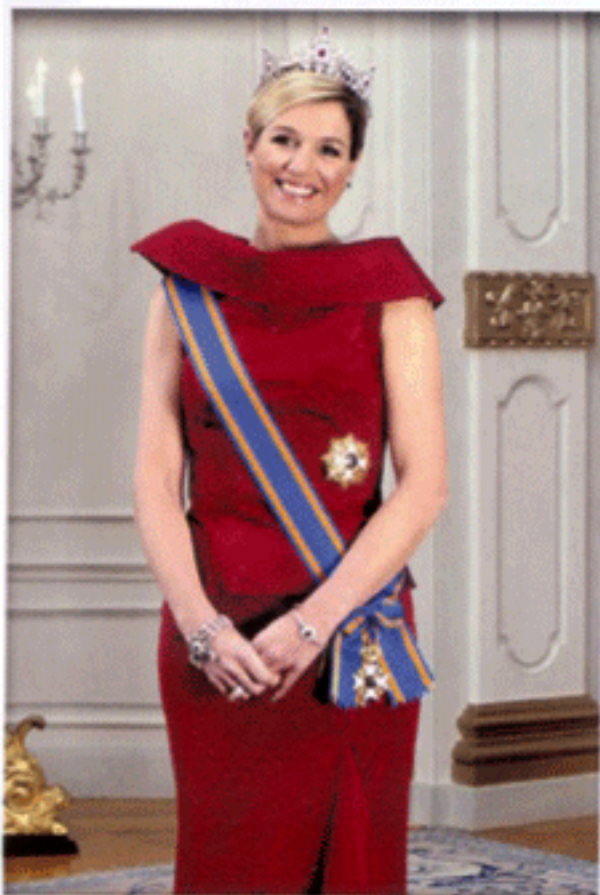
มกุฎราชกุมารี แห่งเนเธอร์แลนด์