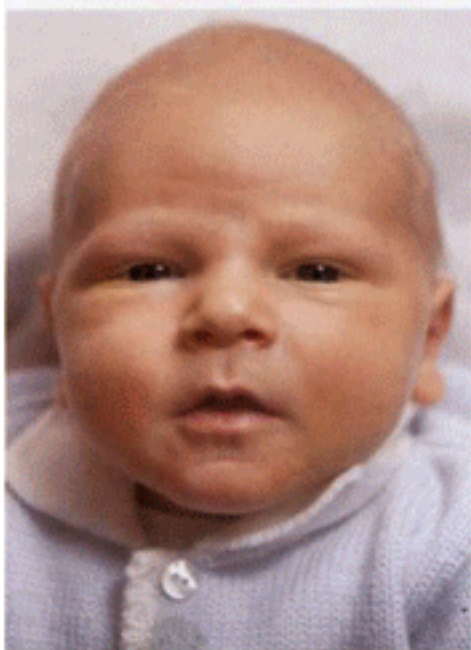
มกุฎราชกุมารีแห่งนอร์เวย์