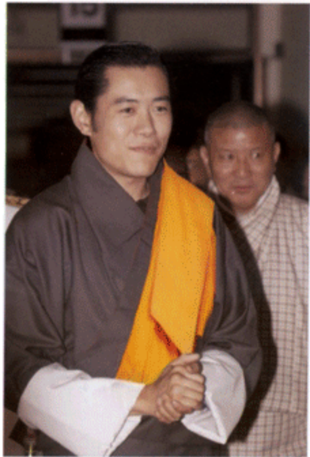
มกุฏราชกุมารแห่งภูฏาน