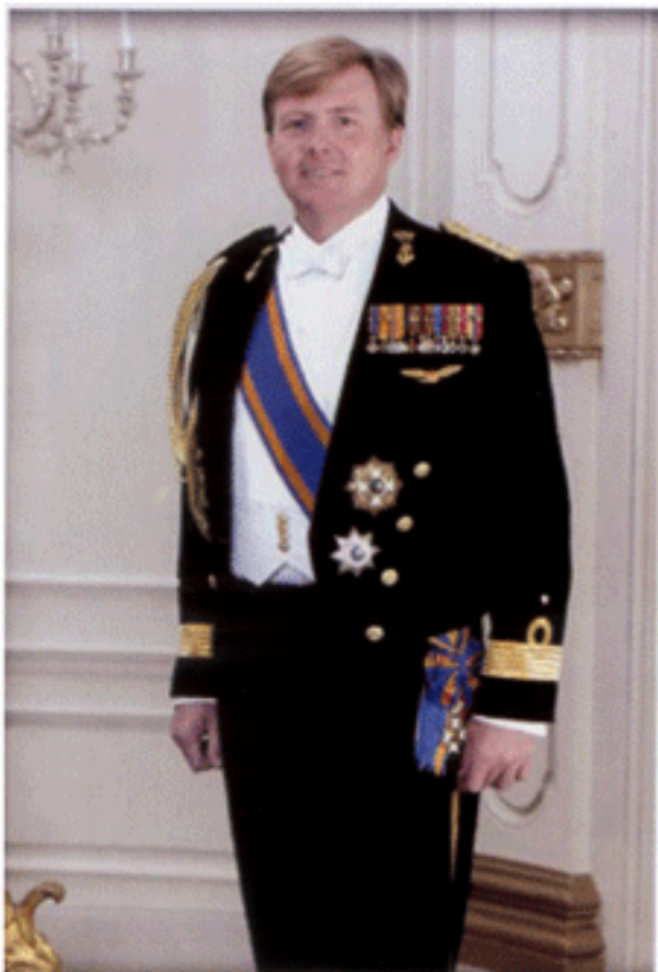
มกุฎราชกุมาร แห่งเนเธอร์แลนด์