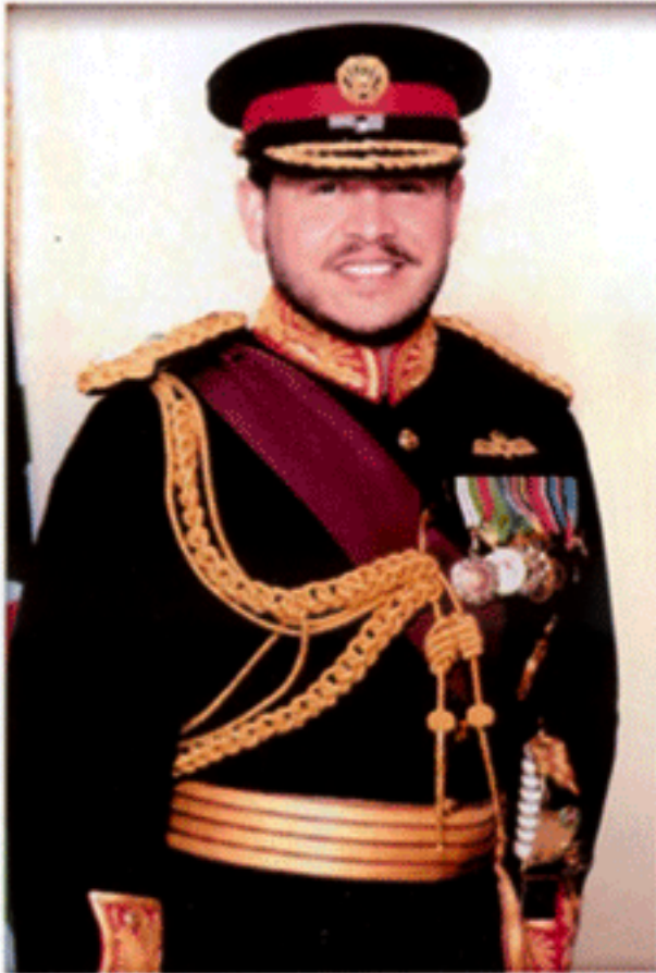
สมเด็จพระราชาธิบดีแห่ง ราชอาณาจักรไทยไมเคิลจอร์แดน