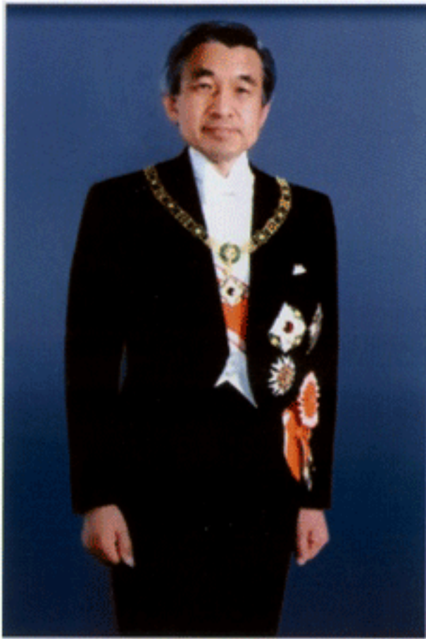
สมเด็จพระจักรพรรดิแห่งญี่ปุ่น