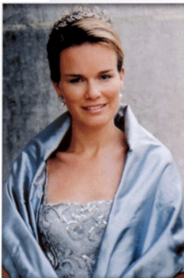
มกุฎราชกุมารีแห่งเบลเยียม