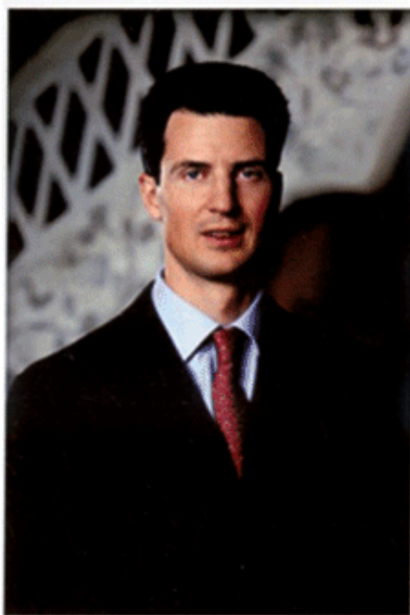
มกุฎราชกุมาร แห่งราชรัฐลิกเตนสไตน์