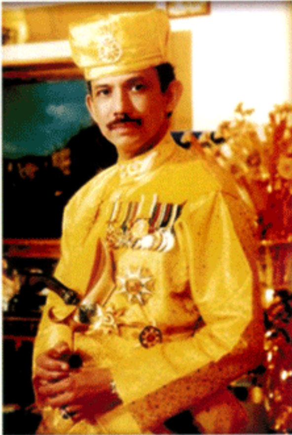
สมเด็จพระราชาธิบดี แห่งบรูไนดารุสซาลาม