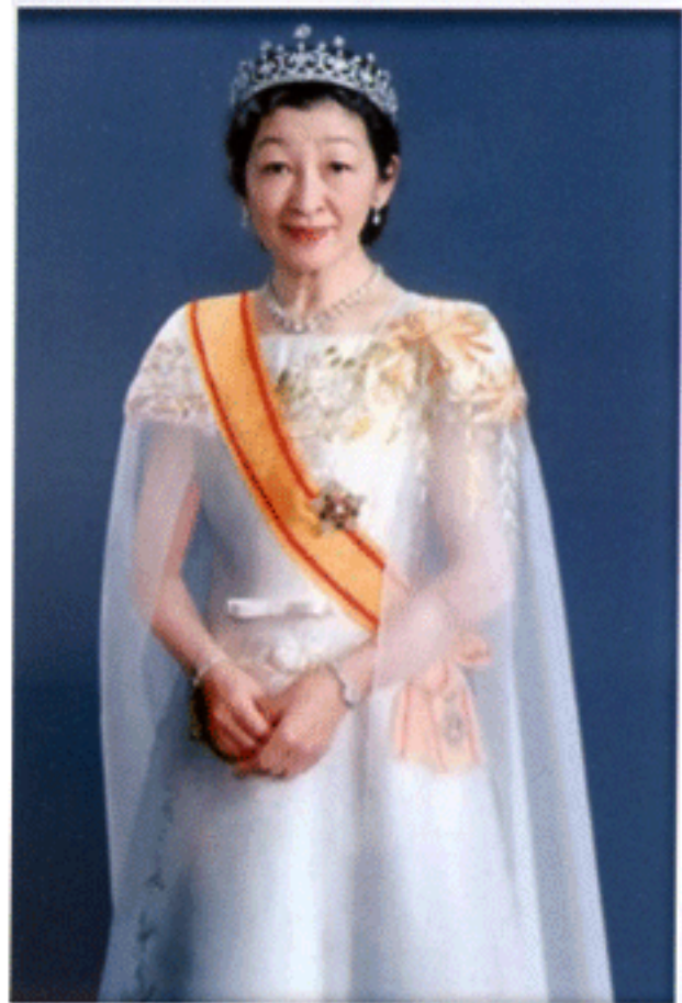
สมเด็จพระจักรพรรดินี แห่งญี่ปุ่น