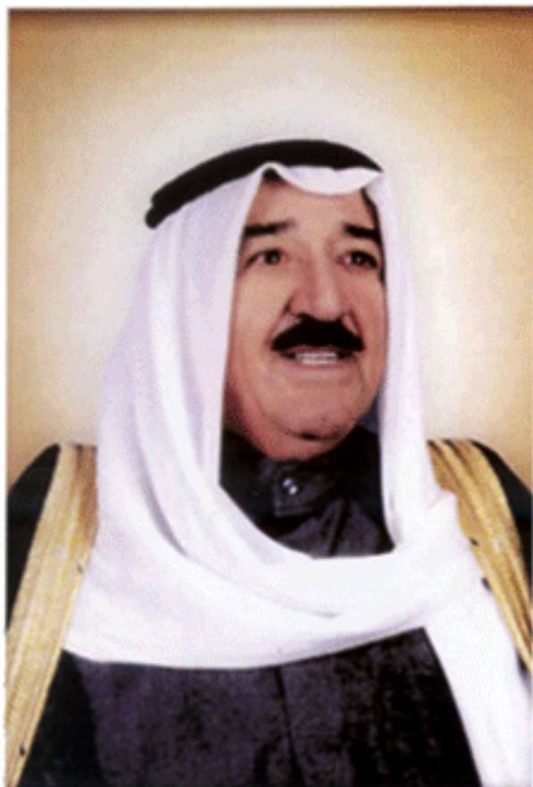
เจ้าผู้ครองรัฐคูเวต