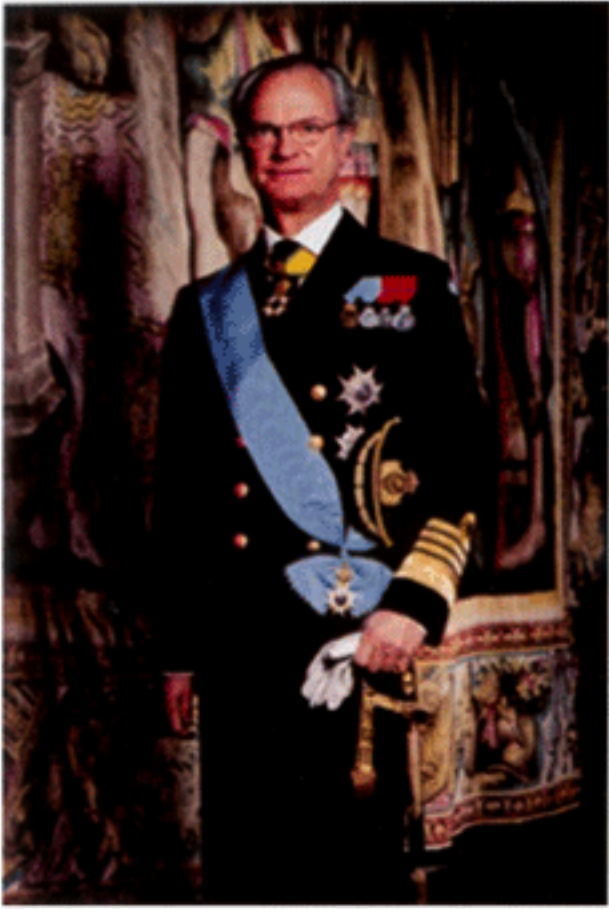
สมเด็จพระราชาธิบดีแห่งสวีเดน