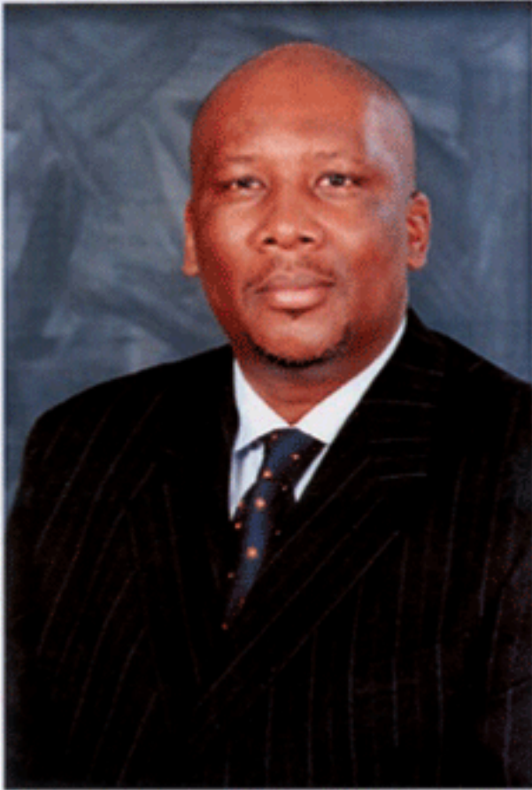
สมเด็จพระราชาธิบดี แห่งเลโซโท