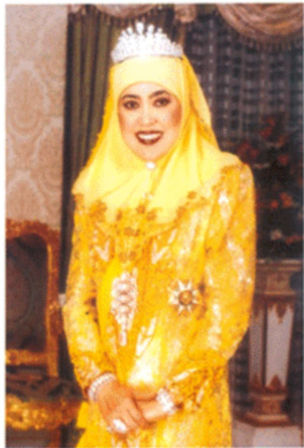
สมเด็จพระราชินี แห่งบรูไนดารุสซาลาม