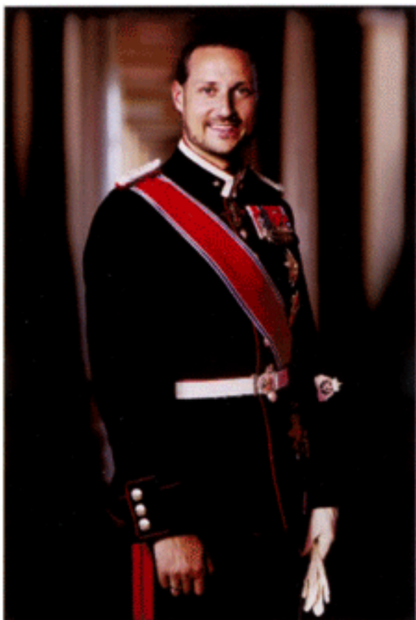
มกุฎราชกุมารแห่งนอร์เวย์