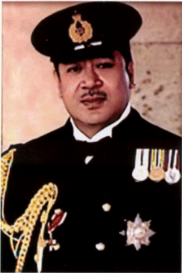
มกุฏราชกุมารแห่งตองกา