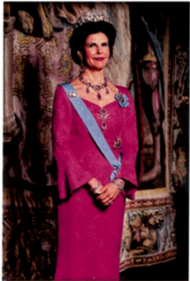
สมเด็จพระราชินีแห่งสวีเดน