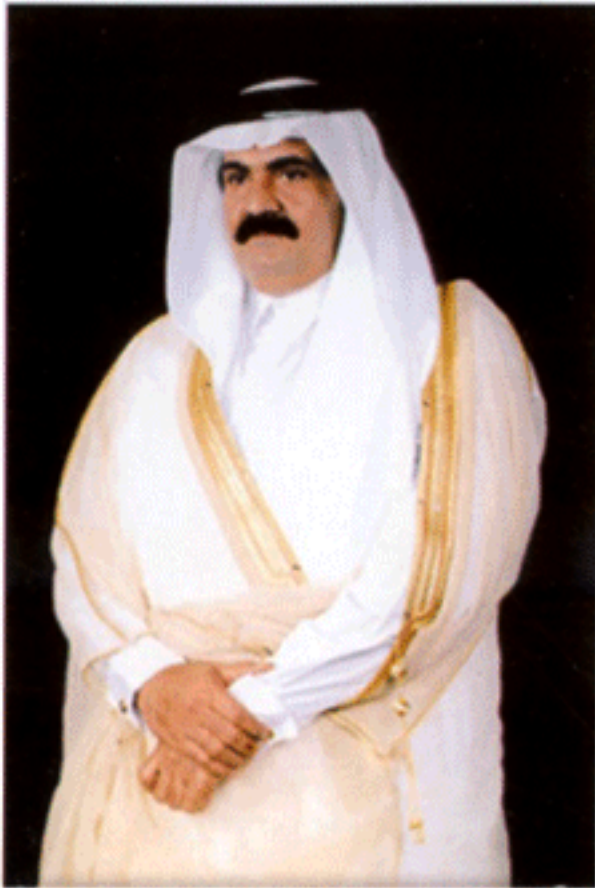
เจ้าผู้ครองรัฐกาตาร์