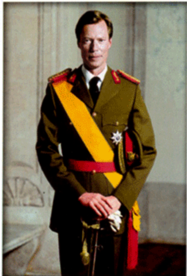
เจ้าผู้ครองราชรัฐลักเซมเบิร์ก