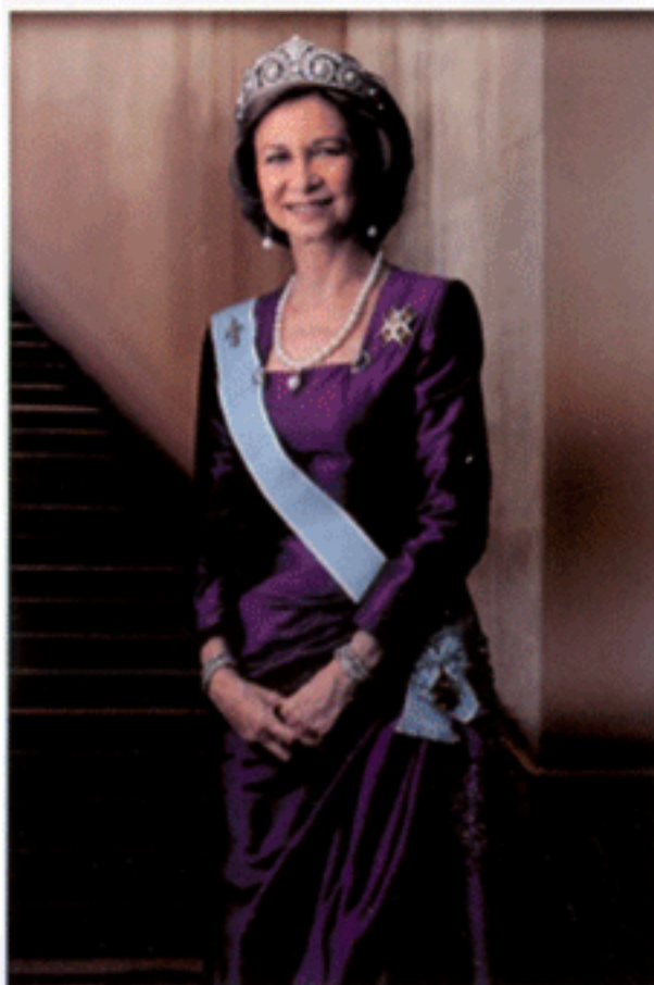
สมเด็จพระราชินีแห่งสเปน