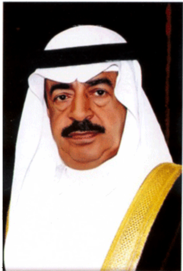
เชคคอลิฟะห์ บิน ซัลมาน อัลคอลิฟะห์ แห่งราชอาณาจักรบาห์เรน