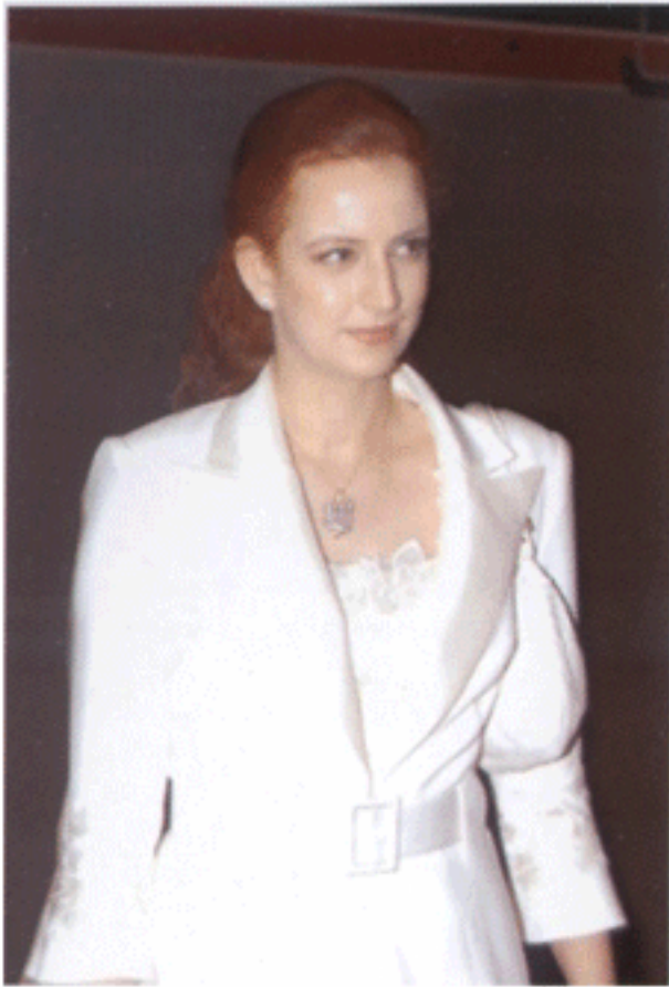
พระชายาใน สมเด็จพระราชาธิบดี แห่งโมร็อกโก