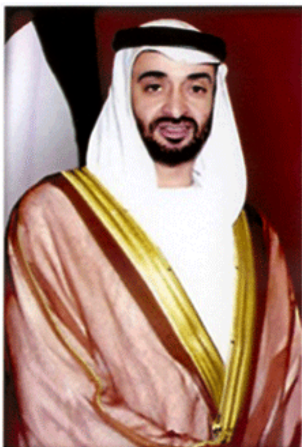
มกุฎราชกุมารแห่งอาบูดาบี สหรัฐอาหรับเอมิเรตส์