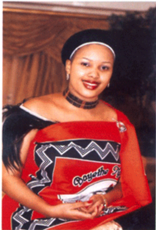
พระชายาใน สมเด็จพระราชาธิบดีสวาซิที่ ๑ แห่งสวาซิแลนด์