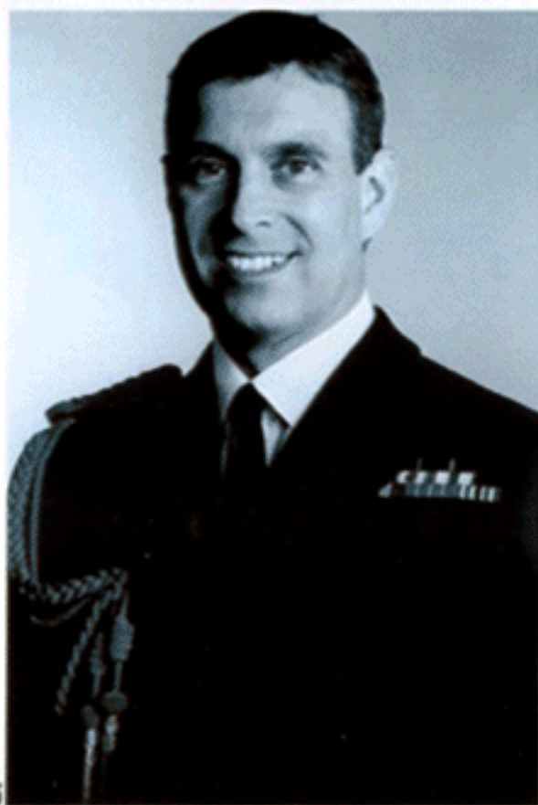
ดยุกแห่งยอร์ก สหราชอาณาจักร