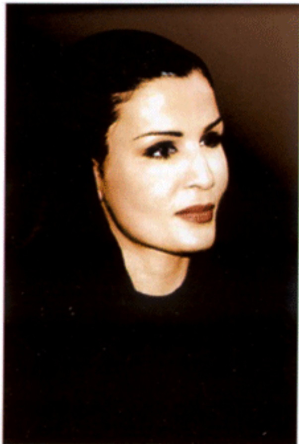
พระชายาในเจ้าผู้ครองรัฐกาตาร์