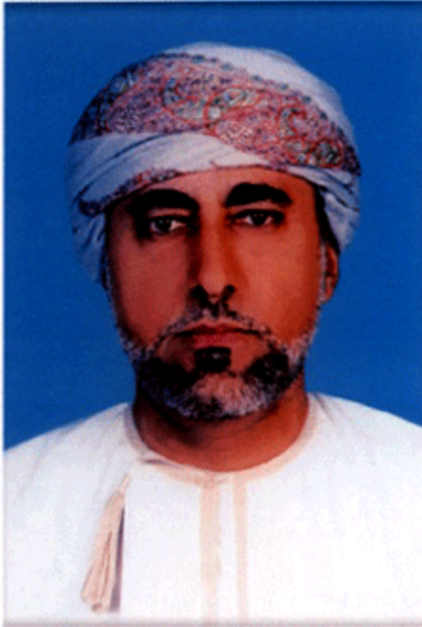
เจ้าชายชัยยิด ชีซาบ บิน ตาริก ดัยมูร อัล-ซาอิด แห่งรัฐสุลต่านโอมาน