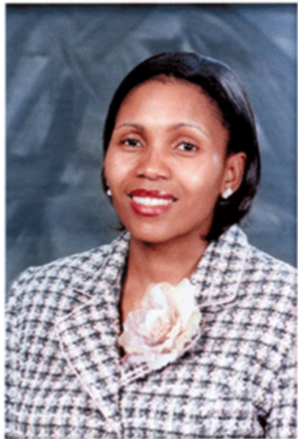
สมเด็จพระราชินีแห่งเลโซโท