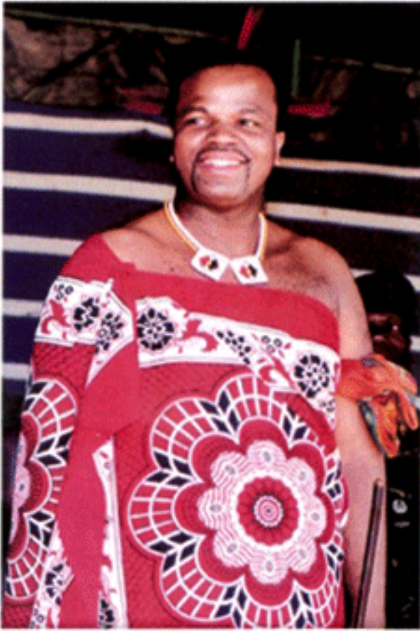
สมเด็จพระราชาธิบดี แห่งสวาซิแลนด์