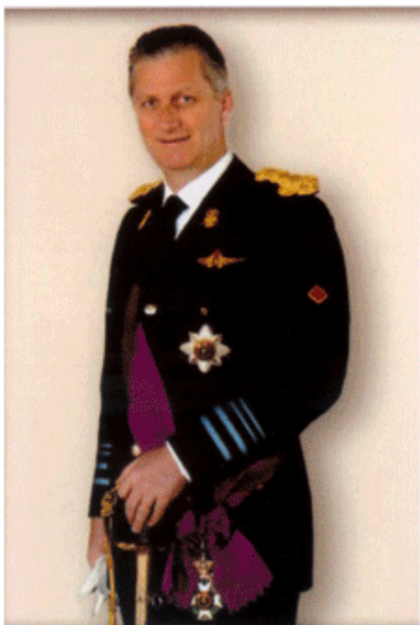
มกุฎราชกุมารแห่งเบลเยียม