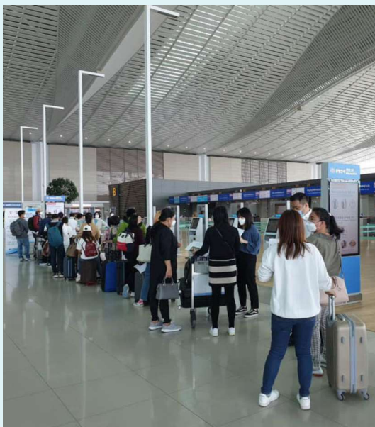
ผู้โดยสารจำนวนมากที่รอขึ้นเครื่องหรือรอเปลี่ยนเครื่องเพื่อบินกลับประเทศไทย ณ ท่าอากาศยานอินชอน

หากเอ่ยชื่อประเทศเกาหลีหลายคนคงประหลาดใจไปถึงกิมจิ สหยาผู้กอง หรือแม้กระทั่งวงดนตรีวัยรุ่น อย่าง BTS BLACKPINK และ GOT7 ดินแดนแห่งนี้เป็นจุดหมายปลายทางของคนไทยมากมาย ทั้งเพื่อการท่องเที่ยว การศึกษา และการทำงาน และคงไม่มีใครคาดคิดว่า ด้วยสถานการณ์การแพร่ระบาดของโรคติดเชื้อไวรัสโคโรนา หรือ โควิด-19 จะเป็นเหตุให้ดินแดนในภาพจำของตนเองเปลี่ยนไปโดยฉับพลัน จากบรรยากาศที่เคย