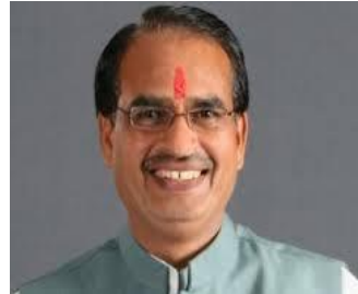
Shri. Shivraj Singh Chouhan

ผู้ว่าการรัฐ เข้ารับตำแหน่งเมื่อวันที่ 8 ก.ย.54 สังกัดพรรค INC