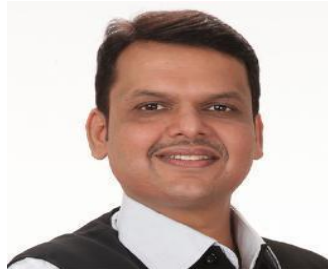
Shri. Devendra Fadnavis