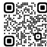
QR Code เว็บไซต์ สถานกงสุลใหญ่ฯ เพื่อศึกษาข้อมูลการเตรียมเอกสารฯ