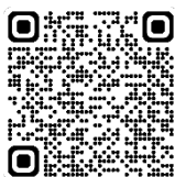
QR Code แบบลงทะเบียน ขอรับบริการฯ