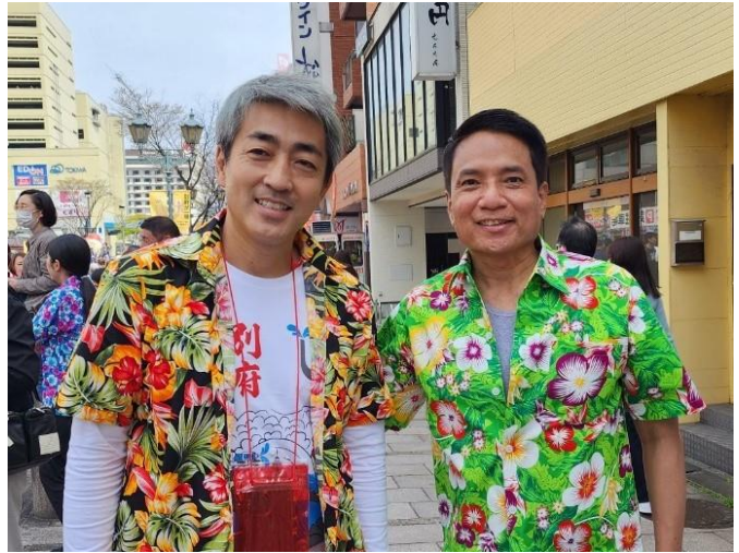
กงสุลใหญ่ฯ และผู้อำนวยการ ททท. สำนักงานฟูกูโอกะ ร่วมเดินพาเหรดในนามทีมประเทศไทย ในเทศกาล Beppu Hatto Onsen Matsuri