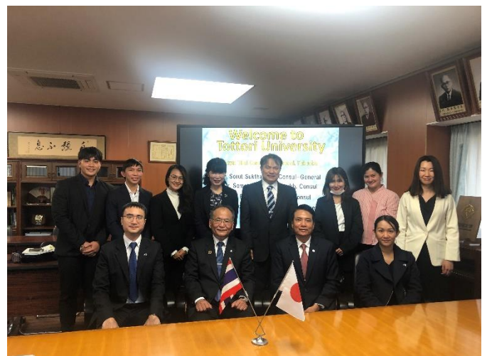
การพบหารือกับอธิการบดีมหาวิทยาลัยทตโตริ และพบเยี่ยมผู้แทนนักศึกษาไทย