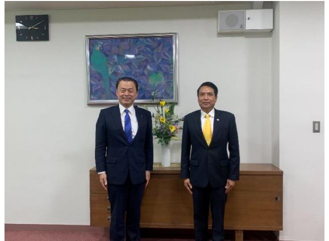
การเข้าเยี่ยมชมคารวะผู้ว่าราชการจังหวัดชิมาเนะ