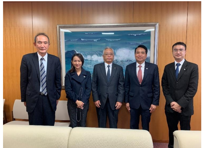
การพบหารือกับประธานสภาหอการค้าและอุตสาหกรรมเมืองมัตสึเอะ จังหวัดชิมาเนะ