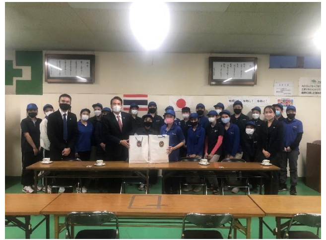
การพบเยี่ยมผู้ฝึกงานชาวไทยในบริษัท Iwakura จังหวัดชิมาเนะ