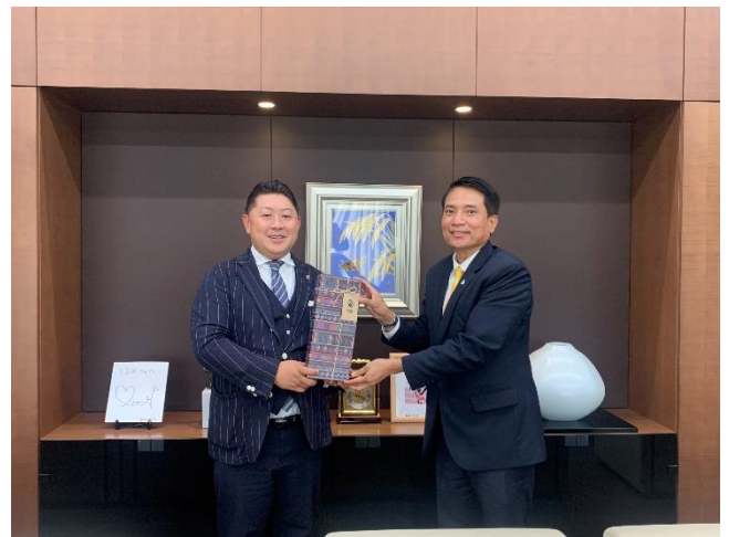
การพบหารือกับรองประธานสภาหอการค้าและอุตสาหกรรมทตโตริ