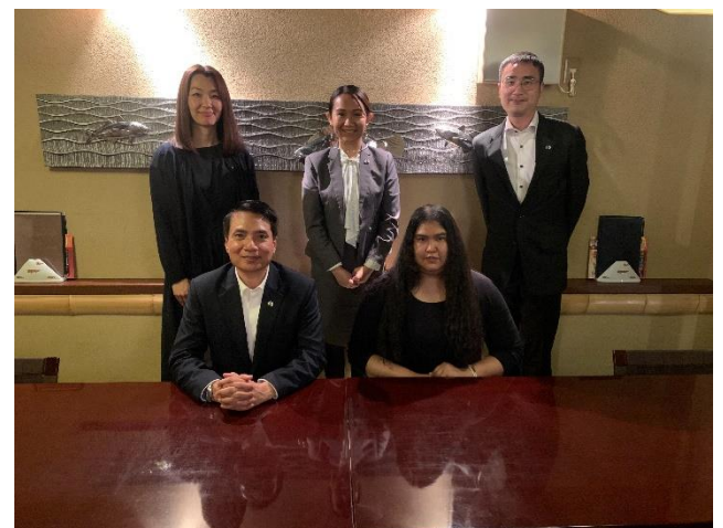
การพบหารือกับรองอธิการบดีมหาวิทยาลัยชิมาเนะ และพบเยี่ยมผู้แทนนักศึกษาไทย