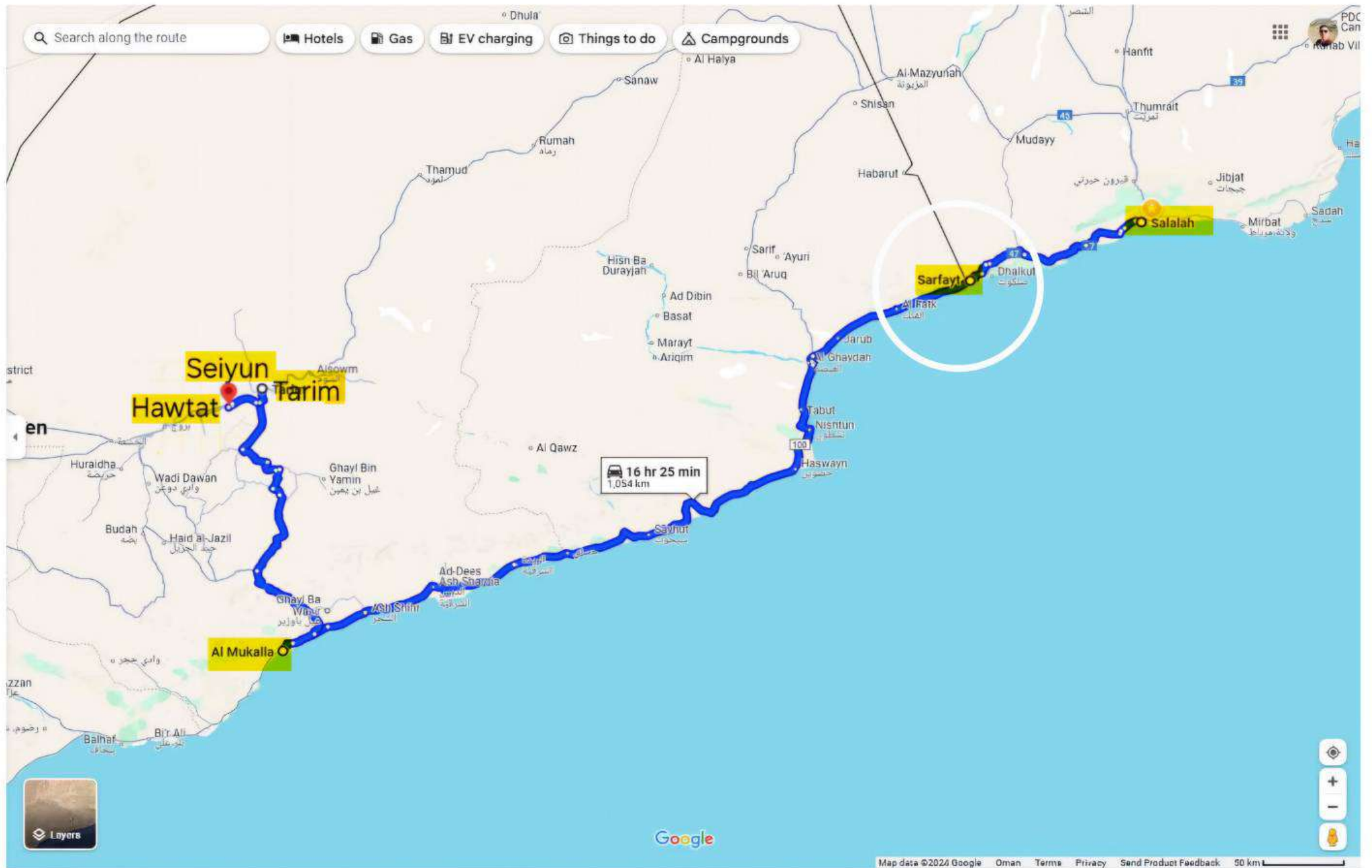
เส้นทาง Salah - Sarfayt - Mukalla - Tarim - Seiyun