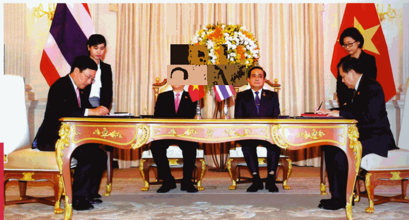
Prime Ministers of Viet Nam and Thailand witnessed the signing of important cooperation agreements, July 2015 in Bangkok.