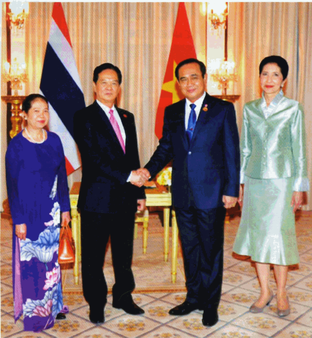
Thủ tướng Việt Nam Nguyễn Tấn Dũng và Thủ tướng Thái Lan Prayut Chan-o-cha, tại Thủ đô Bangkok ngày 23/7/2015.