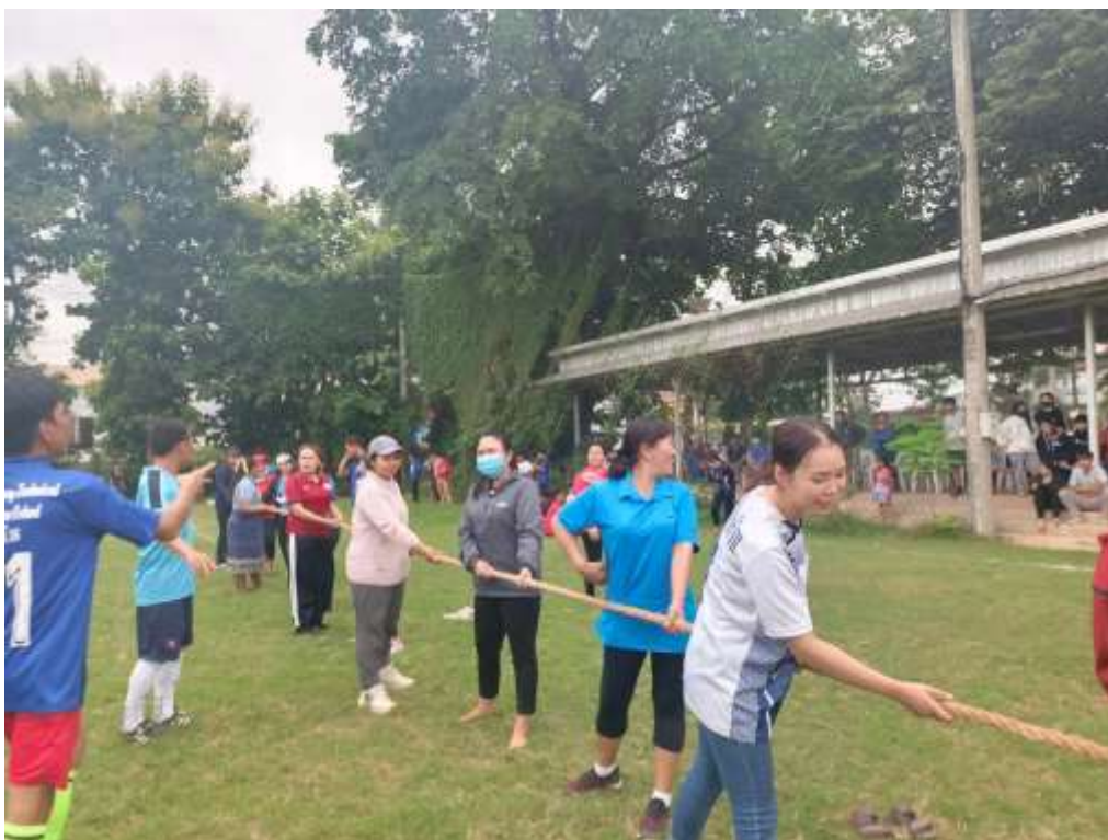
ภาพที่ 12 อาสาสมัครเข้าร่วมแข่งขันชกเย่อกิจกรรมกีฬาสัมพันธ์ระหว่างสถาบันเศรษฐกิจการเงินกับ วิทยาลัยเทคนิคสิรินธรดงคำซ่าง