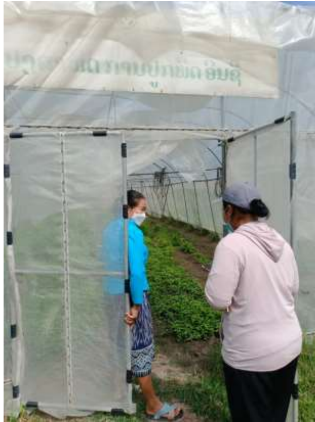
ภาพที่ 1 การสำรวจพื้นที่และฐานกิจกรรมภายในศูนย์เรียนรู้ ในส่วนของโรงเรือนปลูกผัก