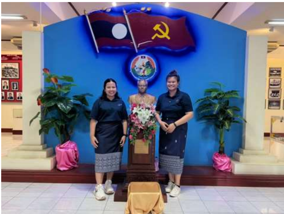
ภาพที่ 9 อาสาสมัครเพื่อนไทยทั้ง 2 คนเข้าร่วมทัศนศึกษาที่พิพิธภัณฑ์แม่หญิงลาว ณ สปป. ลาว