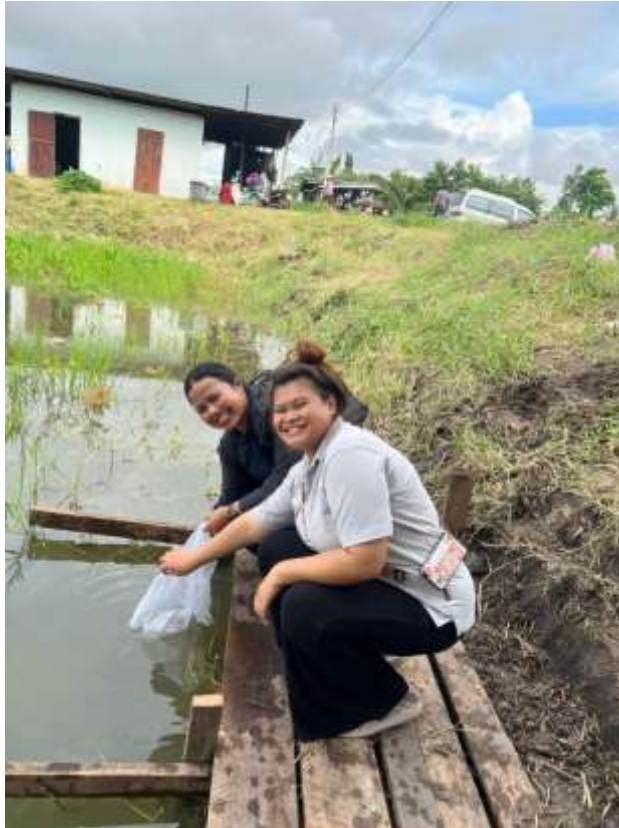
ภาพที่ 8 อาสาสมัครเพื่อนไทยทั้ง 2 คนร่วมกันปล่อยปลา ในวันปล่อยปลาแห่งชาติ