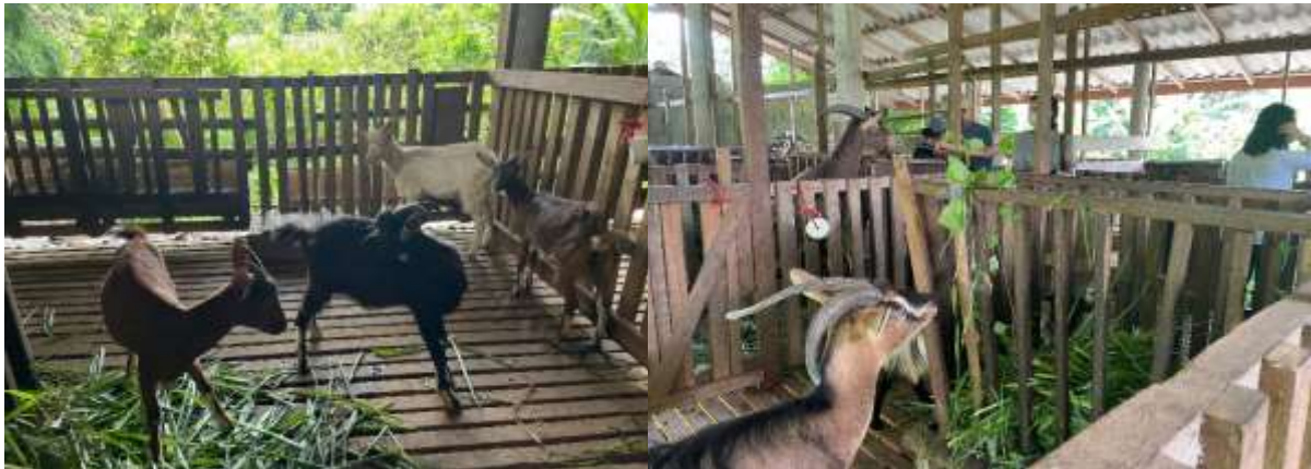
ภาพที่ 5 ภาพความเป็นอยู่ของแพะภายในโรงเรือน