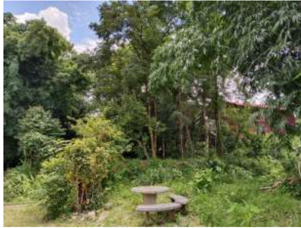
ภาพที่ 1 การตกแต่งสวนภายในฟาร์ม