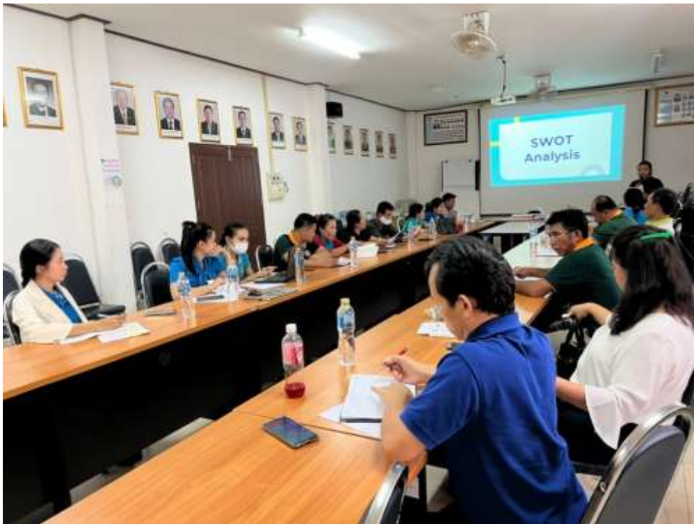
ภาพที่ 11 อาสาสมัครได้ประชุมระดมความคิดเห็นโดยใช้การร่วมกันวิเคราะห์ SWOT Analysis