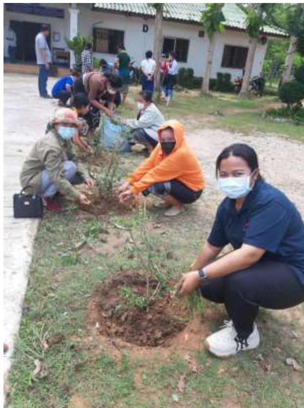
ภาพที่ 5 ปลุกดอกคุณนายตื่นสายตกแต่งบริเวณทางเดินวิทยาลัยร่วมกับคุณครู ในวันกรรมกรสากล