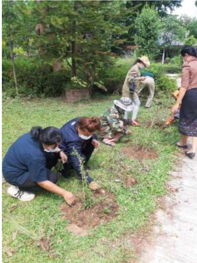
ภาพที่ 5 ปลุกดอกคุณนายตื่นสายตกแต่งบริเวณทางเดินวิทยาลัย ในวันกรรมกรสากล