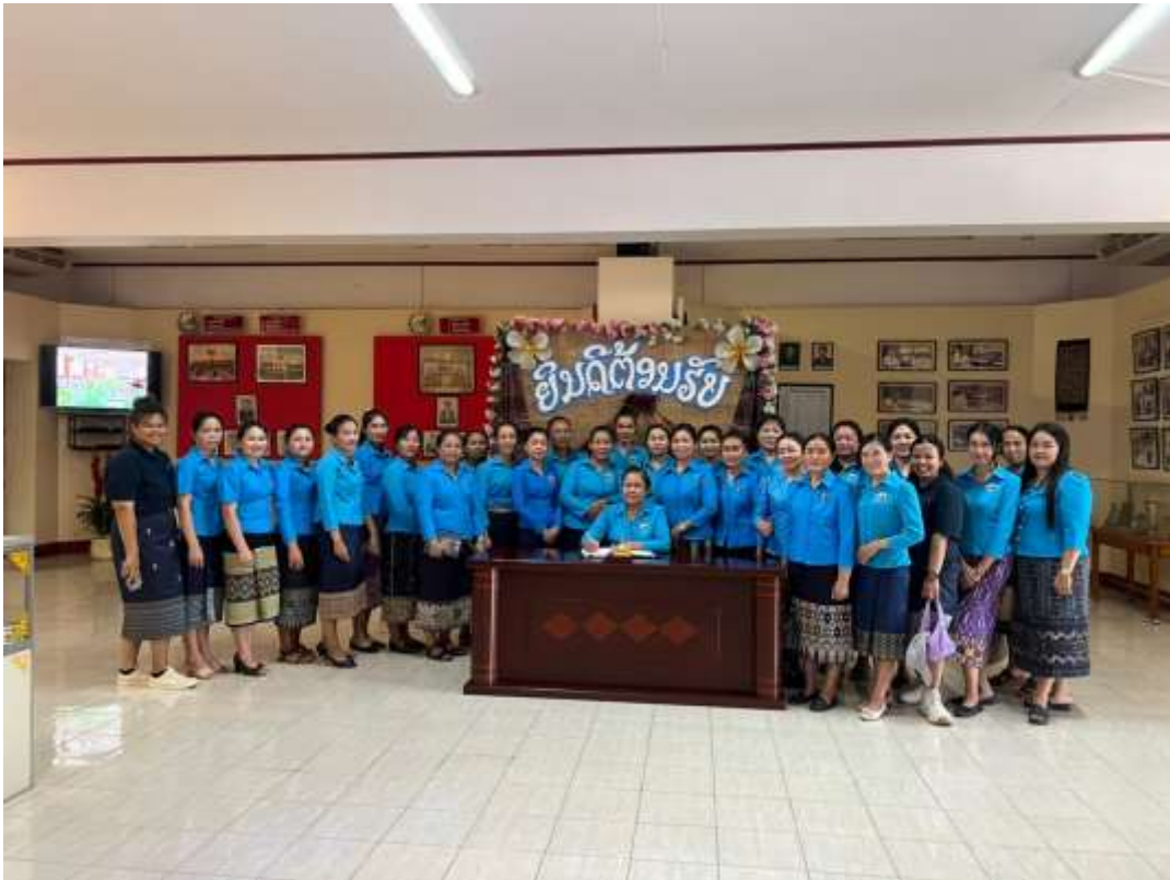
ภาพที่ 10 อาสาสมัครเพื่อนไทยทั้ง 2 คนถ่ายรูปพร้อมกับคณะคุณครูที่เข้าร่วมทัศนศึกษา ที่พิพิธภัณฑ์แม่หญิงลาว ณ สปป. ลาว