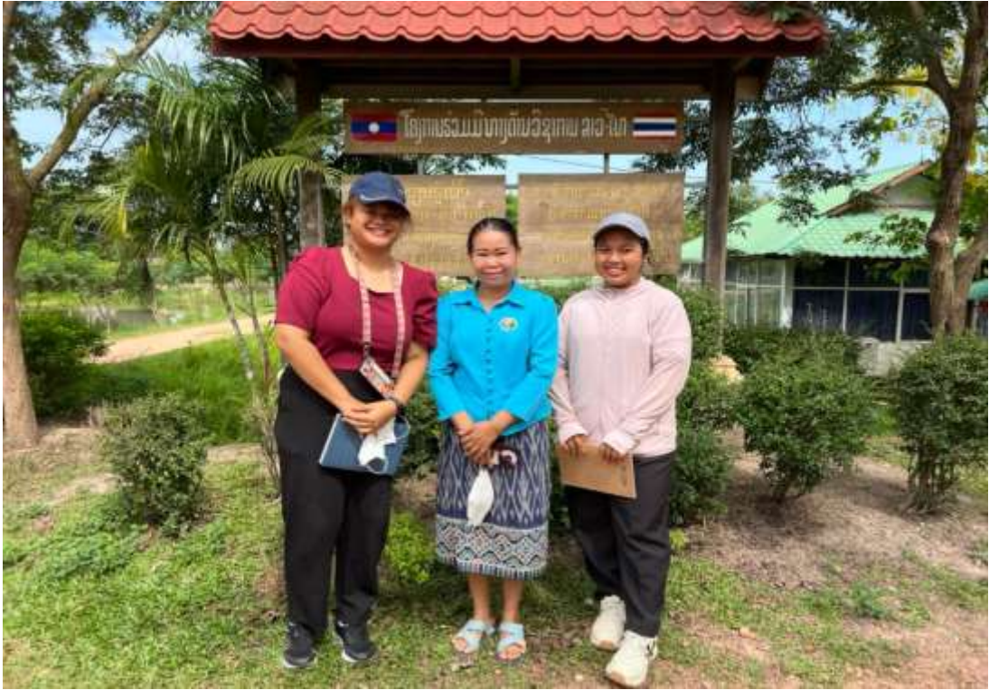
ภาพที่ 3 ถ่ายรูปกับคุณครูที่นำสำรวจพื้นที่และฐานกิจกรรมภายในศูนย์เรียนรู้ บริเวณป่าชุมชนศูนย์เรียนรู้