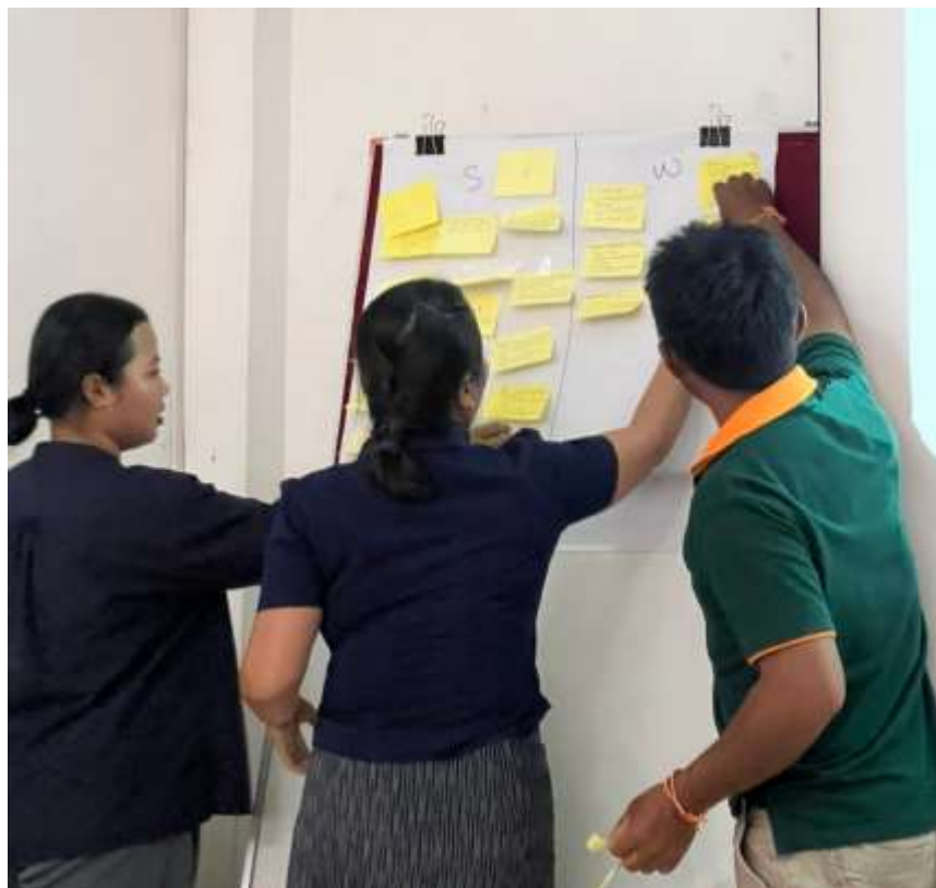
ภาพที่ 11 อาสาสมัครและคุณครูช่วยกันระดมความคิดเห็นและทำการตีความความคิดเห็นของคุณครูตามหัวข้อ ของการวิเคราะห์SWOT Analysis