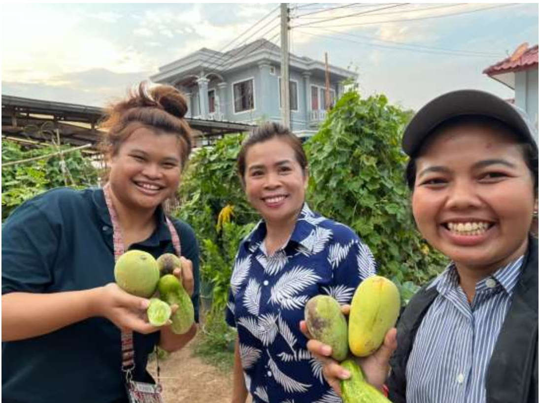
ภาพที่ 4 เยี่ยมบ้านคุณครูที่มีการทำเกษตรภายในครัวเรือน และได้รับผลไม้จากบ้านคุณครูกลับไปฝาก