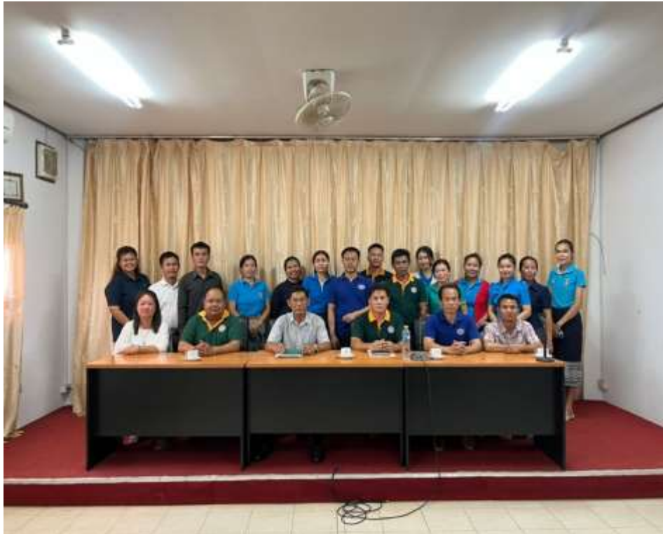
ภาพที่ 12 อาสาสมัครถ่ายภาพร่วมกับคณะคุณครูที่เข้าร่วมประชุมระดมความคิดเห็น โดยใช้การร่วมกันวิเคราะห์SWOT Analysis