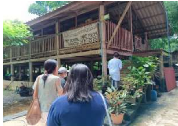
ภาพที่ 4 โรงเรือนแพะ