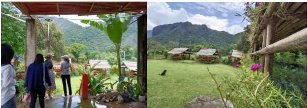
ภาพที่ 3 บรรยากาศภายในร้านอาหาร