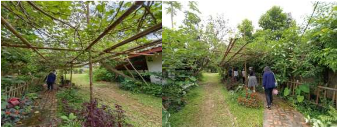
ภาพที่ 2 ทางเดินระหว่างร้านอาหารไปสู่โรงเรือนแพะ เป็นซุ้มต้นหม่อน