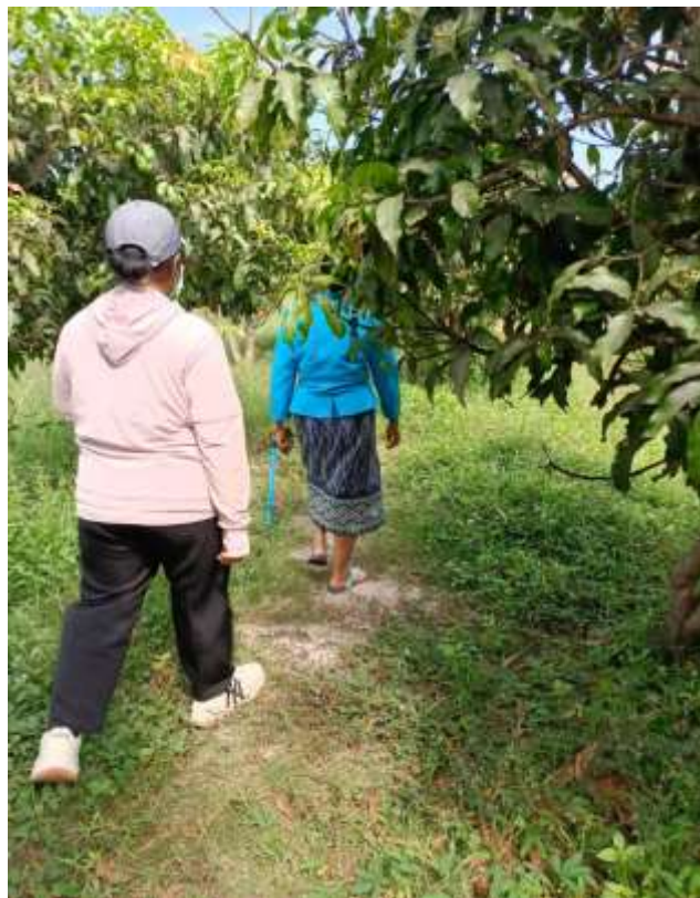
ภาพที่ 2 การสำรวจพื้นที่และฐานกิจกรรมภายในศูนย์เรียนรู้ ในส่วนของสวนมะม่วง