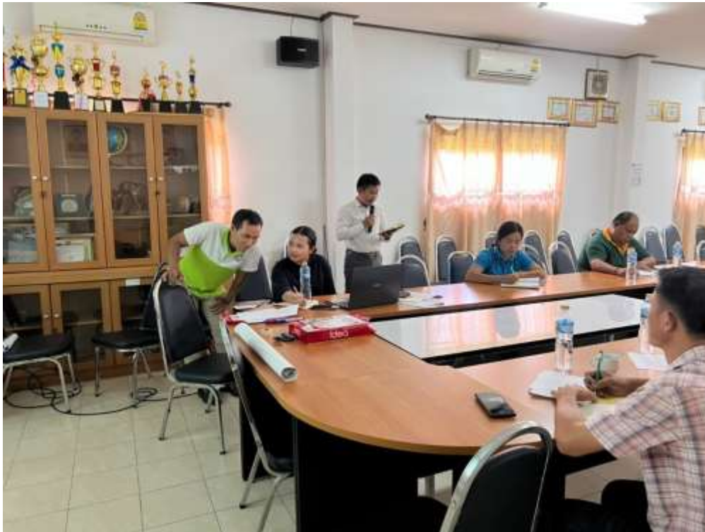
ภาพที่ 11 อาสาสมัครได้ประชุมระดมความคิดเห็นโดยใช้การร่วมกันวิเคราะห์SWOT Analysis ได้รับความร่วมมือกับเจ้าหน้าที่สมทบร่วมกันดำเนินการประชุมระดมความคิดเห็นและอธิบาย รายละเอียดแก่คณะคุณครูที่เข้าร่วมประชุม